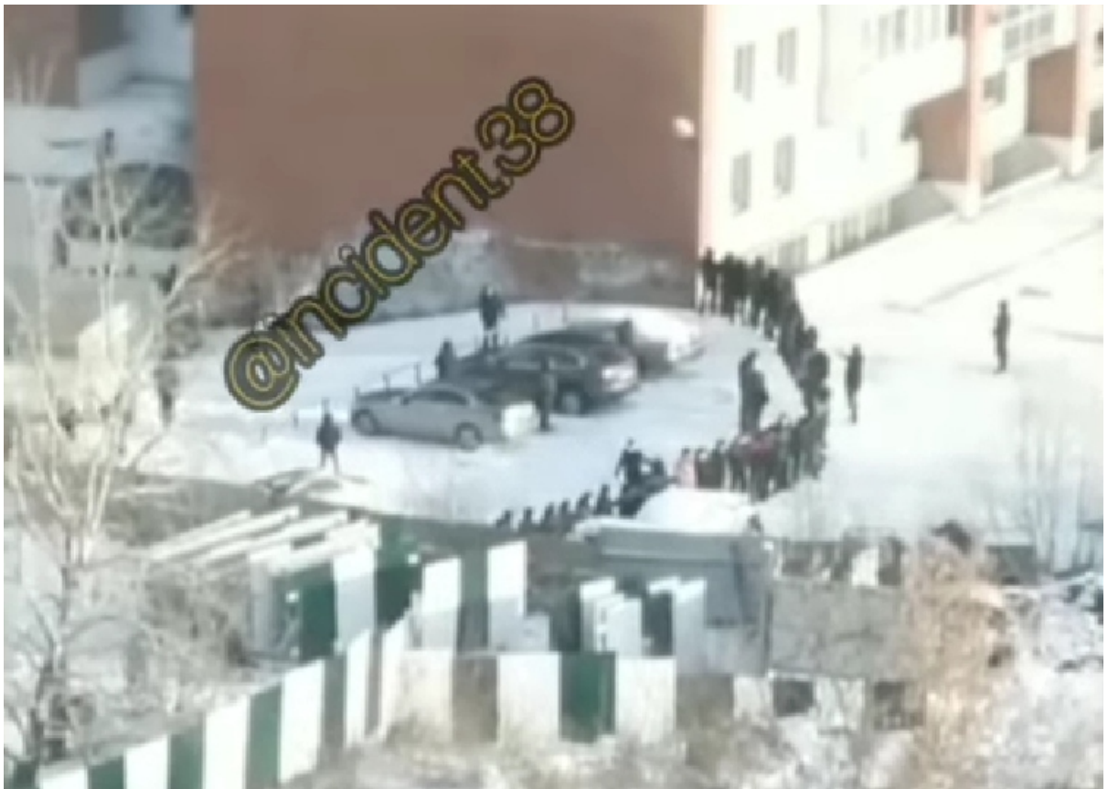
забастовки, февраль 2020 года

К слову, в ЖК «Союз» проблема инфраструктуры, школ, больниц, детских садов и площадок полностью не решена до сих пор, тогда как со времени сдачи домов в эксплуатацию прошло уже почти десять лет. Собственники других квартир, построенных Грандстроем страдают примерно от тех же проблем.