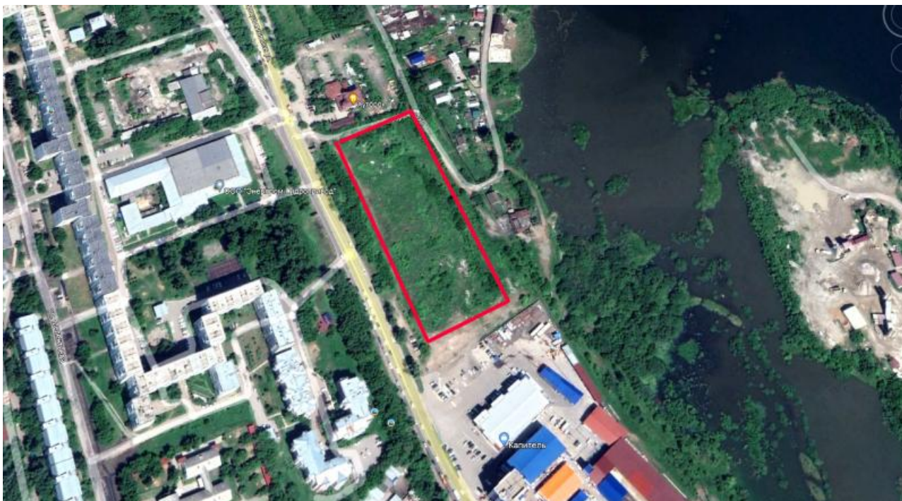
Участок между рестораном «Хуторок» и торговым центром «Капиталь», место строительства будущего ЖК, кадастровый номер участка 38:36:000029:21473

Нарастающий в Иркутске скандал вокруг Старо-Кузьмихинских земель вызывает огромное количество вопросов, в первую очередь к должностным лицам.