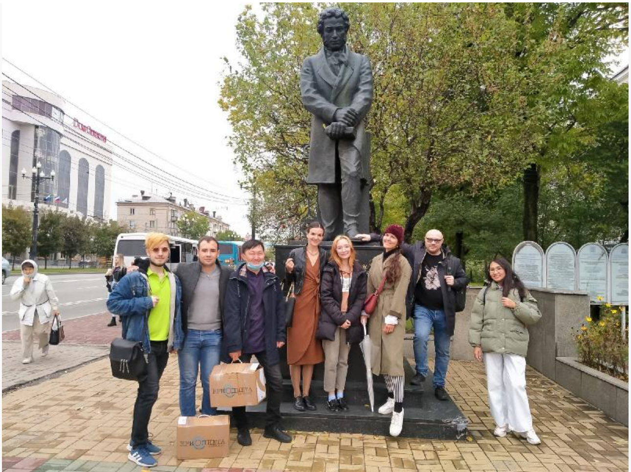
Школа писателей ДВФО (Хабаровск)

Автор: Анна Амгейзер © Babr24 КУЛЬТУРА, ОБЩЕСТВО, МИР, ИРКУТСК, РОССИЯ 👁 23721 09.02.2022, 10:25 🔄 592