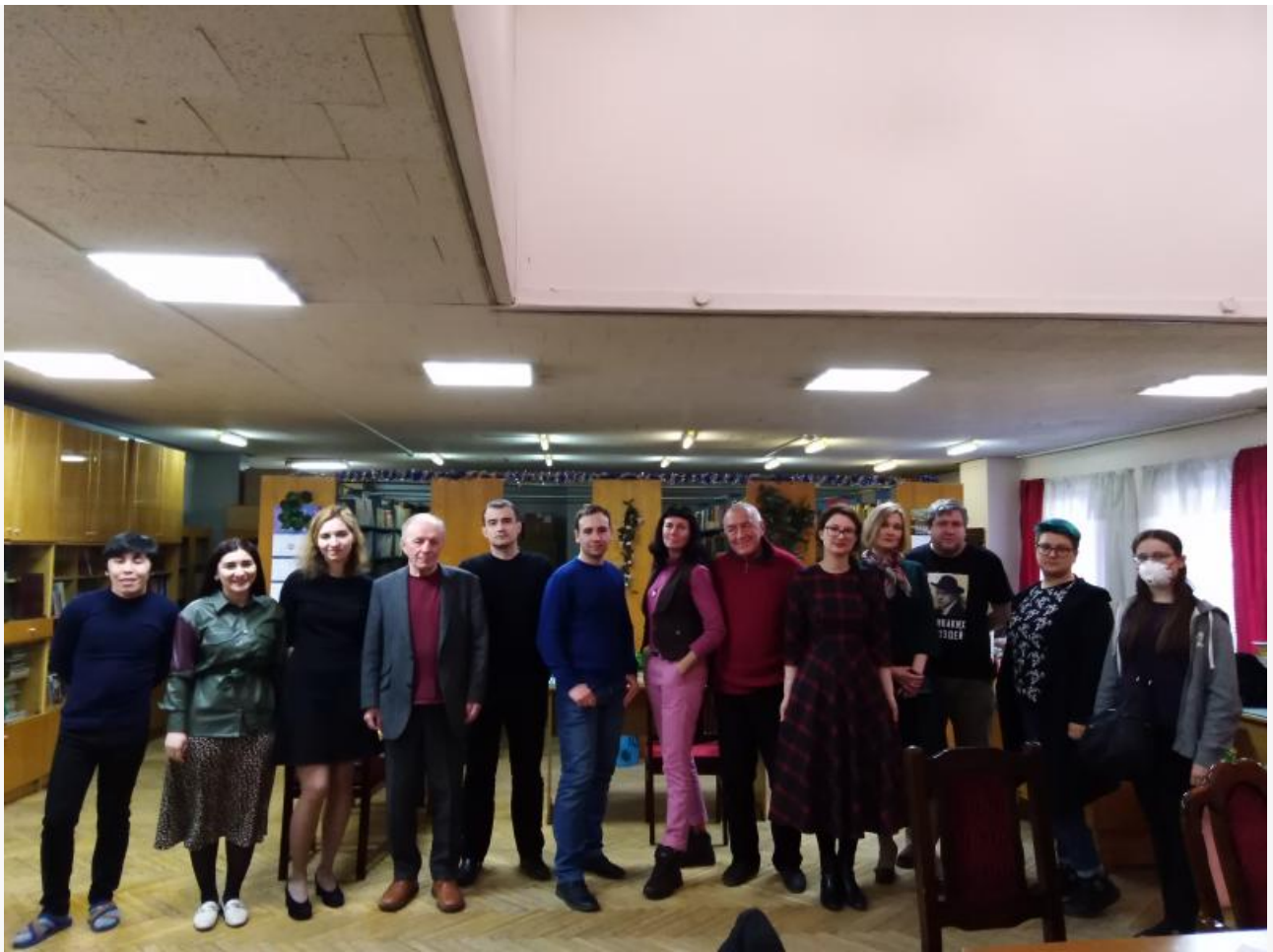
XX Форум молодых писателей, семинар журнала «Звезда» (Звенигород)