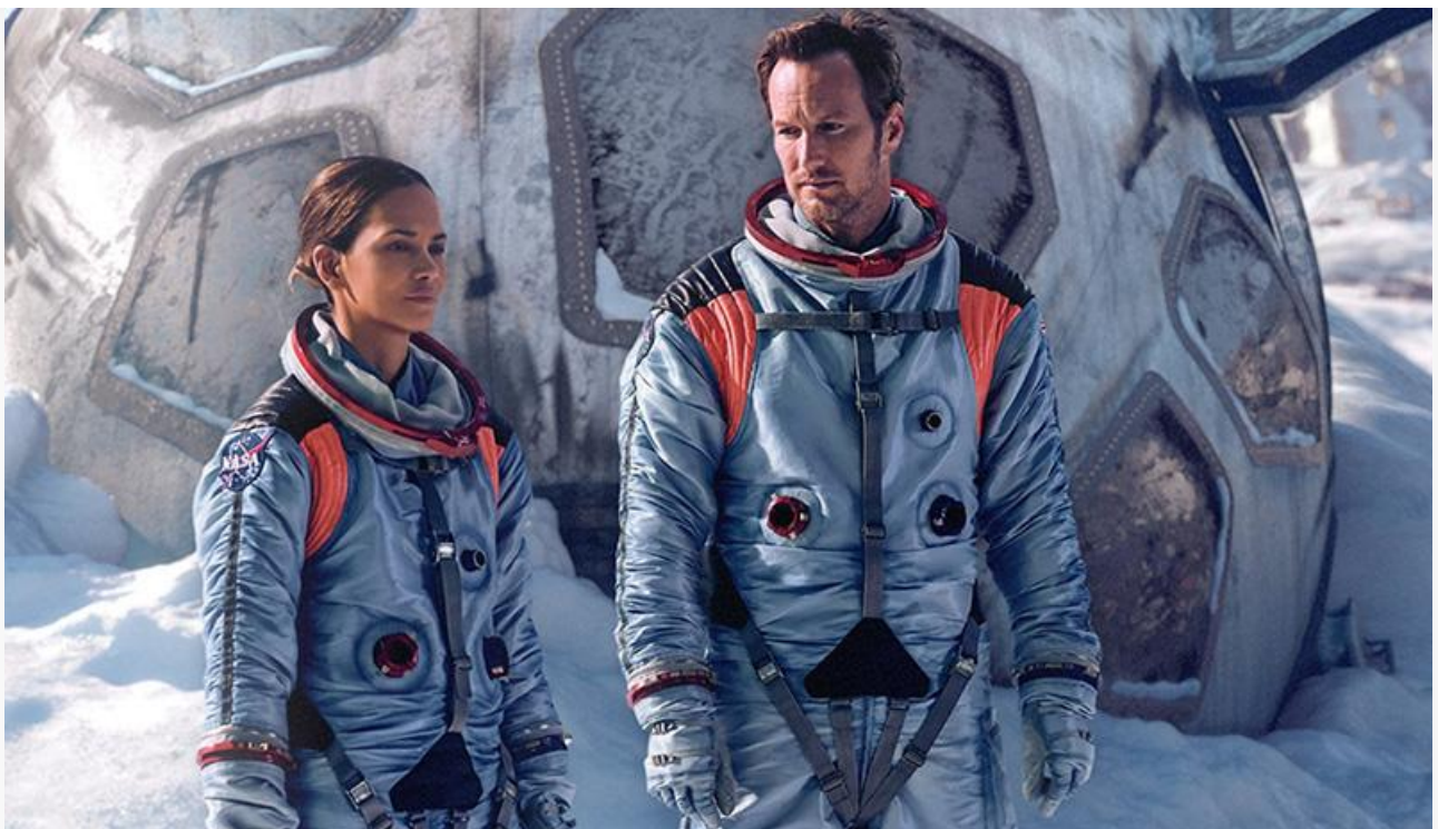
Кадр из фильма «Падение Луны»