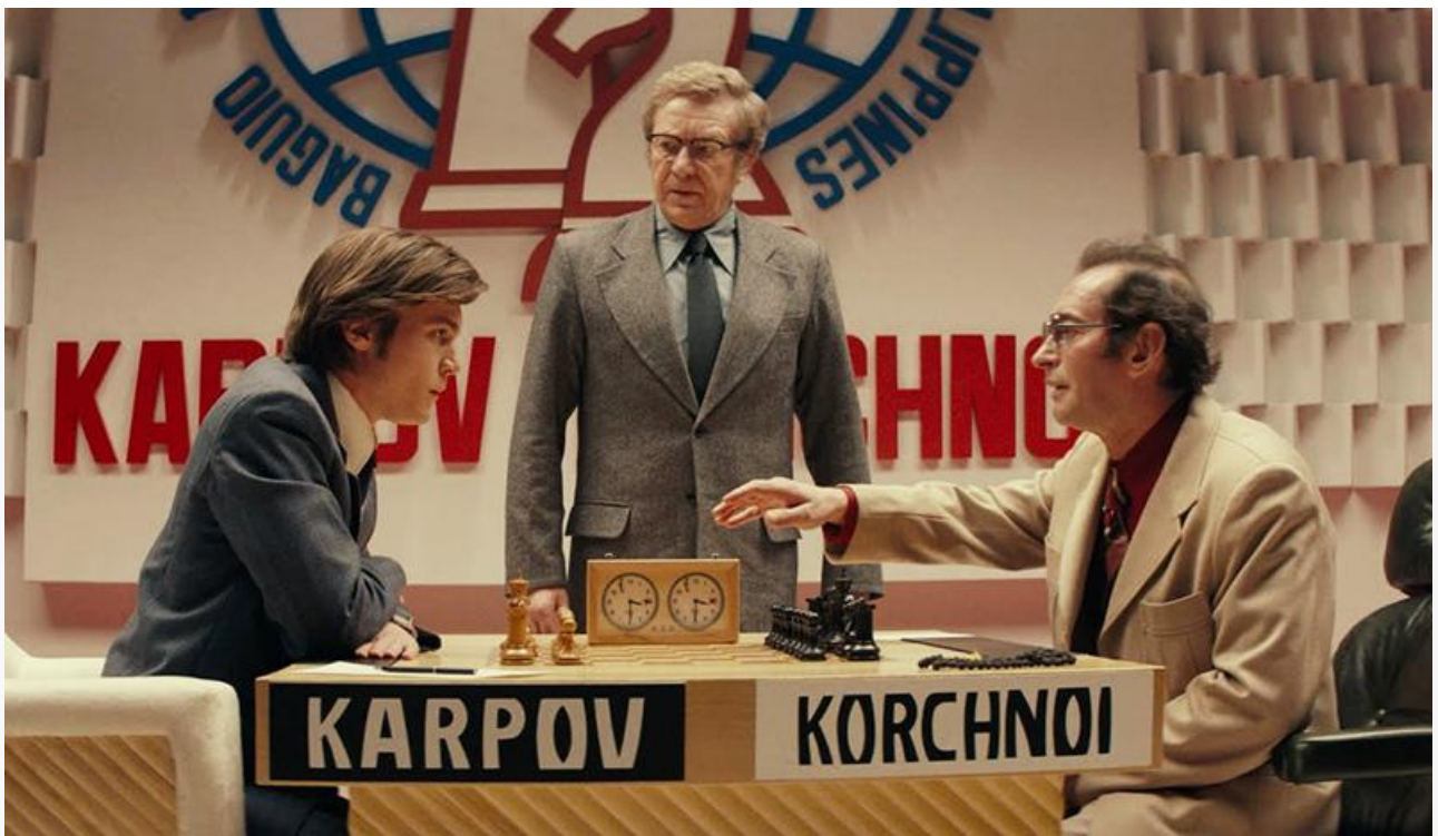
Кадр из фильма «Чемпион мира»