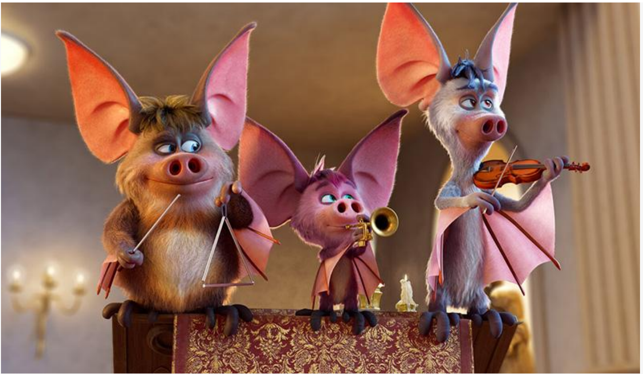
Кадр из фильма «Мы – монстры 2»

На фоне провального старта новинок первая шестёрка рейтинга проката практически не изменилась, лишь поменялись местами фильмы, неделю назад занявшие 1 и 2, а также 5 и 6 места.