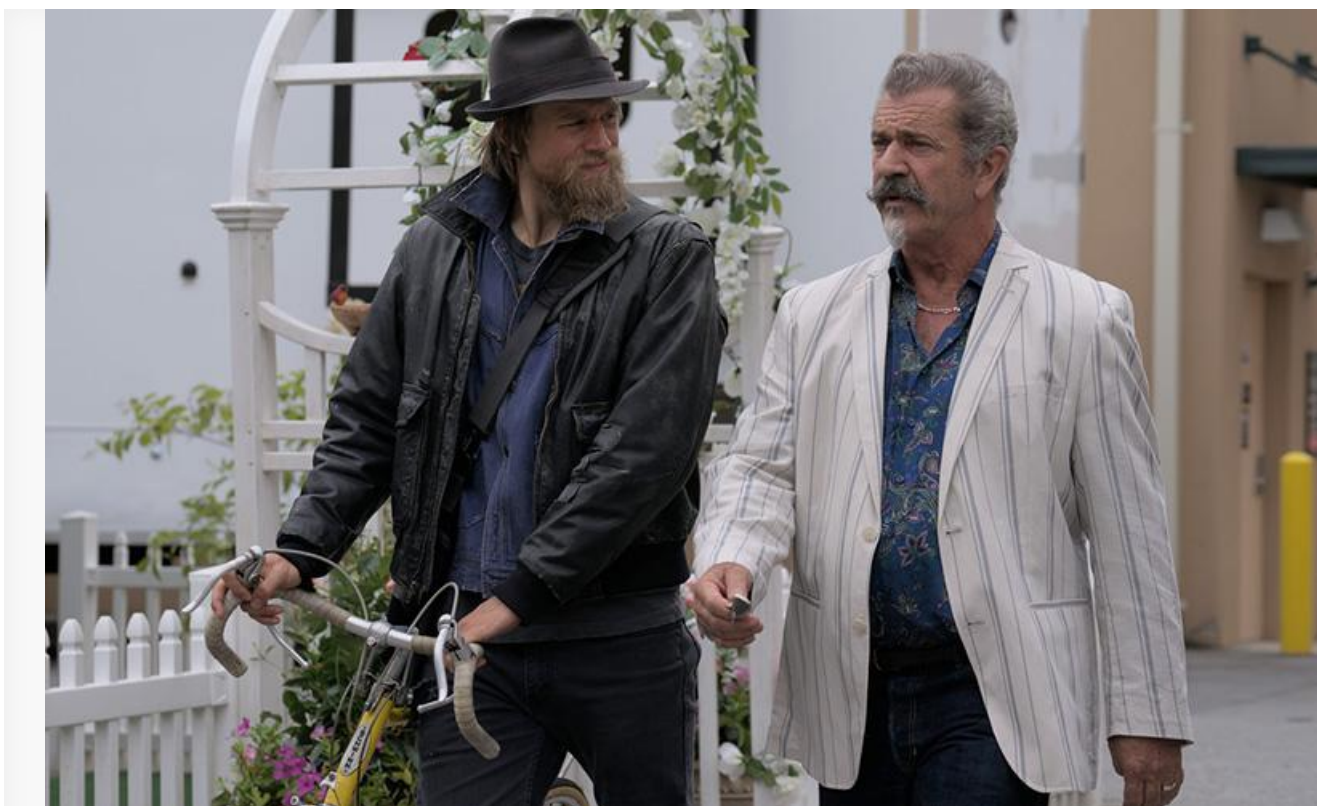
Кадр из фильма «Вальдо»

Чуть успешней стартовал германо-британский мультфильм Хольгера Таппе « Мы – монстры 2 », с 24,7 миллиона рублей, собранных на 1 719 экранах, расположившийся на седьмой строчке по итогам уикенда. Ну и совсем не задался прокат у отечественной военной драмы Веры Сторожевой « Мария. Спасти Москву » с Марией Луговой, Артуром Смольяниновым и Сергеем Пускепалисом в главных ролях: два миллиона прибыли и 19 место.