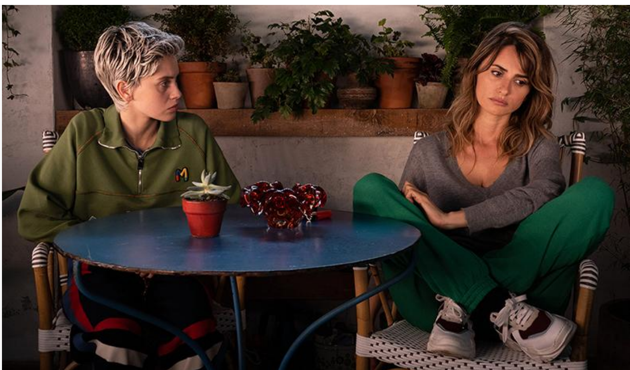
Кадр из фильма «Параллельные матери»

Впервые спустя 65 лет после мировой премьеры на большой российский экран выходит культовый фильм Ингмара Бергмана «Седьмая печать» , снятый мастером в 1957 году.