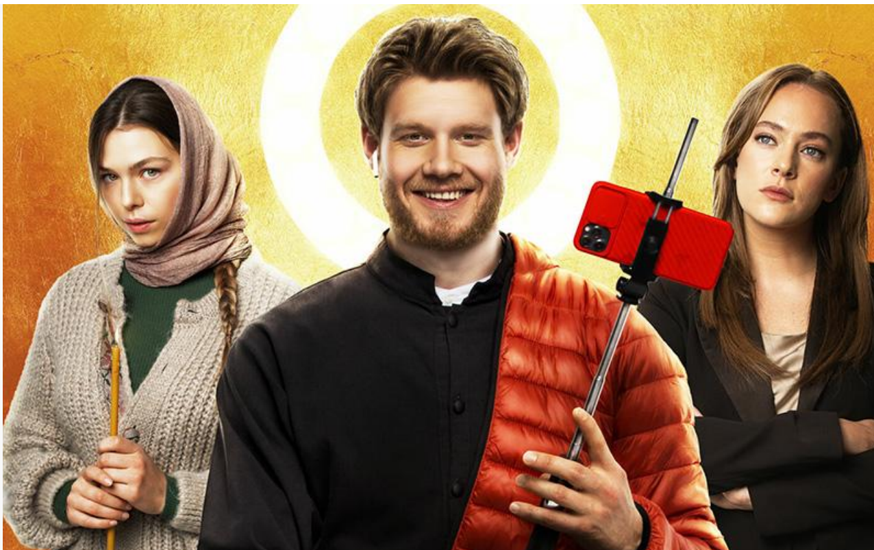
Постер к фильму «Непослушник»

Ценителей фестивального кино ждут премьеры испанской драмы Педро Альмодовара «Параллельные матери» (18+) от основной программы Венецианского кинофестиваля и хоррор Эскиля Вогта «Паранормальные» от программы «Особый взгляд» Каннского кинофестиваля.