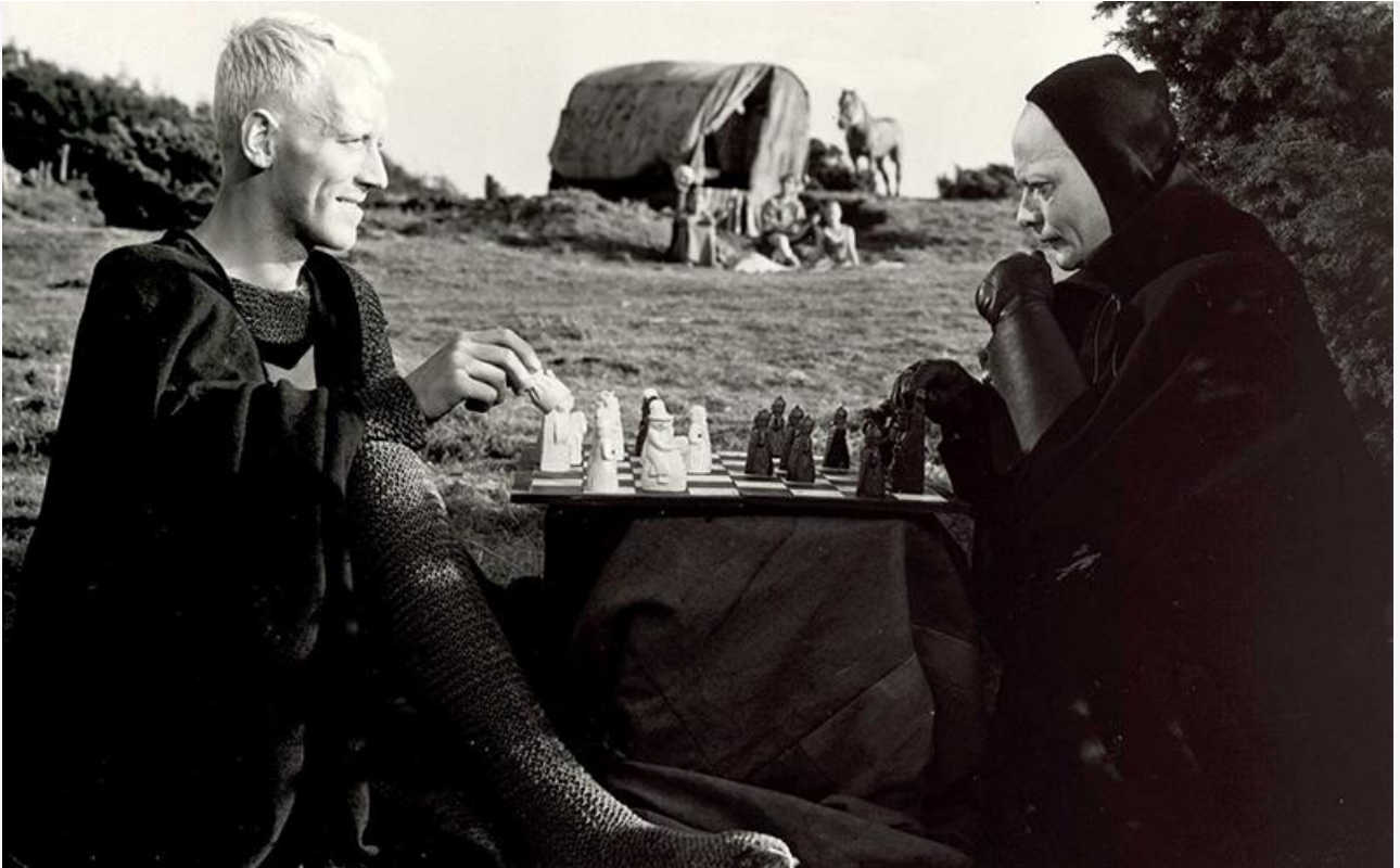
Кадр из фильма «Седьмая печать»