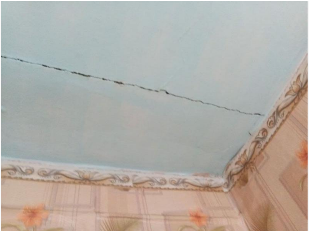
Последствия взрывных работ.

Сельчане всерьез обеспокоены тем, что при разрастании месторождения, карьер может стать еще ближе к населенному пункту, и тогда полного разрушения домов не избежать. Кроме того, шахту обвиняют в причинении экологического ущерба местной территории.