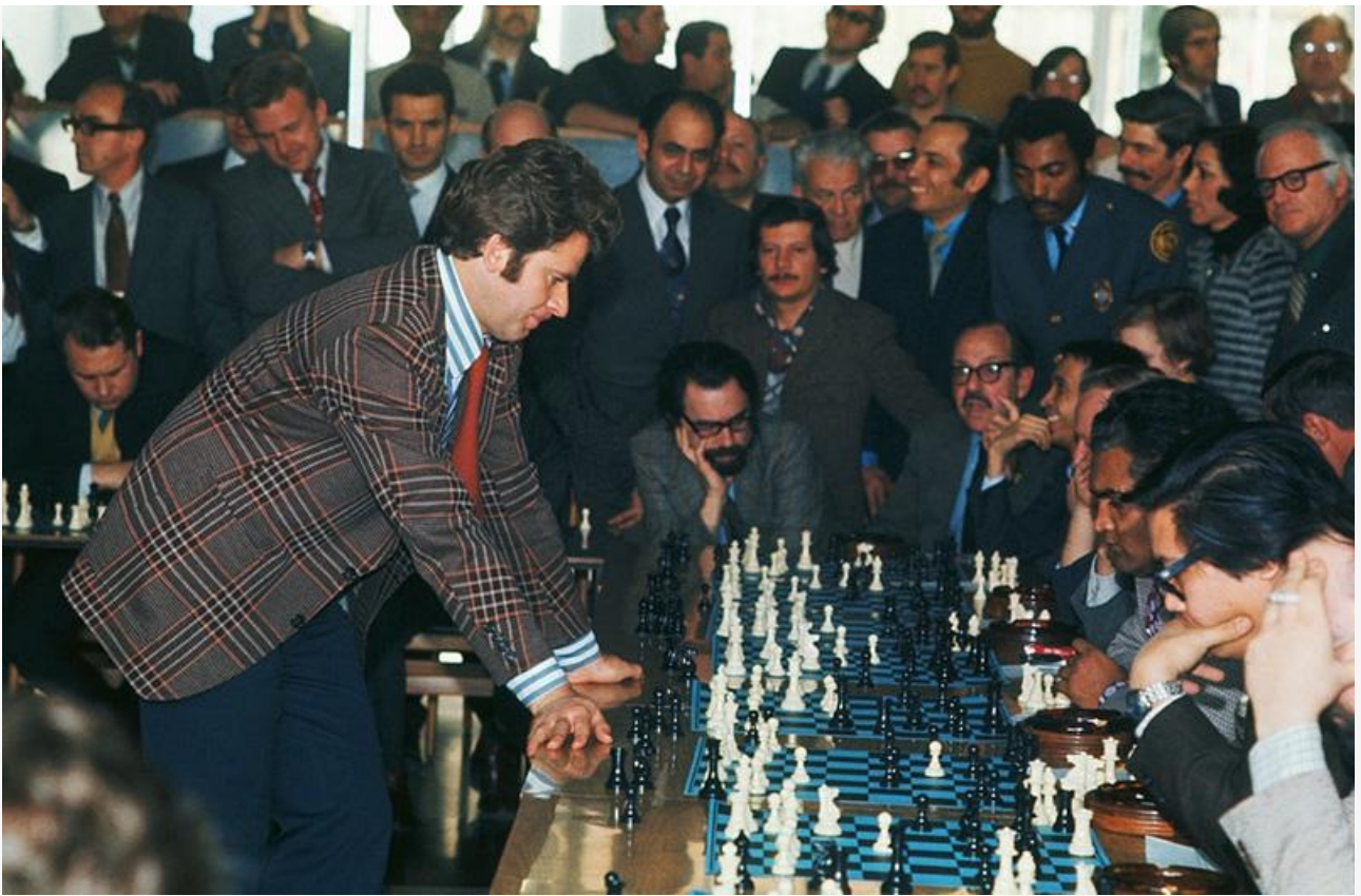
Борис Спасский даёт сеанс одновременной игры в Нью-Йорке, 1974 год

В последний раз в официальном международном турнире гроссмейстер Спасский участвовал в 2000 году в Париже. После завершения карьеры он вернулся в Россию, очень много внимания уделял популяризации и развитию шахматного движения, открыл собственную шахматную школу в городе Сатке Челябинской области, в течение двух лет был главным редактором газеты «Шахматная неделя».