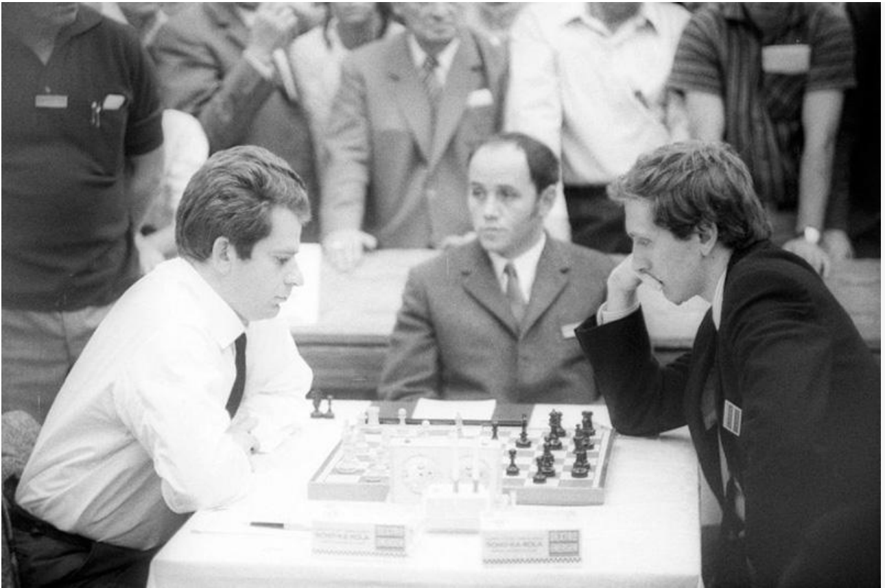
Борис Спасский против Бобби Фишера, 1972 год

Отношения с советской властью у Бориса Спасского складывались непросто, окончательно испортившись после поражения от Фишера в принципиальнейшем для советов и американцев матче. По словам самого гроссмейстера, он никогда не интересовался политикой и не выступал против СССР, а просто независимо и смело высказывался по «неудобным» вопросам, демонстративно отказывался подписывать письма с осуждением коллег, принципиально не вступал в партию, критиковал работу Спорткомитета и стремился к свободе в выборе турниров, в которых хотел участвовать.