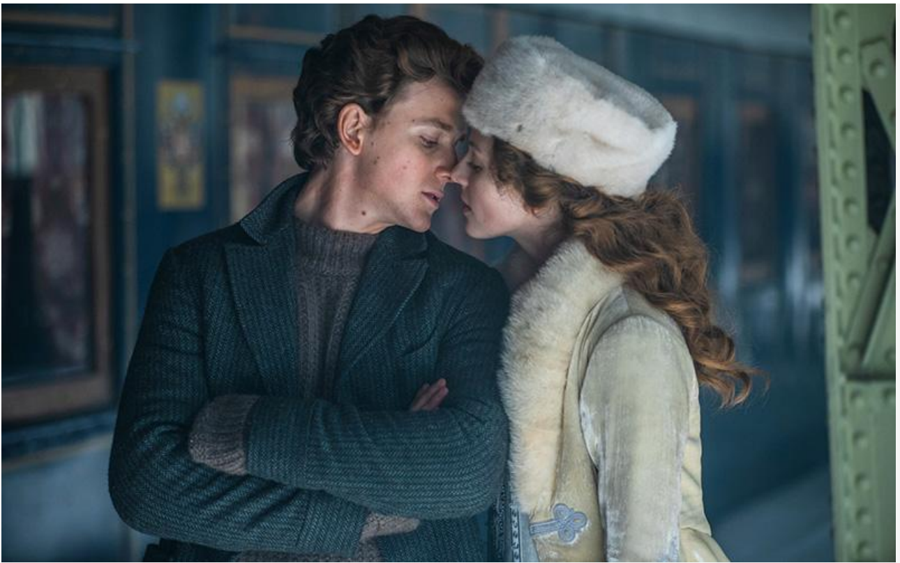
Кадр из фильма «Серебряные коньки»