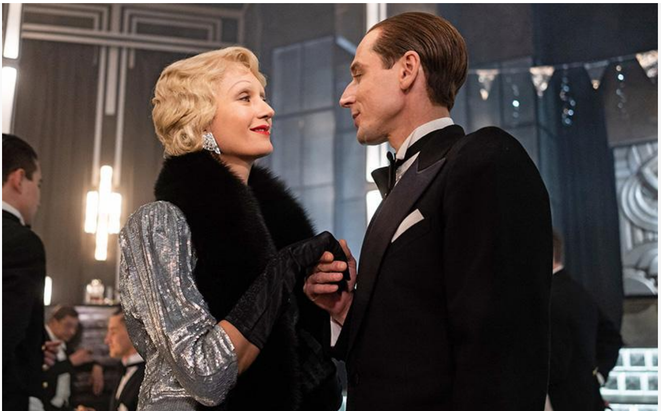
Кадр из фильма «Вертинский»

Впервые в истории премии награда вручалась в категории «Лучший сериал онлайн-платформ» , где статуэтка досталась музыкально-биографическому восьмисерийному фильму Авдотьи Смирновой «Вертинский» . Конкуренцию «Вертинскому» в новой номинации составили уже упомянутые «Пингины моей мамы» и «Вампиры средней полосы» Антона Маслова.