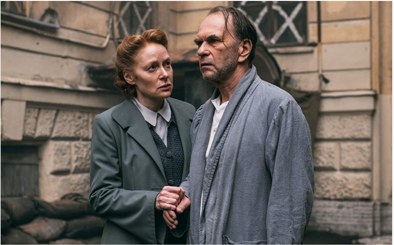
Алексей Гуськов в сериале «Седьмая симфония»