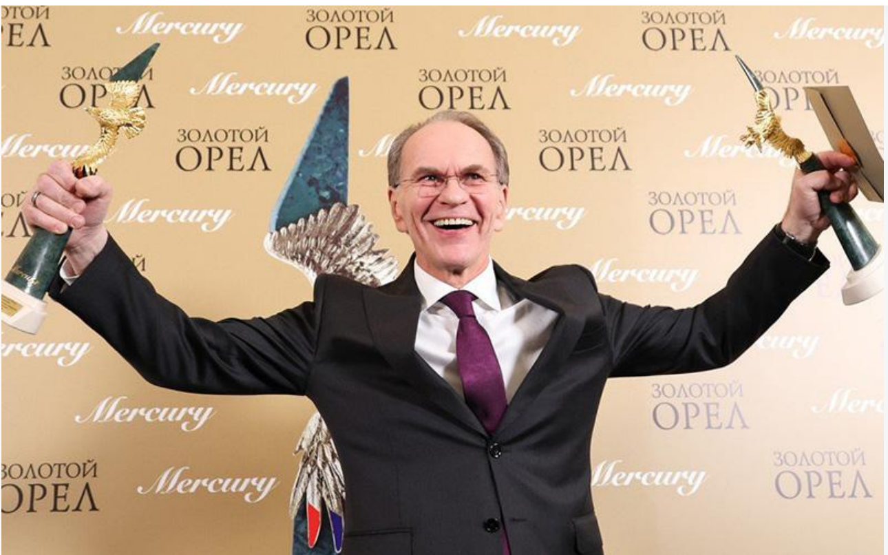
Алексей Гуськов с двумя «Орлами»