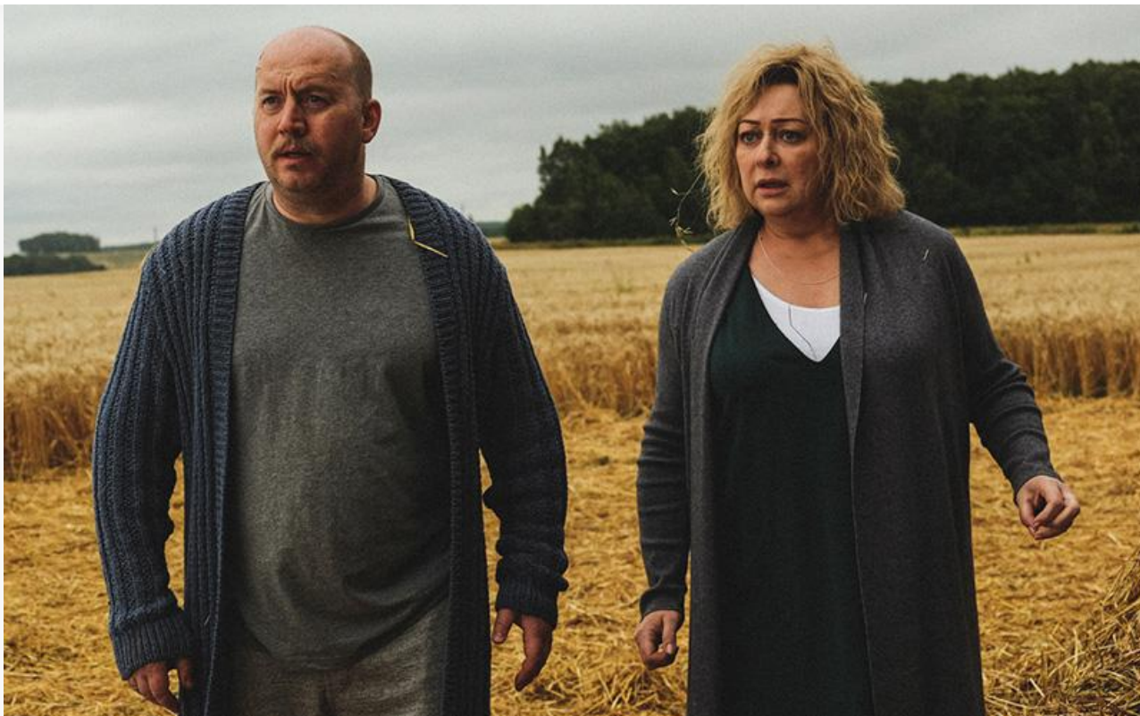
Мария Аронова в фильме «Пара из будущего»

Отметим, что Аронова – единственная из лауреатов, получившая премию второй раз подряд. В прошлом году актриса была удостоена «Золотого орла» в категории «Лучшая женская роль второго плана» за роль тренера Ирины Шаталиной в фильме Жоры Крыжовникова «Лёд 2».