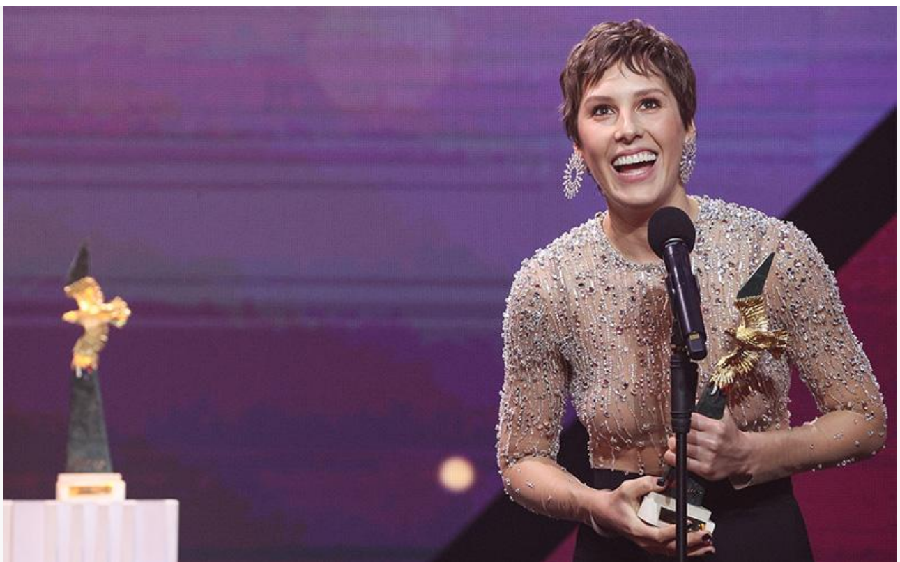
Ирина Горбачёва со второй в карьере премией «Золотой орёл»

На приз в категории « Лучшая женская роль » претендовали Мария Аронова (фильм «Пара из будущего»), Анна Михалкова (фильм «Дело») и Ирина Старшенбаум (фильм «Общага»). Большинство голосов