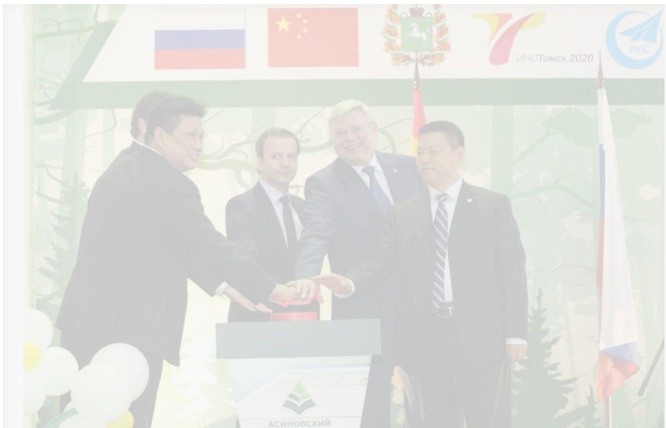
Сергей Жвачкин, Пэн Гоцин и вице-премьер Аркадий Дворкович на открытии завода по производству шпона, 2015 год

В феврале 2015 года был построен и введен в эксплуатацию завод по производству шпона (110 тыс. кубометров в год, инвестиции — 1 млрд рублей) и завод по выпуску обрезной доски мощностью в 150 тысяч кубометров. В планах на 2017 год был запуск завода по производству МДФ-плит стоимостью около 3,5 млрд рублей мощностью в 200 тысяч кубометров. В 2018 году «РусКитИнвест» планировал открыть второй завод по производству шпона, к 2020-му запустить производство ДСП, к 2021-му — ламината.