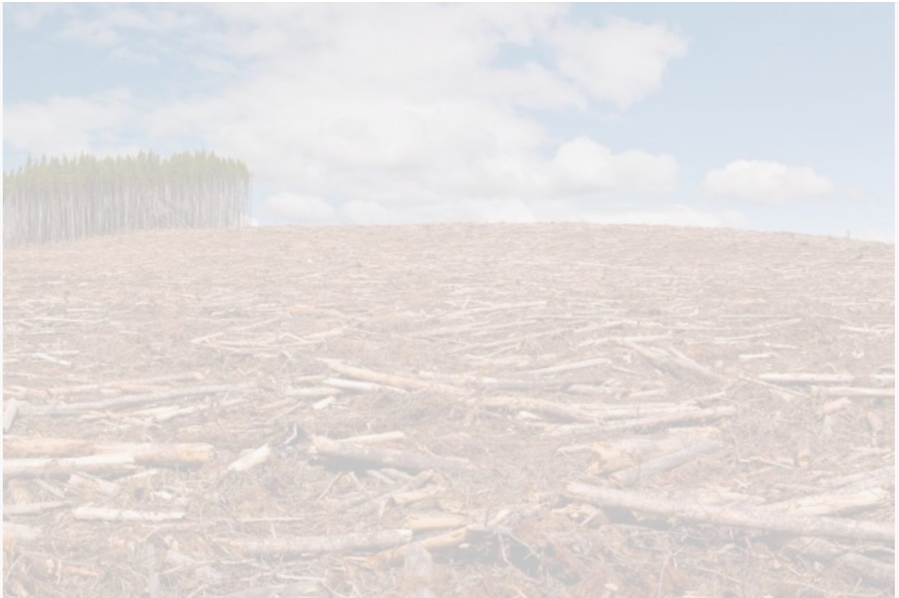
Степной Дозор (@StepDozor)