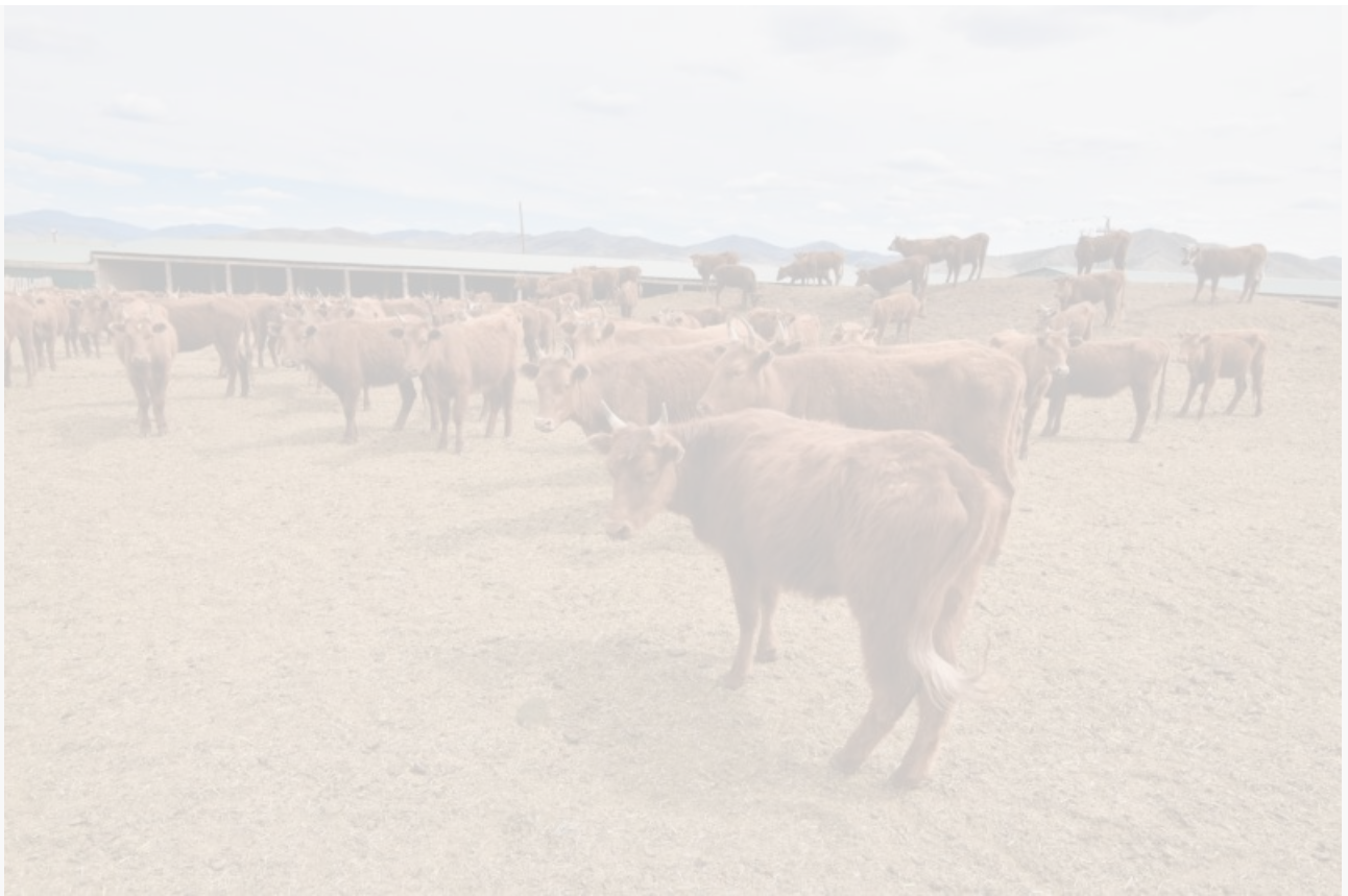
Горная Бурятия (@TUNKA_03)

Заразный узелковый дерматит (не опасен для человека) выявлен у скота в пяти районах Бурятии: Кяхтинском, Бичурском, Мухоршибирском, Тарбагатайском и Селенгинском.