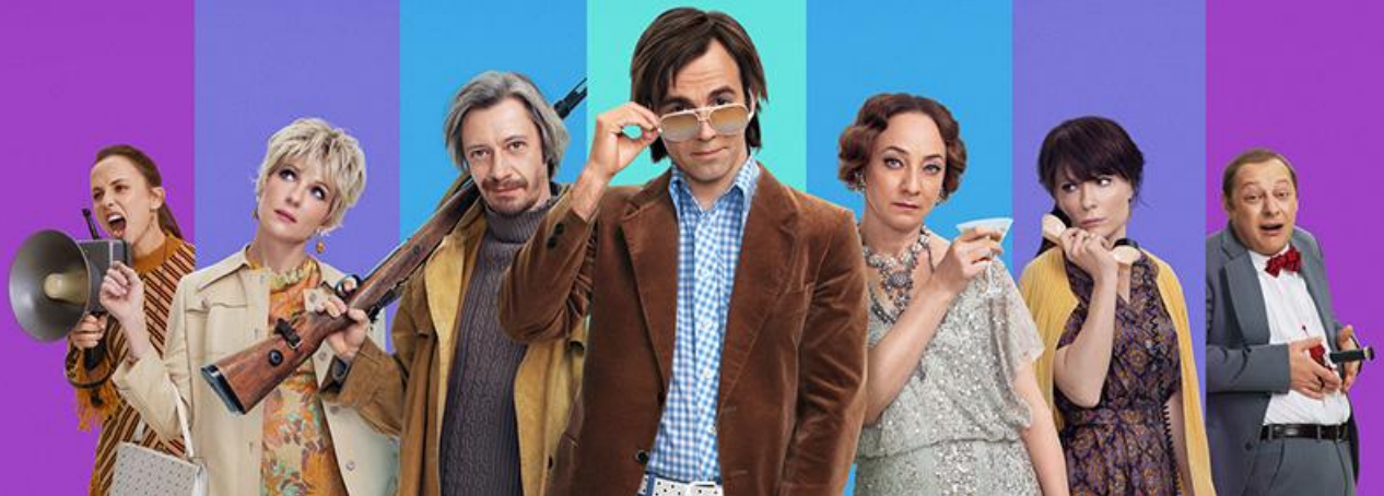
Постер к фильму «Портрет незнакомца»