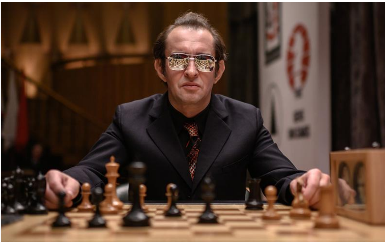
Кадр из фильма «Чемпион мира»