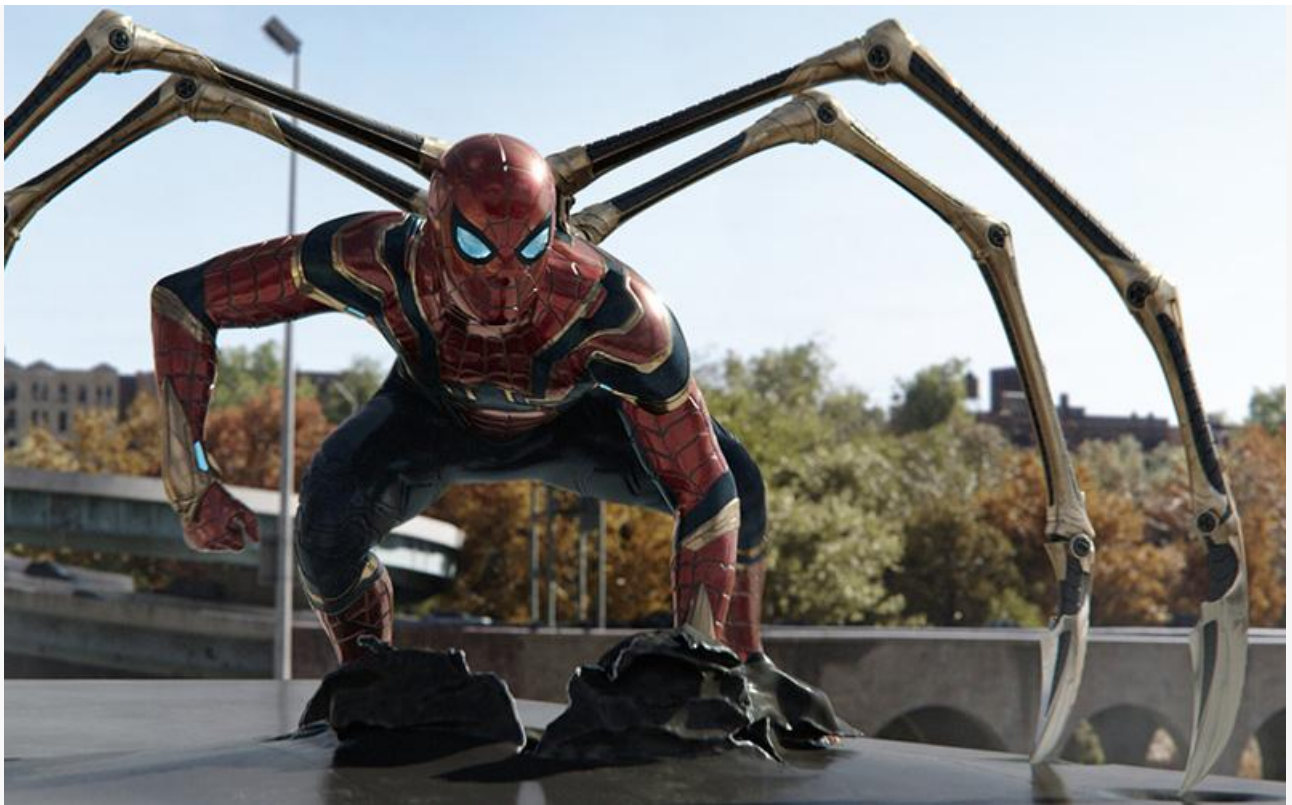
Кадр из фильма «Человек-паук: Нет пути домой»

Фэнтезийная комедия Дмитрия Дьяченко «Последний богатырь: Посланник Тьмы» стартовала с суммы 321,4 миллиона и довольствовалась вторым местом.