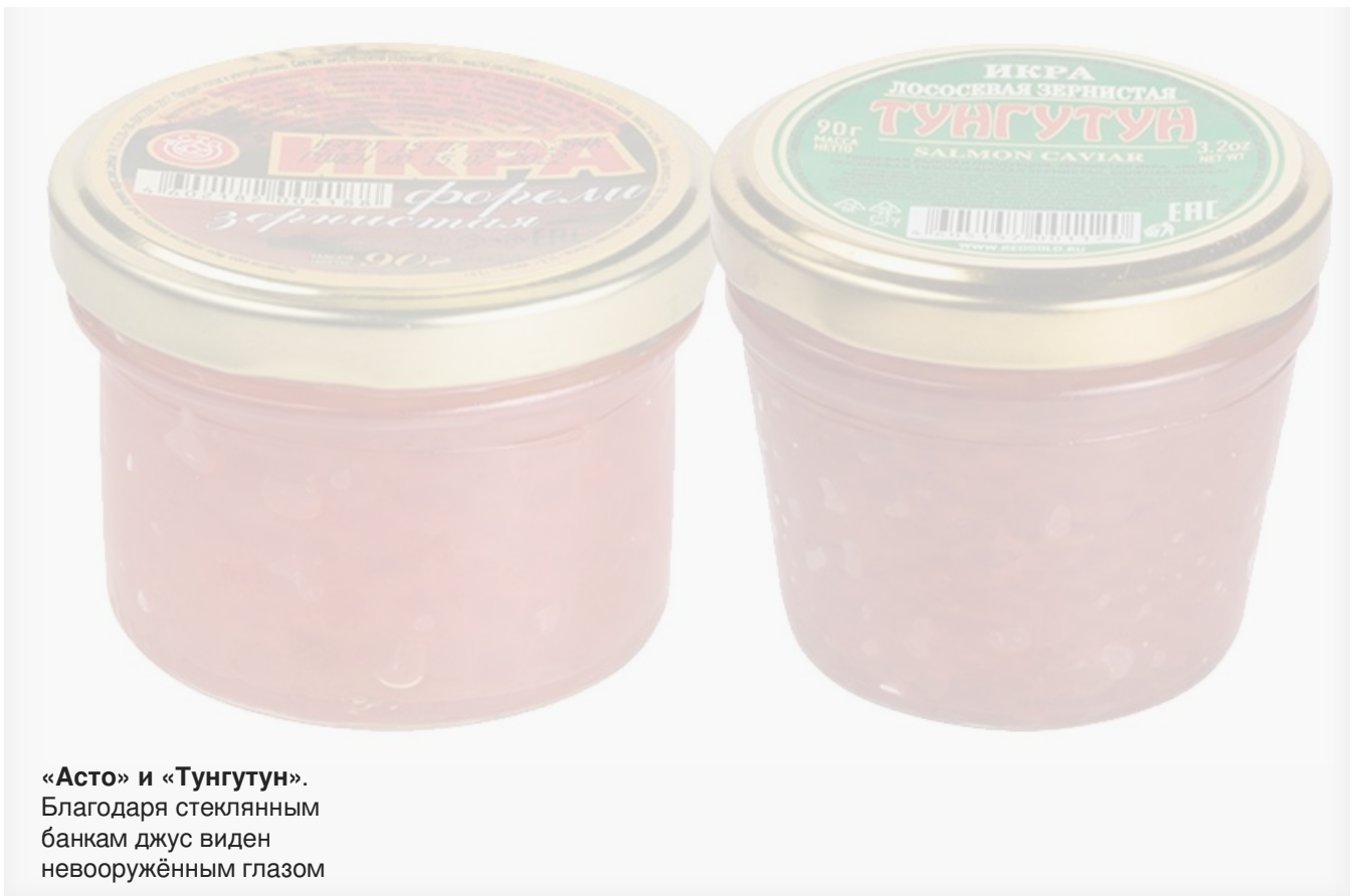
«Асто» и «Тунгутун». Благодаря стеклянным банкам джус виден невооружённым глазом

Без консервантов при производстве красной икры обойтись проблематично. Как правило, производители используют сорбиновую кислоту и бензоат натрия, превышения норм содержания которых выявлено не было. Однако в двух образцах эксперты обнаружили консервант уротропин (E239), запрещённый к использованию при производстве зернистой икры лососевых рыб ещё в 2008 году. Это икра торговых марок «Корсаков» и «Сонино-Чумикан» . Разумеется, в составе продукта запрещённый консервант не указан.