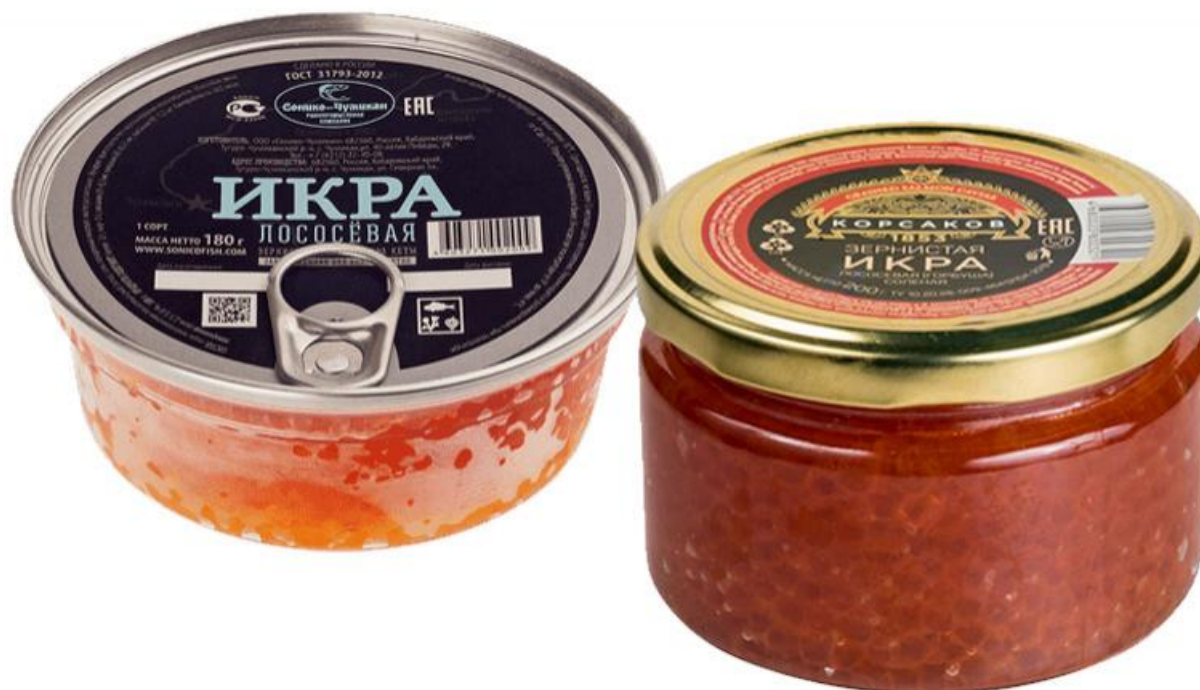
«Корсаков» и «Сонино-Чумикан». Икра с уротропином. Опасно для здоровья!

Зачастую покупатели переживают, что внутри банки окажется икра более дешёвого вида рыбы, нежели заявлено на этикетке. Например, икра горбуши вместо икры кеты или икра кеты вместо икры нерки. Как показала проверка, переживают напрасно. Кроме обнаруженной смеси настоящей икры с имитированной в образце производства Киржачского завода, видовых подмен выявлено не было.