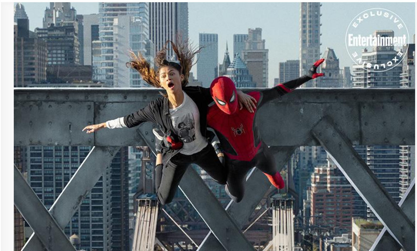
Кадр из фильма «Человек-паук: Нет пути домой»

О преимуществе нового комикса от Marvel над постапокалиптическим боевиком Village Roadshow Pictures и его более положительном «сарафане» красноречиво свидетельствуют рейтинги двух премьер на популярных видеосервисах: 8,5 на «КиноПоиске» и 9,0 на IMDb у «Человека-паука: Нет пути домой» и 6,0 на «КиноПоиске» и 6,1 на IMDb у «Матрицы: Воскрешения» .