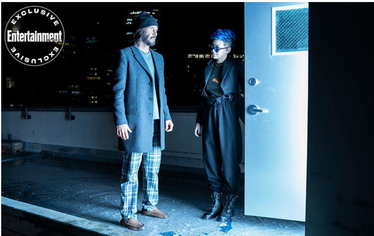
Кадр из фильма «Матрица: Воскрешение»

Лидер двух предыдущих уикендов – криминальная драма «Дом Gucci» – не смог бы на равных конкурировать с монстрами проката даже на стартовом уикенде. К концу же своих третьих выходных фильм Ридли Скотта, потеряв в сборах сразу 77 %, со скромными 39,8 миллиона рублей довольствовался третьим местом.