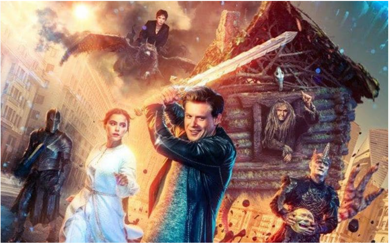
Постер к фильму «Последний богатырь: Посланник тьмы»

Наверняка заберёт какую-то часть общей выручки и уже упомянутый «Зверопой 2», которому аналитики прочат третье место по итогам уикенда.