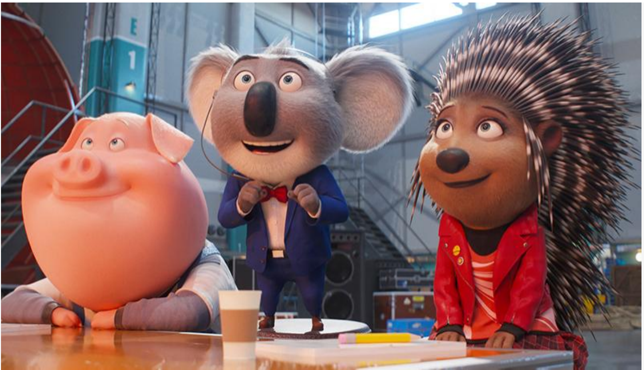
Кадр из фильма «Зверопой 2»

Сохранили места в десятке лидеров проката «Большой красный пёс Клиффорд» (29,1 миллиона и пятое место), «Энканто» (20,2 миллиона и шестое место), «Охотники за привидениями: Наследники» (7,6 миллиона и восьмое место) и «Вестсайдская история» (2,8 миллиона и десятое место).