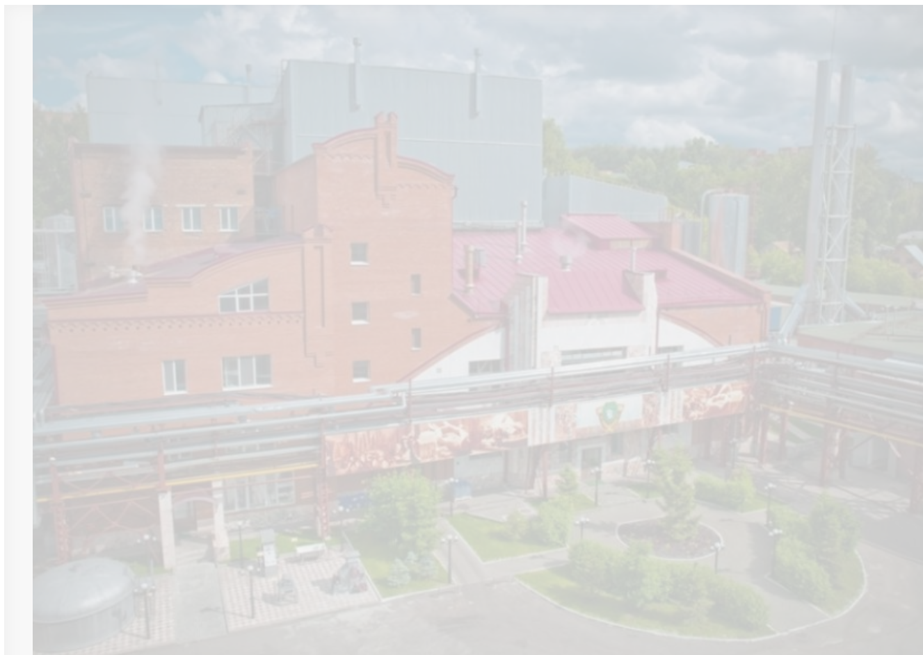
Завод ОАО «Томское пиво»