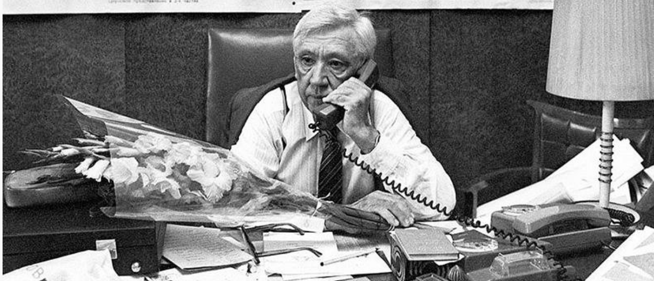
Директор и художественный руководитель Московского цирка на Цветном бульваре в рабочем кабинете