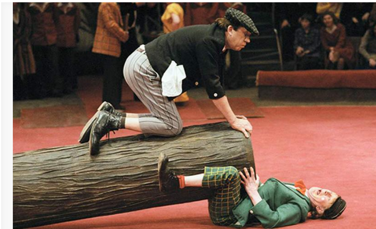
Юрий Никулин и Михаил Шуйдин в знаменитой репризе «Киносъёмка»

В 1983 году Михаила Шуйдина не стало, а Юрий Никулин был назначен директором и художественным руководителем Цирка на Цветном бульваре. До этого он два года проработал в должности главного режиссёра.