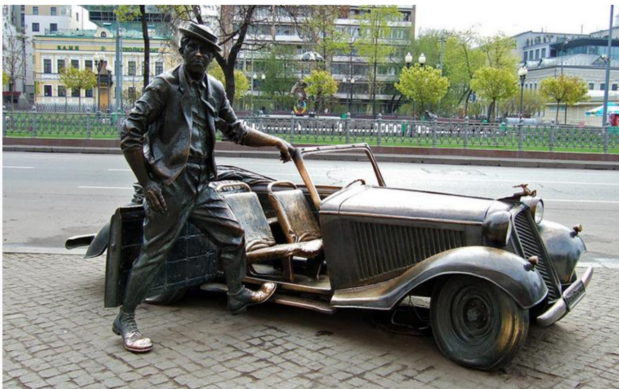
Памятник Юрию Никулину возле Цирка на Цветном бульваре

Сегодня Московский цирк на Цветном бульваре носит имя Юрия Никулина. Напротив центрального входа в новое здание цирка установлен памятник легендарному клоуну и директору в образе Балбеса из фильма «Кавказская пленница» работы скульптора Александра Рукавишникова.