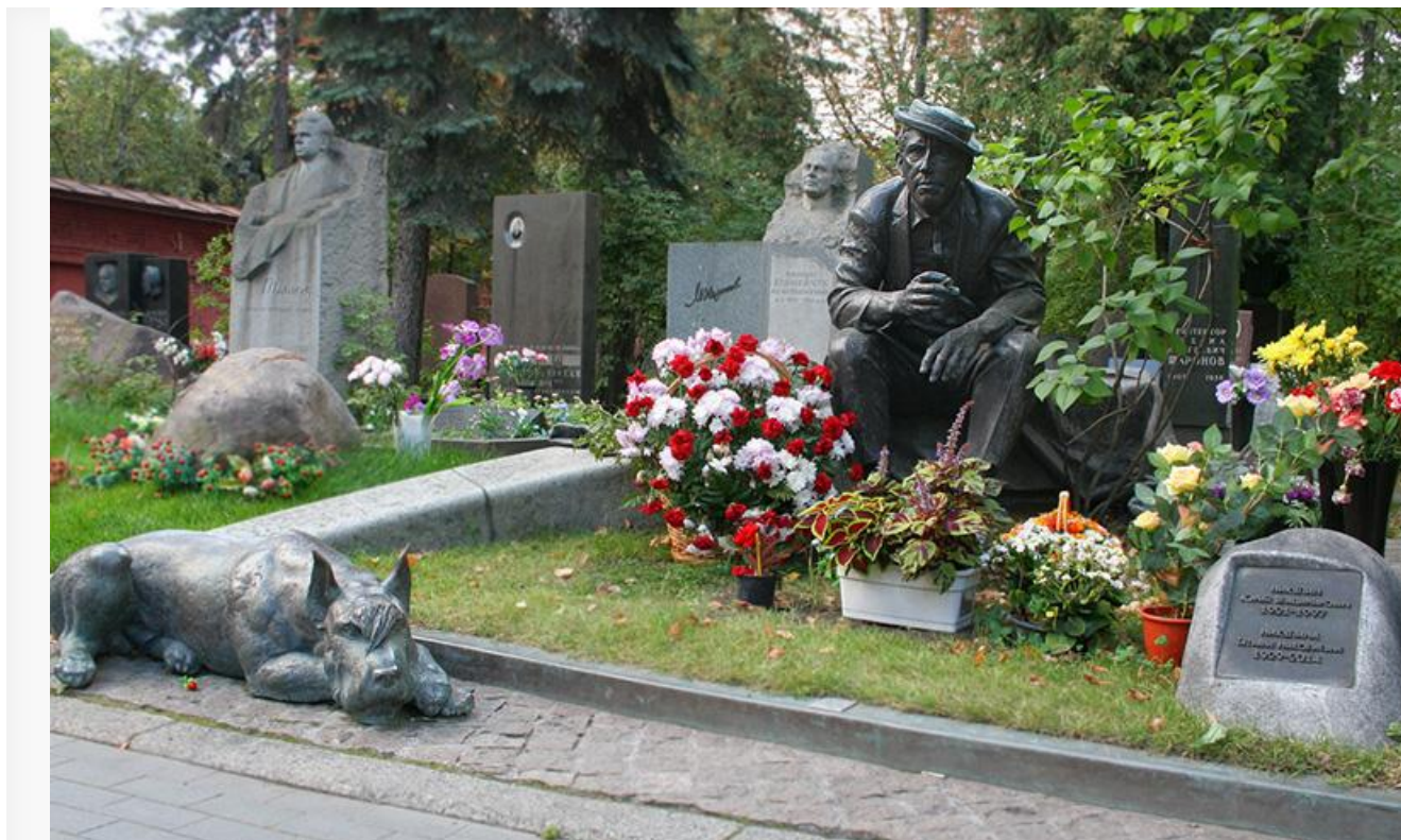
Могила Юрия Никулина

После церемонии прощания в Цирке на Цветном бульваре всенародно любимого народного артиста похоронили с военными почестями на Новодевичьем кладбище Москвы.