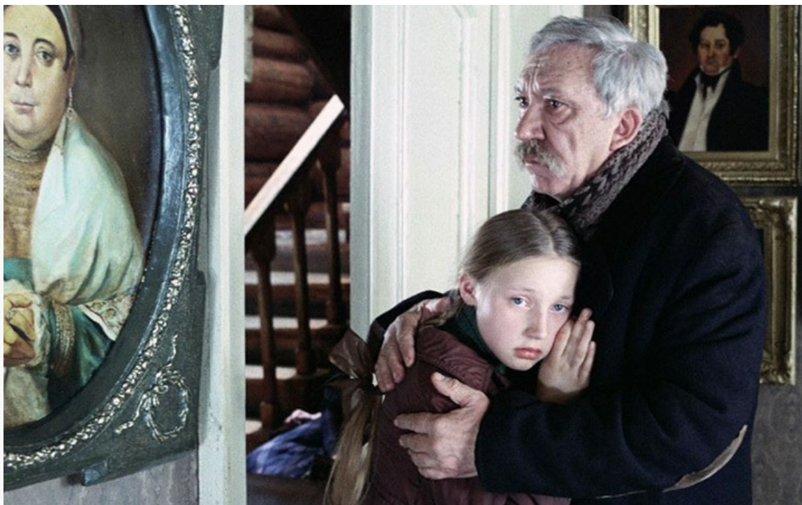
Николаевич в фильме «Чучело», 1983 год

Юрия Никулина не стало 21 августа 1997 года. Великий клоун и киноактёр скончался от осложнений после операции на сердце в возрасте 75 лет.