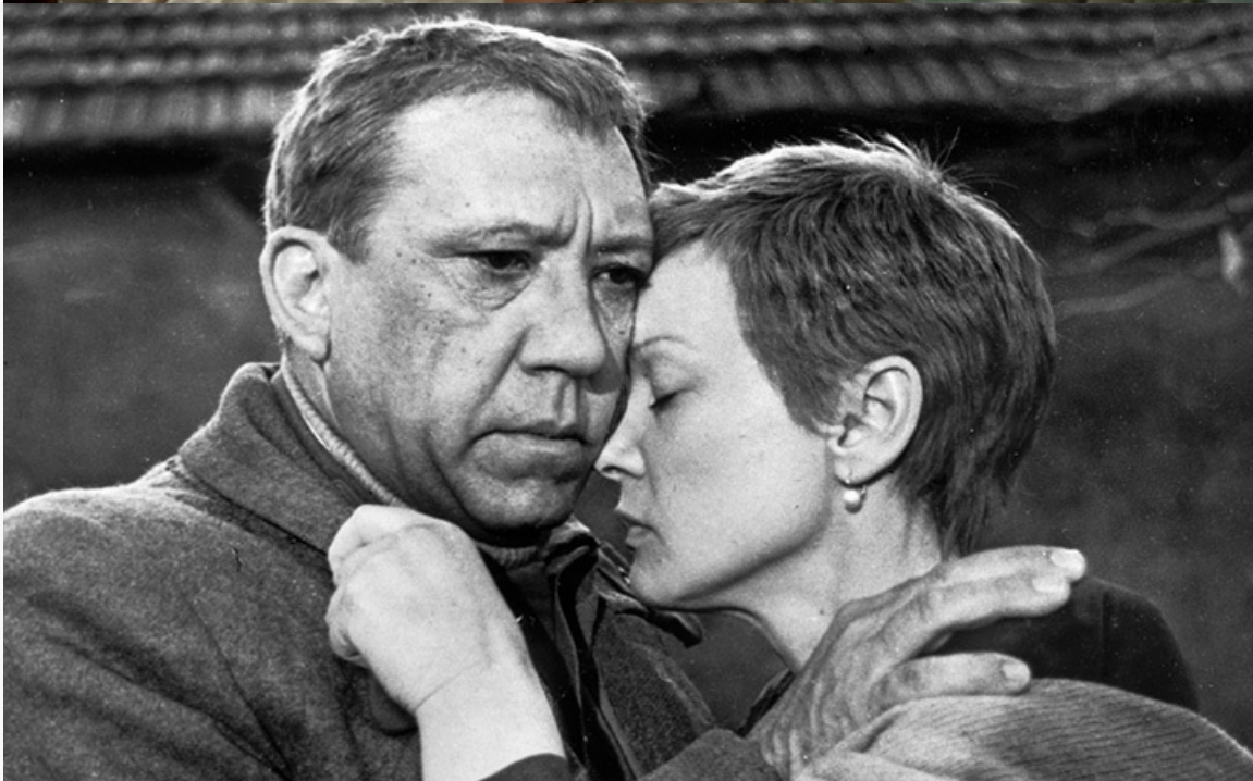
Николаевич Лопатин в фильме «Двадцать дней без войны», 1976 год