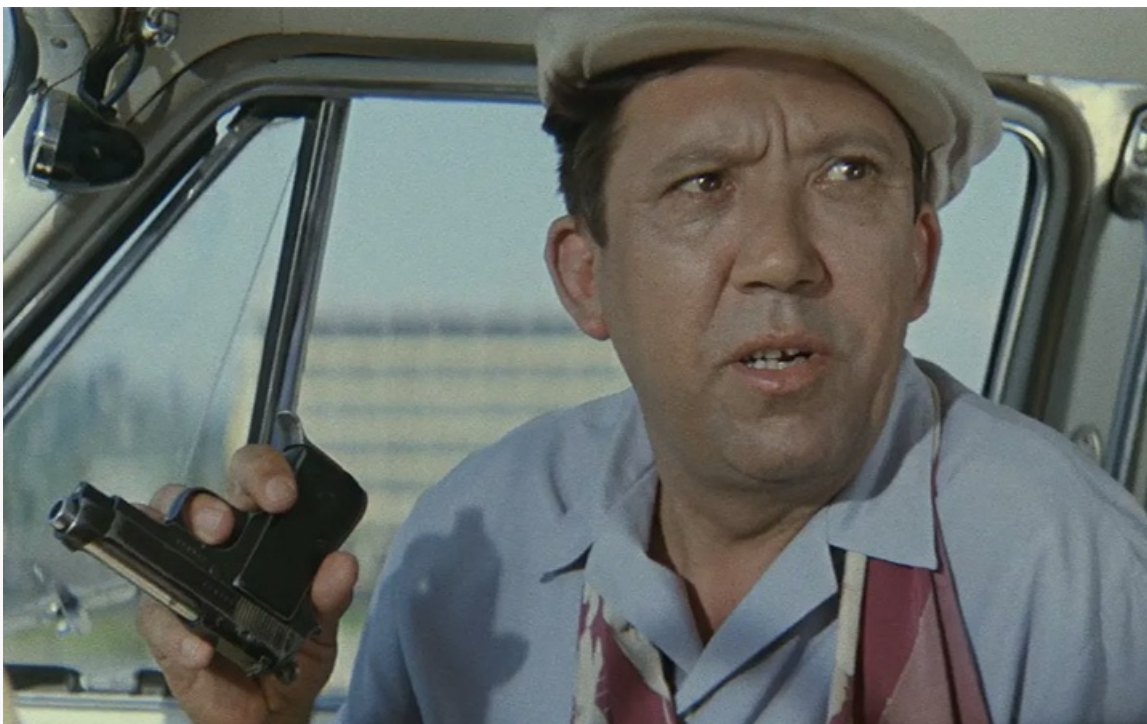
Семёнович Горбунков в фильме «Бриллиантовая рука», 1968 год

Николай Сергеевич Мячиков в фильме «Старики-разбойники», 1971 год