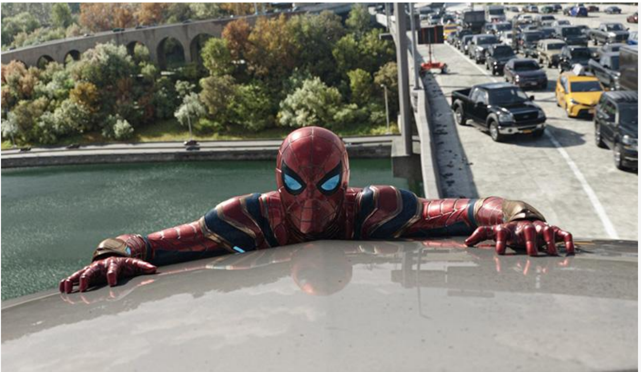
Кадр из фильма «Человек-паук: Нет пути домой»