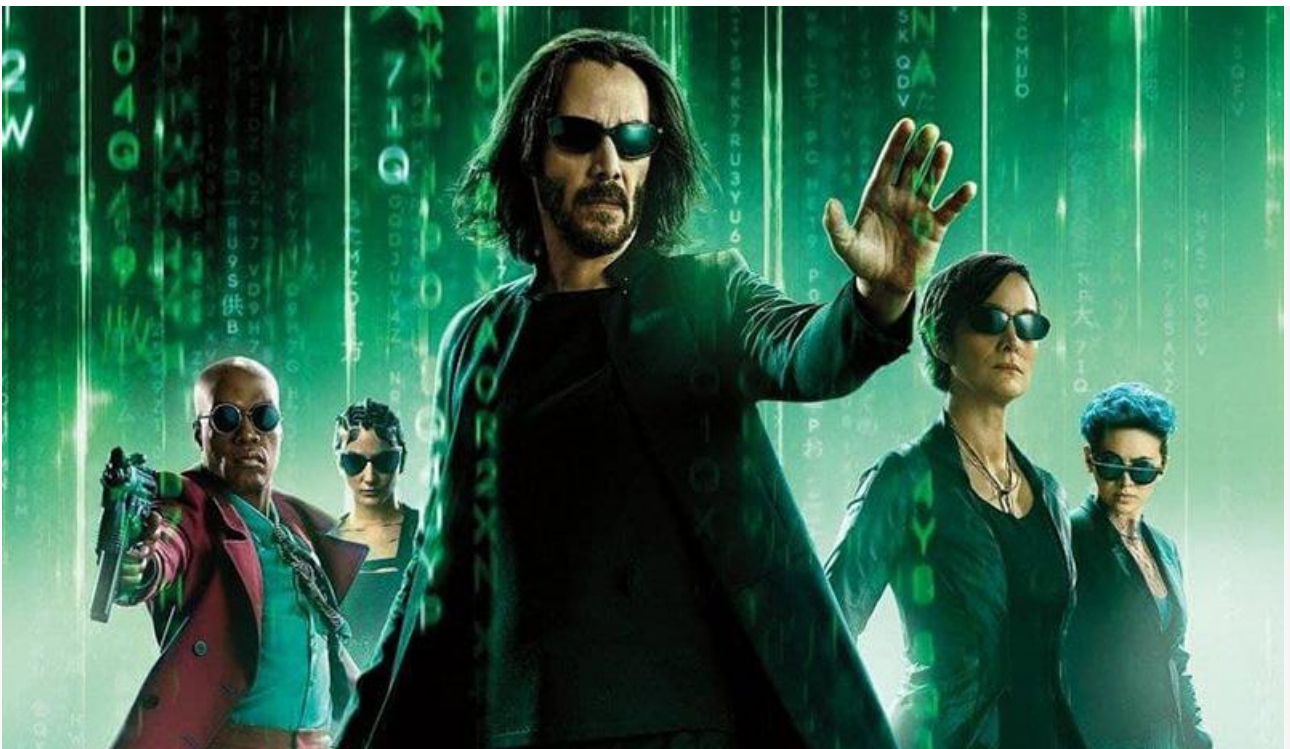
Постер к фильму «Матрица: Воскрешение»

Ещё одна премьера уикенда, у которой наверняка найдутся свои поклонники, – отечественная комедия «Ёлки 8».