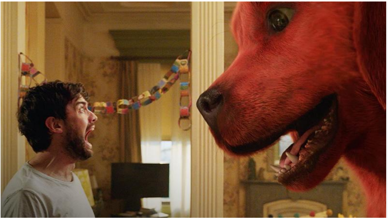
Кадр из фильма «Большой красный пёс Клиффорд»

Ещё две премьеры уикенда не оправдали возложенных на них надежд прокатчиков. Ни новая версия легендарного мюзикла « Вестсайдская история » от Стивена Спилберга, ни биографическая драма Пабло Ларраина « Спенсер » с Кристен Стюарт в роли принцессы Дианы не смогли конкурировать с лидерами и, собрав в кассах кинотеатров соответственно 12,5 миллиона и 9,5 миллиона рублей, заняли 8 и 9 места.