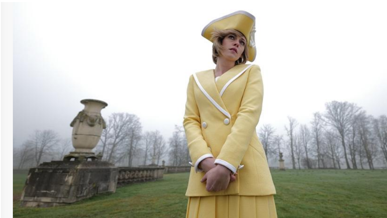
Кадр из фильма «Спенсер»

Также в десятке лидеров проката по итогам уикенда 9-12 декабря перевыпуск «Матрицы» 1999 года, запущенный для освежения памяти перед премьерой «Матрицы: Воскрешения» (16,59 миллиона и 5 место), отечественные фильмы «БУМЕРанг» (16,56 миллиона и 6 место) и «Лётчик» (14,1 миллиона и 7 место), а также хоррор «Обитель зла: Ракун-сити» (9,3 миллиона и 10 место).