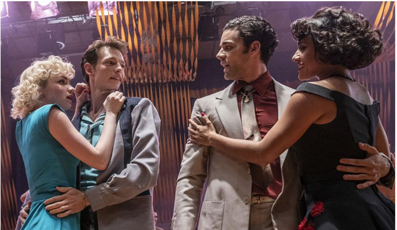
Кадр из фильма «Вестсайдская история»

Ещё две премьеры уикенда не оправдали возложенных на них надежд прокатчиков. Ни новая версия легендарного мюзикла « Вестсайдская история » от Стивена Спилберга, ни биографическая драма Пабло Ларраина « Спенсер » с Кристен Стюарт в роли принцессы Дианы не смогли конкурировать с лидерами и, собрав в кассах кинотеатров соответственно 12,5 миллиона и 9,5 миллиона рублей, заняли 8 и 9 места.