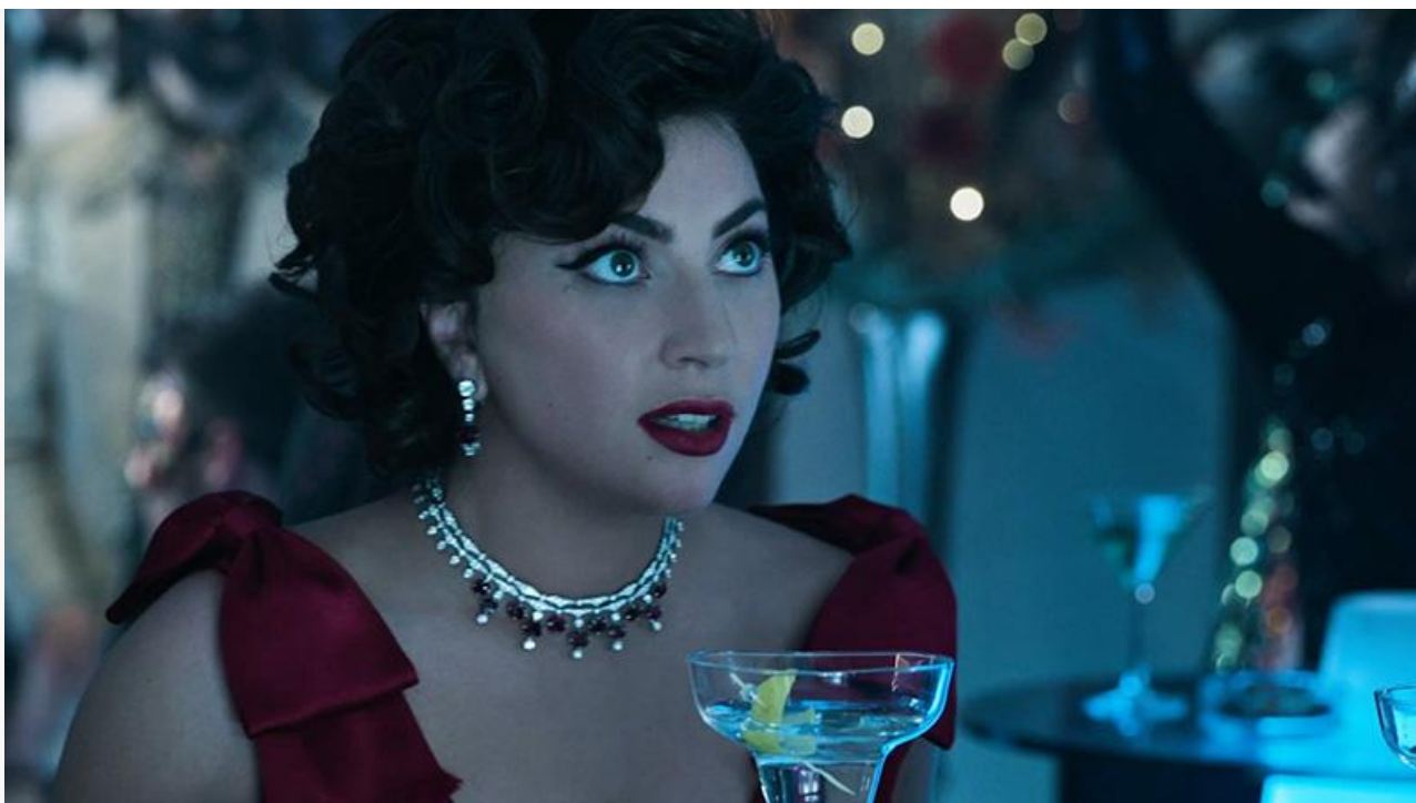
Кадр из фильма «Дом Гисси»

Следом за «Большим псом» с одинаковым результатом 61,7 миллиона рублей расположились «Энканто» и «Охотники за привидениями: Наследники» .