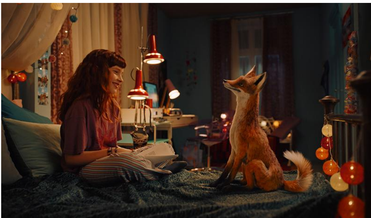
Кадр из фильма «Школа магических зверей»