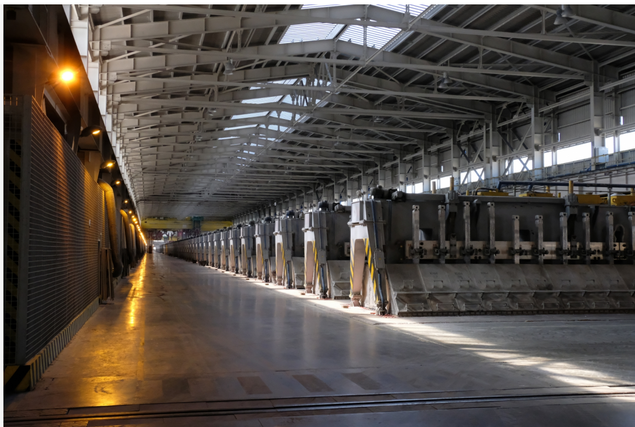
Автор: Алёна Штерн

Тайшетский алюминиевый завод — это настоящий завод будущего. Он станет моделью того, как будут выглядеть все новые заводы РУСАЛА. В планах компании — полная перестройка четырех еще советских заводов в Красноярске, Братске, Шелехове и Новокузнецке по самым современным и экологичным технологиям.