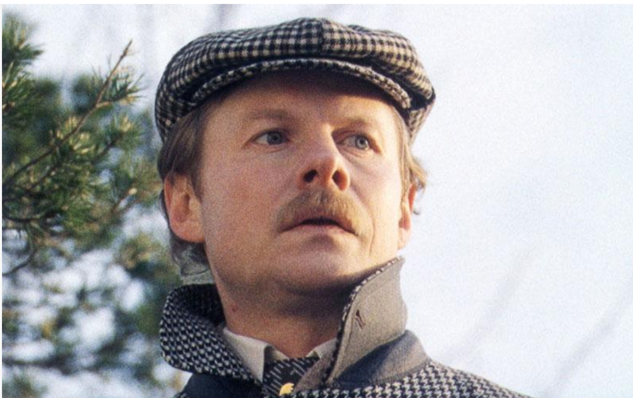
Виталий Соломин на съёмках фильма «Собака Баскервилей»

12 декабря исполняется 80 лет со дня рождения выдающегося русского актёра театра и кино, народного артиста РСФСР Виталия Соломина.