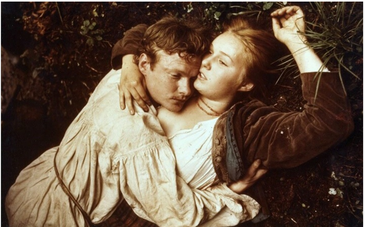
Устюжанин в фильме «Сибиряда», 1979 год

Тем не менее главной ролью в жизни актёра стал именно Ватсон, с которым по популярности может соперничать разве что Вадим из фильма того же Игоря Масленникова «Зимняя вишня» и двух его сиквелов.