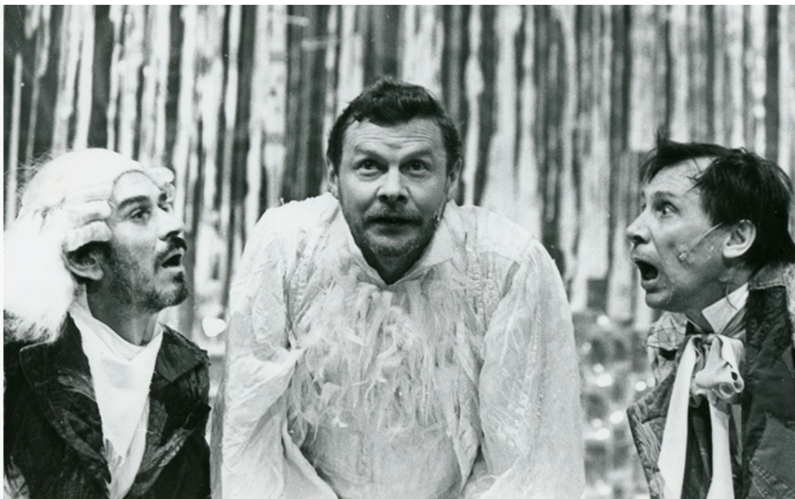
Кречинский в спектакле «Свадьба Кречинского». Малый театр, постановка 1997 года

Впервые на киноэкране Виталий Соломин появился в 1963 году в эпизодах фильмов Исидора Анненского «Первый троллейбус» и Теодора Вульфовича «Улица Ньютона, дом 1».