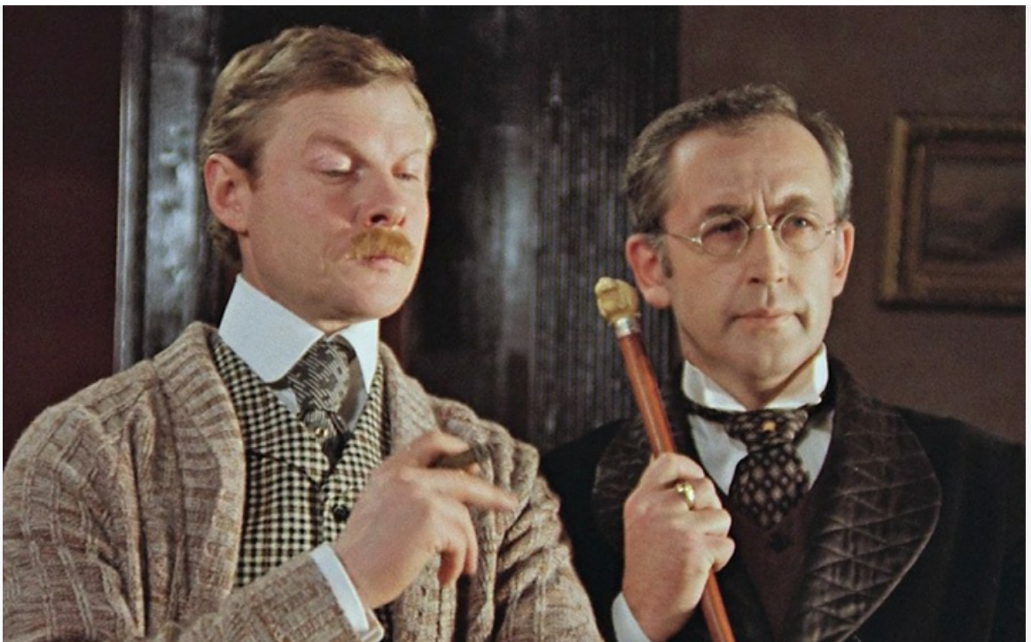
«Приключения Шерлока Холмса и доктора Ватсона», 1979-1986 годы