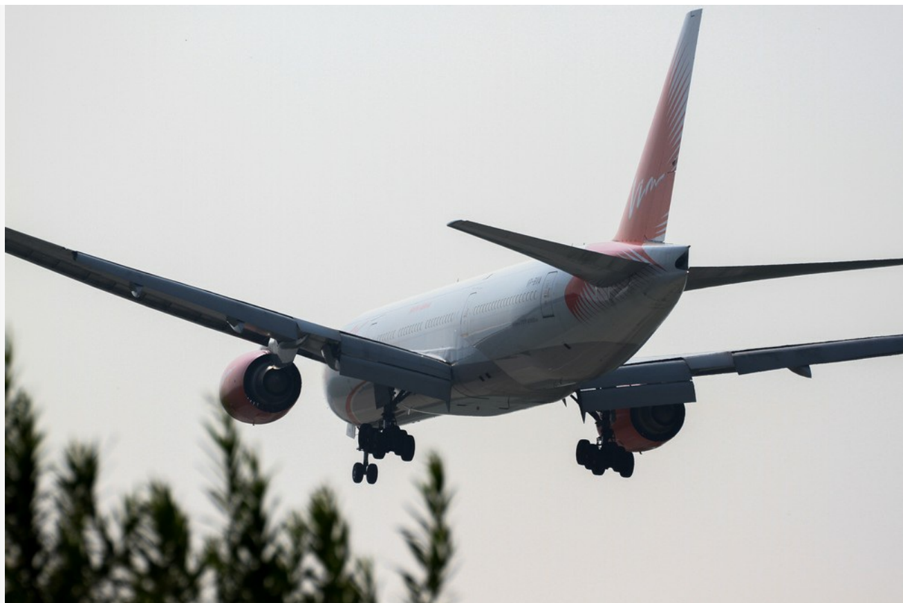
Автор: Кирилл Шипицин Фото из альбома "Самолеты" © Фотобанк "RuBabr"

Другие жители Бурятии сетуют, что у многих сейчас просто нет денег на отдых за границей в отличие от жителей Иркутской области. Многих не устраивают новые ограничительные правила въезда в Таиланд. Например, тайландские службы сильно медлят с проверкой сертификатов о вакцинации, и туристам приходится ждать её окончания минимум десять дней. Из российских вакцин в этой стране одобрили лишь "Спутник V". Вызывает сомнение у потенциальных туристов и необходимость сдавать сразу несколько ПЦР-тестов.