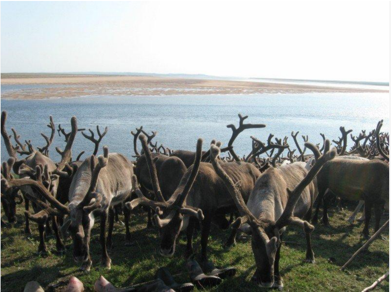
Таймырский биосферный заповедник

Предлагается объединить заповедник «Джугджурский» с заповедником «Заповедное Приамурье» (Хабаровский край); нацпарк «Удэгейская легенда» с заповедником «Сихотэ-Алинский» (Приморский край); нацпарк «Шушенский Бор» с заповедником «Саяно-Шушенский» (Красноярский край).