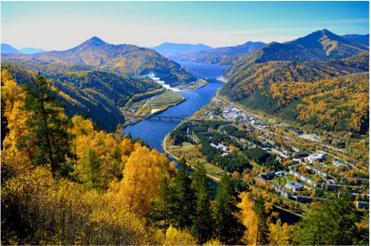
Национальный парк «Шушенский Бор»

Далее предлагается создать 8 объединенных дирекций из 25 заповедников и нацпарков. В Объединенную дирекцию «Заповедная Якутия» войдут нацпарк «Ленские столбы», заповедники «Олекминский» и «Усть-Ленский». Дирекция «Заповедное Забайкалье» объединит нацпарки «Алханай» и «Чикой», заповедники «Сохондинский» и «Даурский».