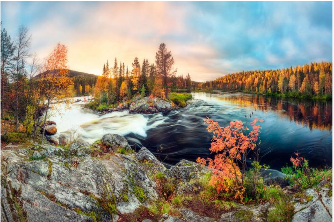
Национальный парк «Паанаярви»

Задумка с объединением заповедников сама по себе может и неплохая. Однако увеличивать зарплату одним сотрудникам через сокращение численности других – идея неудачная. И вот почему.