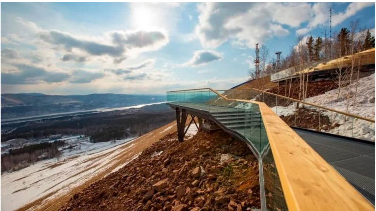
Смотровая площадка на Николаевской сопке

Осталась в памяти у красноярцев история открытия смотровой площадки на Николаевской сопке, которая стоила бюджету края 40 миллионов рублей. К собственно смотровой площадке прилегают пешеходные дорожки с подсветкой и экотропы, амфитеатр с навесом от дождя и местами для отдыха. Открывшийся весной 2021 года, туристический объект сразу же создал ажиотаж. На смотровую площадку хлынули толпы людей, что создало коллапс — парковочных мест не хватало, подъезды к сопке были перегружены автомобильным трафиком, обнаружилось и отсутствие общественных туалетов — последний момент попал на язык известному блогеру-урбанисту Илье Варламову. Негативное впечатление дополнила провалившаяся с приходом майского тепла пешеходная брусчатка вдоль узкого серпантина, ведущего к смотровой площадке. Грязные лавочки — туда же.