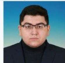
Депутат Государственной Думы Федерального собрания Российской Федерации VIII созыва