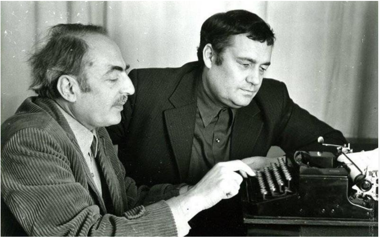
Эмиль Брагинский и Эльдар Рязанов