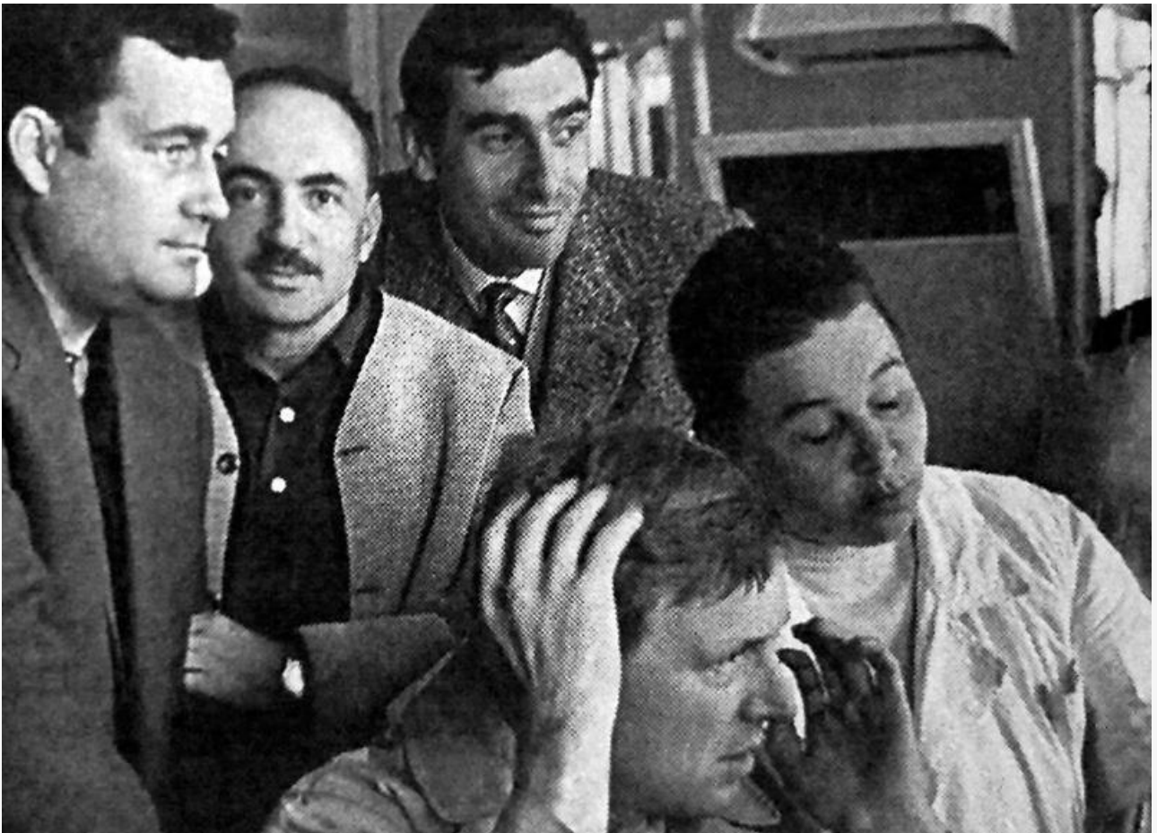
Эмиль Брагинский и Эльдар Рязанов на съёмках фильма «Берегись автомобиля»