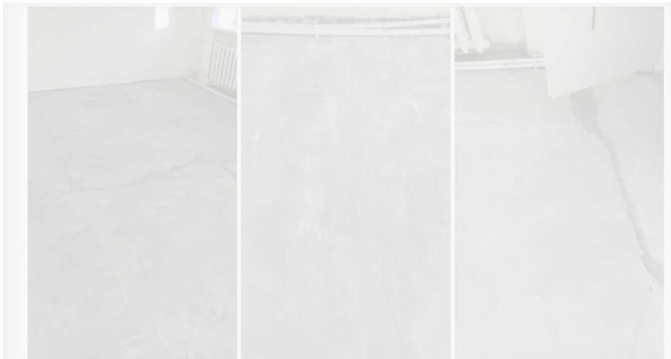
Пол детского сада №3.

По информации мэрии Томска, детский сад в Светлом откроется до 24 ноября. Подрядчик, который занимался ремонтом, некачественно сделал стяжку теплого пола в детских игровых. За срыв сроков его оштрафуют.