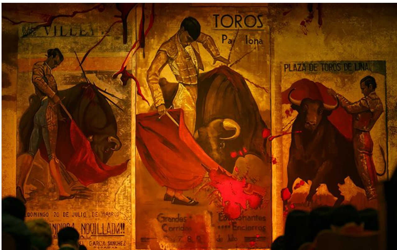
Суперзанавес спектакля «Кармен» в БГАТОиБ