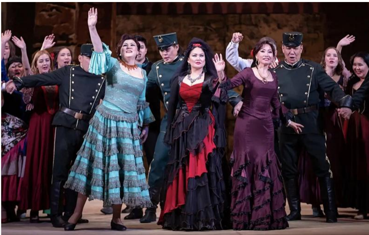
Сцена из IV акта

На крови, которая, судя по премьерным фотографиям, должна была быть, в этот вечер тоже решили сэкономить. То ли зритель её не заметил, потому что Кармен была в красном платье, а не в белом, как задумывал художник. То ли в театре решили обойтись без лишних эффектов. К чему эти сложности, когда и так всё ясно. Умерла и умерла, и кровь потом отмывать не надо. Тем более столько праздничных поводов, и столы уж накрыты.