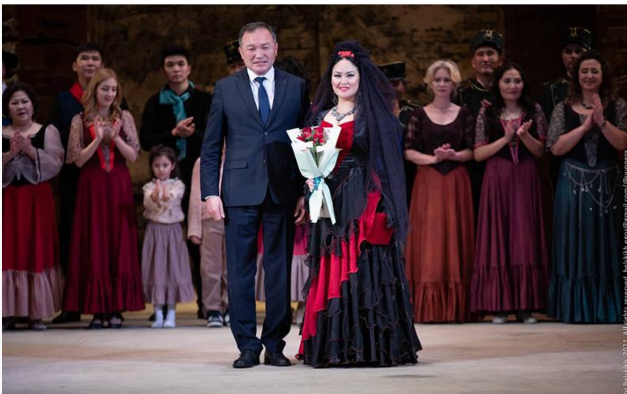
Народная артистка Республики Бурятия Ольга Жигмитова