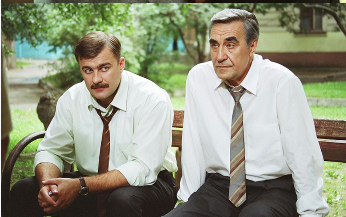
Кантемиров в фильме «Большая любовь», 2006 год