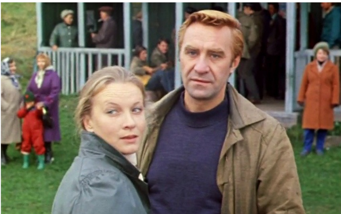
Васильевич в фильме «Дамское танго», 1983 год