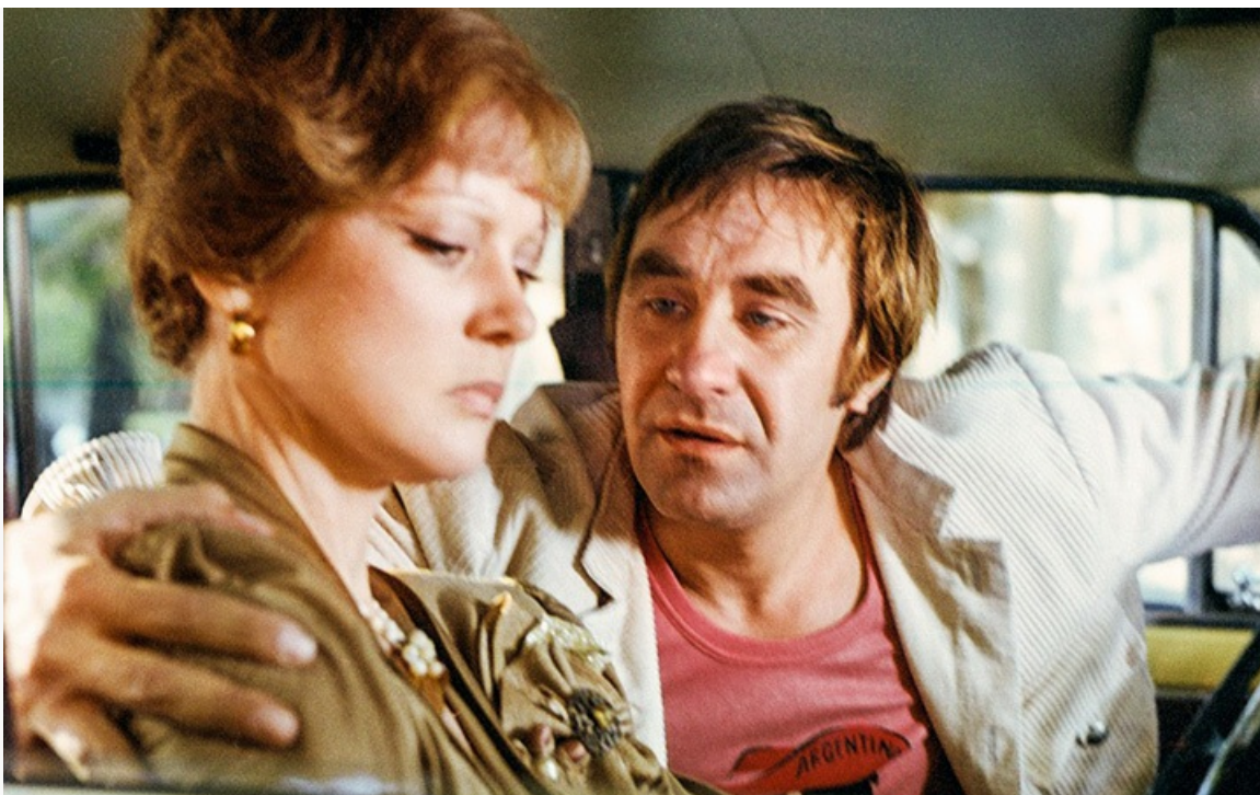
Гаврилова», 1981 год