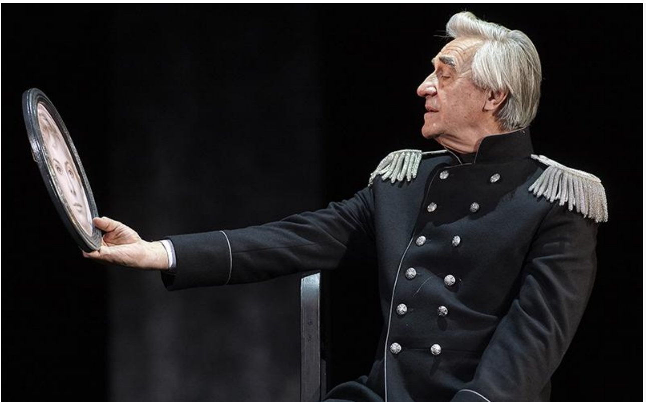
Генерал Епанчин в спектакле «Идиот». Театр имени Моссовета, постановка 2017 года