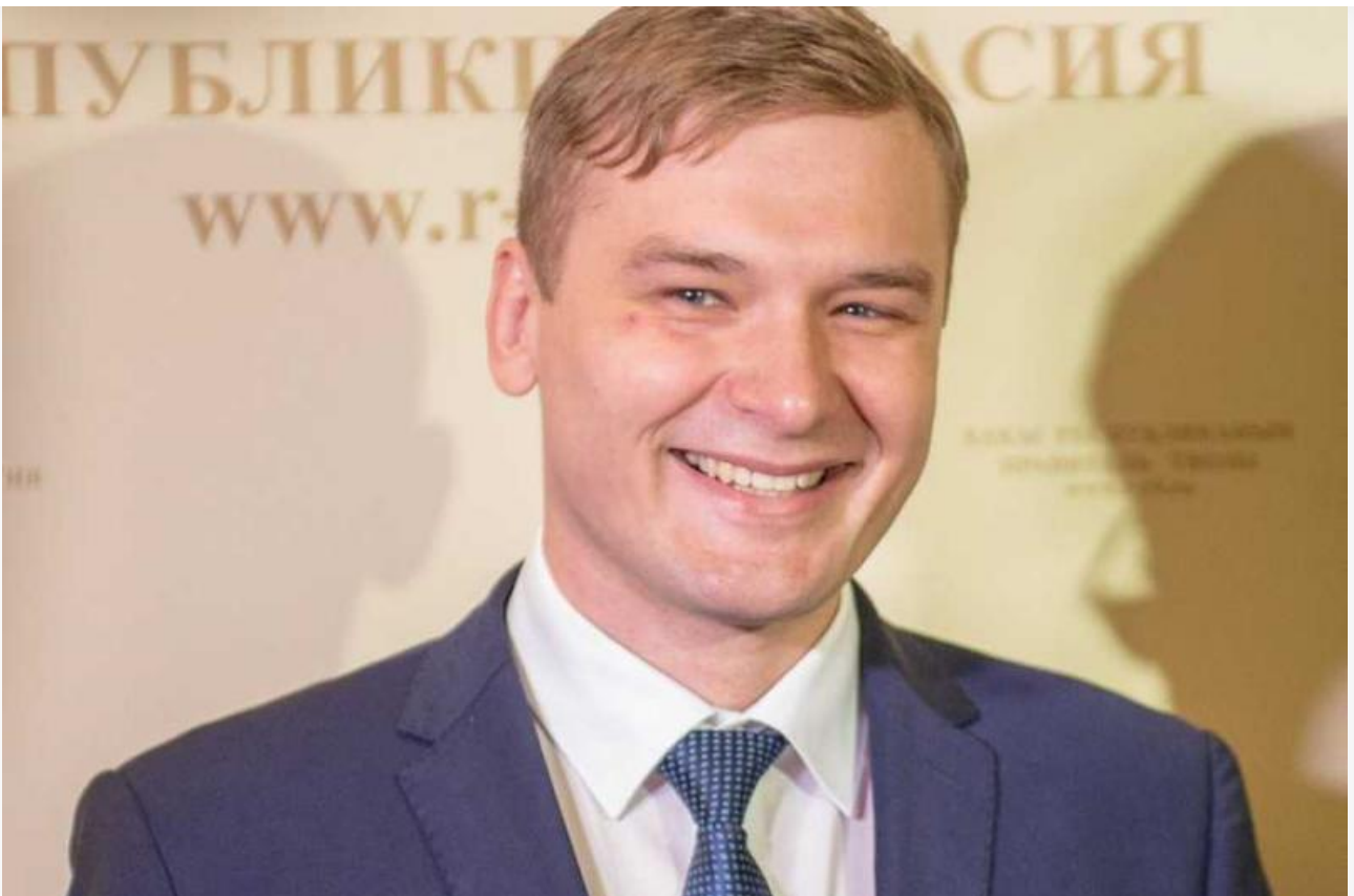
Валентину Коновалову прочат отставку с губернаторского поста

Слух об укрупнении сибирских регионов обрёл новую силу в связи с ослаблением позиций хакасского губернатора Валентина Коновалова и замаячившими на горизонте перестановками на посту главы Хакасии. В сентябре Валентин Коновалов отказался от мандата в Госдуме, осложнив тем самым путь в губернаторы Сергею Соколу. Несмотря на отказ Коновалова покинуть пост в добровольно-принудительном порядке, рокировка всё ещё может состояться. В середине сентября издание РБК со ссылкой на свои источники сообщило, что в Кремле готовят досрочную отставку молодого коммуниста. А в качестве его преемника обсуждается кандидатура единоросса Сергея Сокола, избравшегося в Госдуму по хакасскому одномандатному округу.