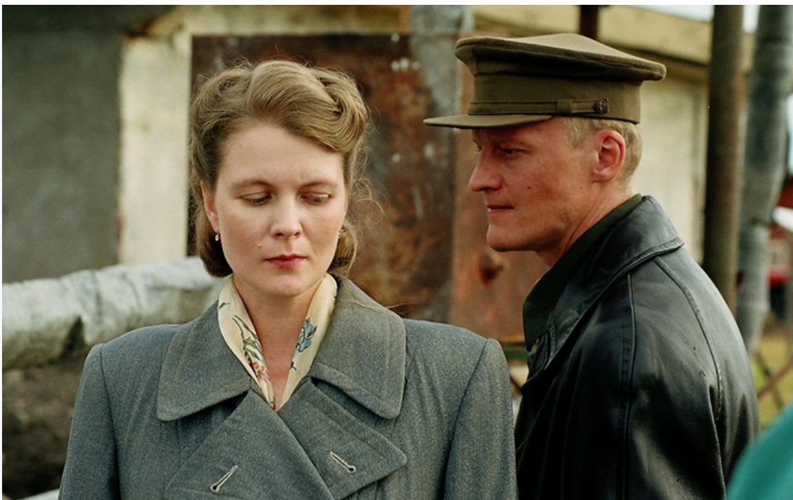
«Перегон», 2006 год