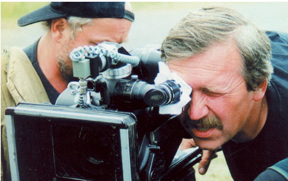
«Блокпост», 1999 год