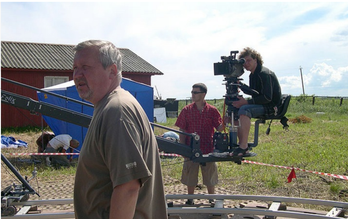
Александр Рогожкин на съёмках фильма «Перегон»