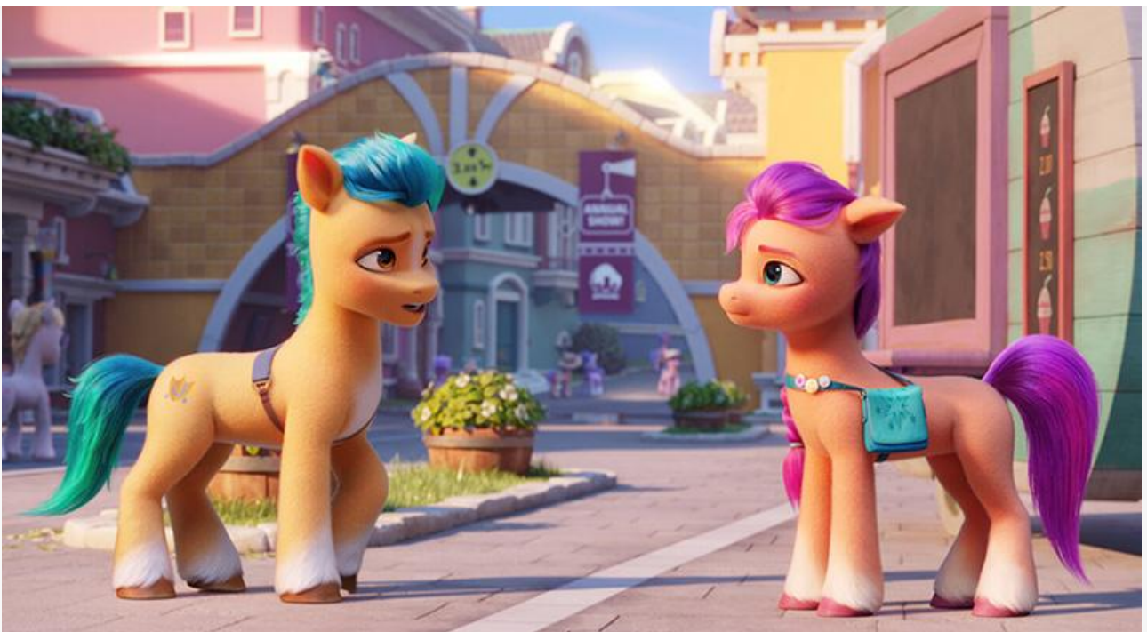
Кадр из фильма «My Little Pony: Новое поколение»

Также в десятку лидеров проката вошли «Дюна» (4 место и 53,2 миллиона), прочно обосновавшаяся на третьем месте среди релизов 2021 года, «Босс-молокосос 2» (5 место и 10,4 миллиона), «My Little Pony: Новое поколение» (6 место и 7,8 миллиона), «Клаустрофобы-2: Лига выживших» (7 место и 5,8 миллиона), «Шан-Чи и Легенда десяти колец» (8 место и 3,1 миллиона) и «Её заветное желание» (10 место и 2,4 миллиона). Обратите внимание, что в топ-10 вошли сразу четыре анимационных проекта.