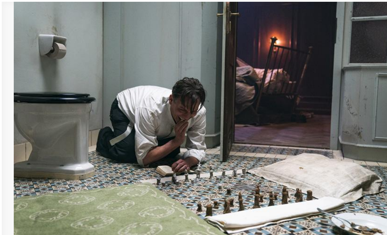
Кадр из фильма «Королевская игра»

В наступившем уикенде с пьедестала проката «Веном 2» и «Не время умирать» попытаются уже упомянутая «Семейка Адамс: Горящий тур», а также хорроры «Демоник» Нила Бломкампа и «Деревня проклятых» Рэйне МакКормака, криминальный триллер «Исчезнувший» Кристиана Кариона, драма Филиппа Штёльцля «Королевская игра» по «Шахматной новелле» Стефана Цвейга, фэнтезийный мультфильм Дэша Шоу «Криптополис», биографическая мелодрама Мартина Бурбулона «Эйфель» и российская драма «18+» от Натальи Кудряшовой «Герда».