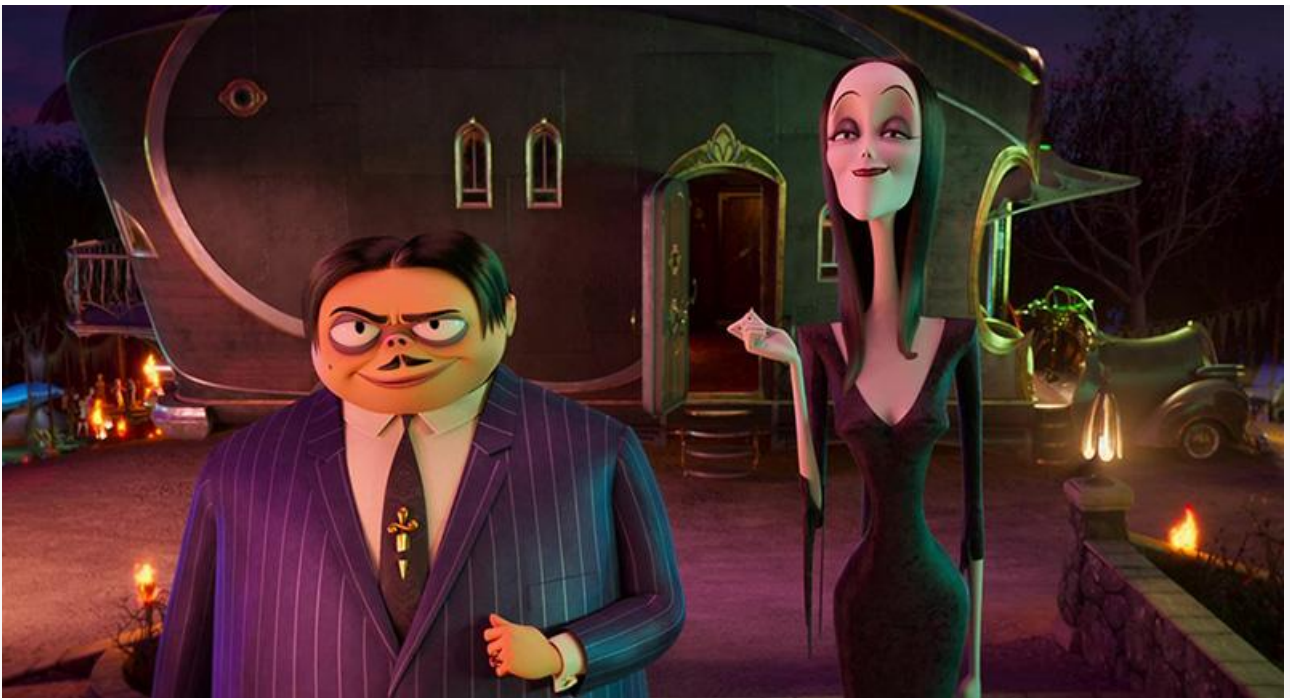
Кадр из фильма «Семейка Адамс: Горящий тур»

Редкий случай в российском прокате – попадание в топ-10 документального фильма. В минувшие выходные биографическая лента Петра Шепотинника о Сергее Бодрове-младшем «Нас других не будет» всего на 170 экранах собрала 2,5 миллиона рублей и заняла по итогам уикенда девятое место, опередив, к слову, все премьеры недели, кроме «Не время умирать» .