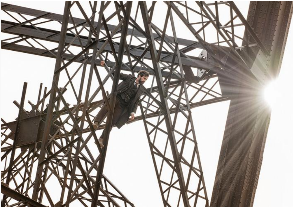
Кадр из фильма «Эйфель»