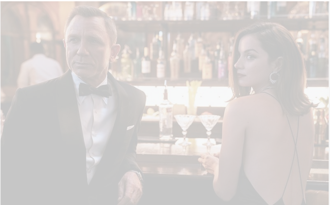
Кадр из фильма «Не время умирать»