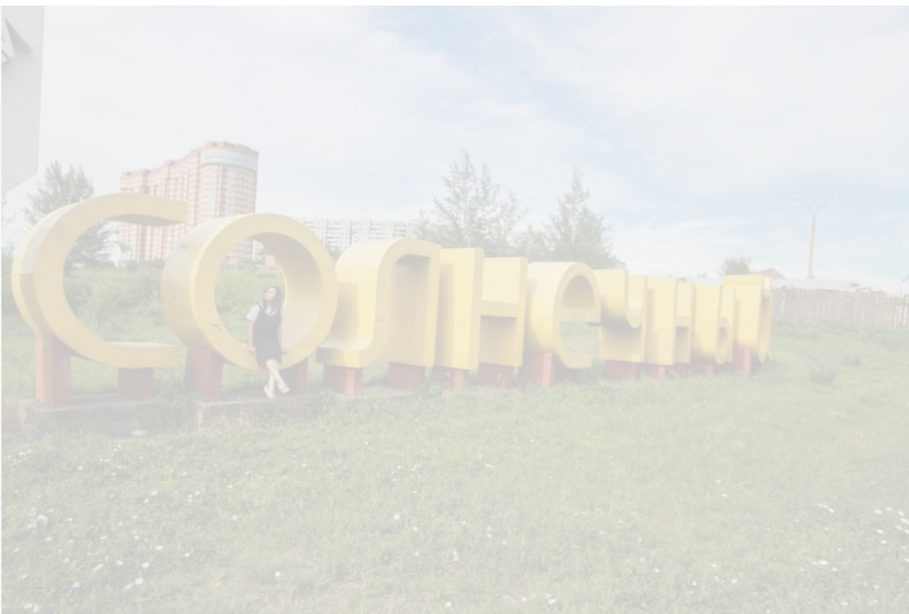
Красноярск падает и сползает