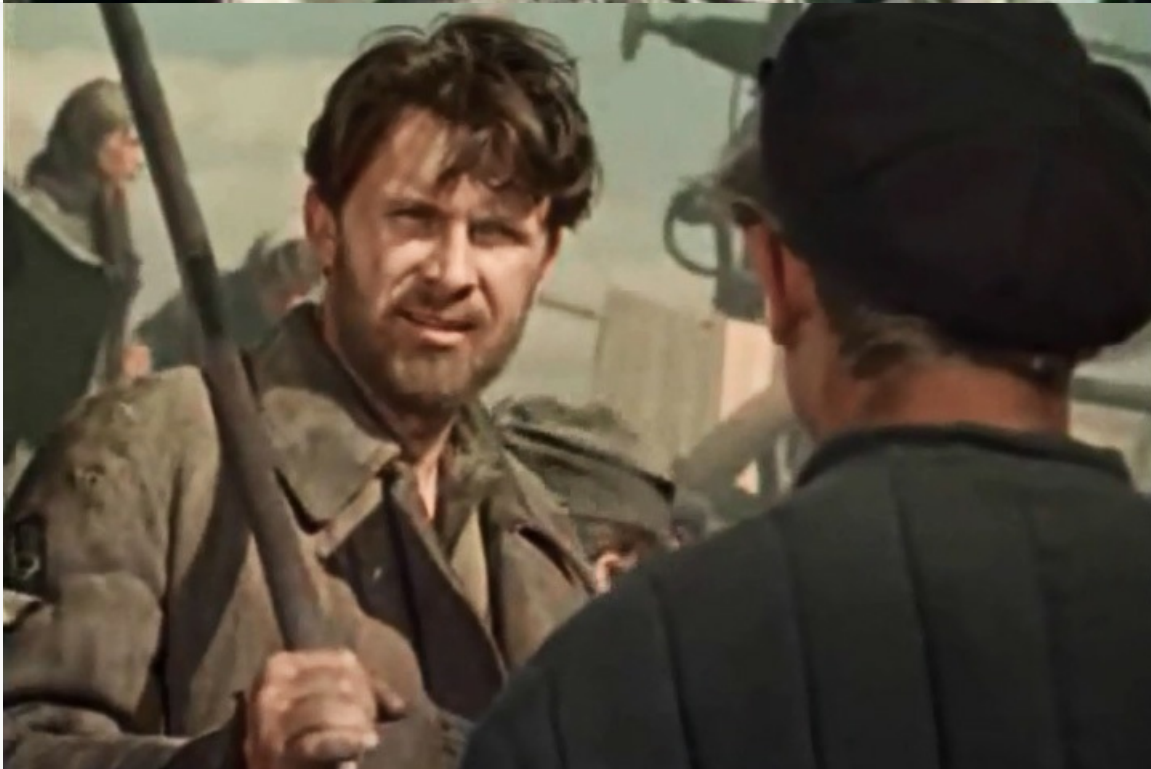
«Партизанская искра», 1957 год