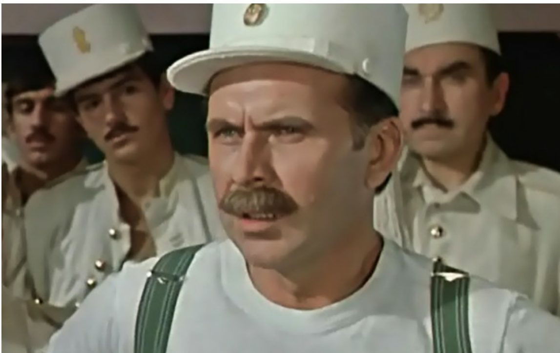
«Интервенция», 1968 год