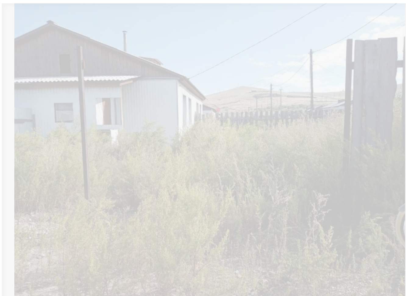
Фото: `Дети-сироты Бурятии`

По информации местного жителя, злоумышленники разрушают и разворовывают весь микрорайон.