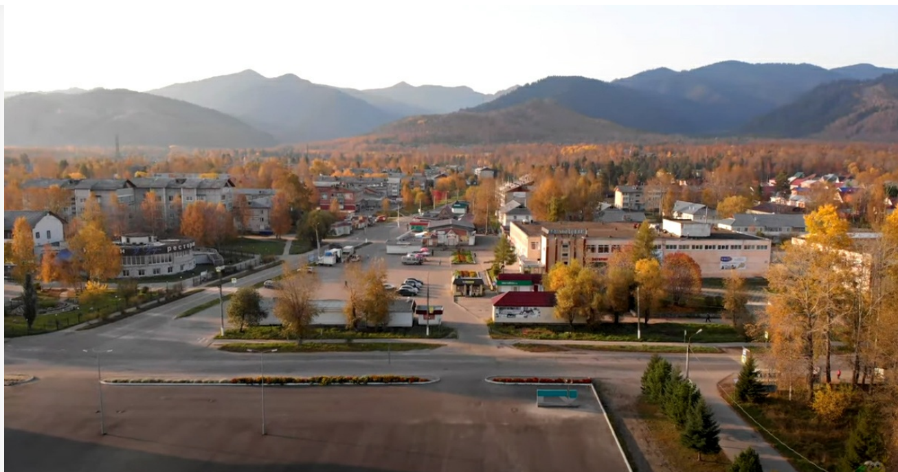
Автор: Даниил Тетерин Фото из альбома "Иркутская область. Байкальск. Лето" © Фотобанк "RuVabr"

известного у туристов. К примеру, Суздаля, Галича или Ростова Великого. Из каждого из этих городов можно легко создать настоящую туристическую Мекку, причем с гораздо меньшими затратами: дороги уже есть, гостиницы есть, репутация есть. Ничего этого, однако, не делается — все три города представляют собой заброшенные деревни с мизерным бюджетом и катастрофическим уровнем жизни населения.