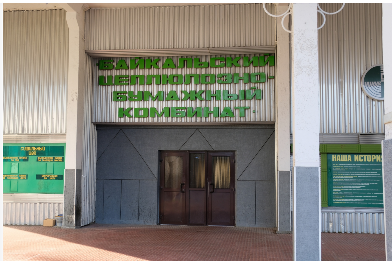
Фото из альбома "Иркутская область. Байкальск. БЦБК"

28 декабря 2013 года президентом России Владимиром Путиным было подписано распоряжение о создании на территории закрывшегося комбината экспоцентра «Заповедники России». Распоряжение не просто не выполнено - о нем за восемь лет никто даже не вспомнил.