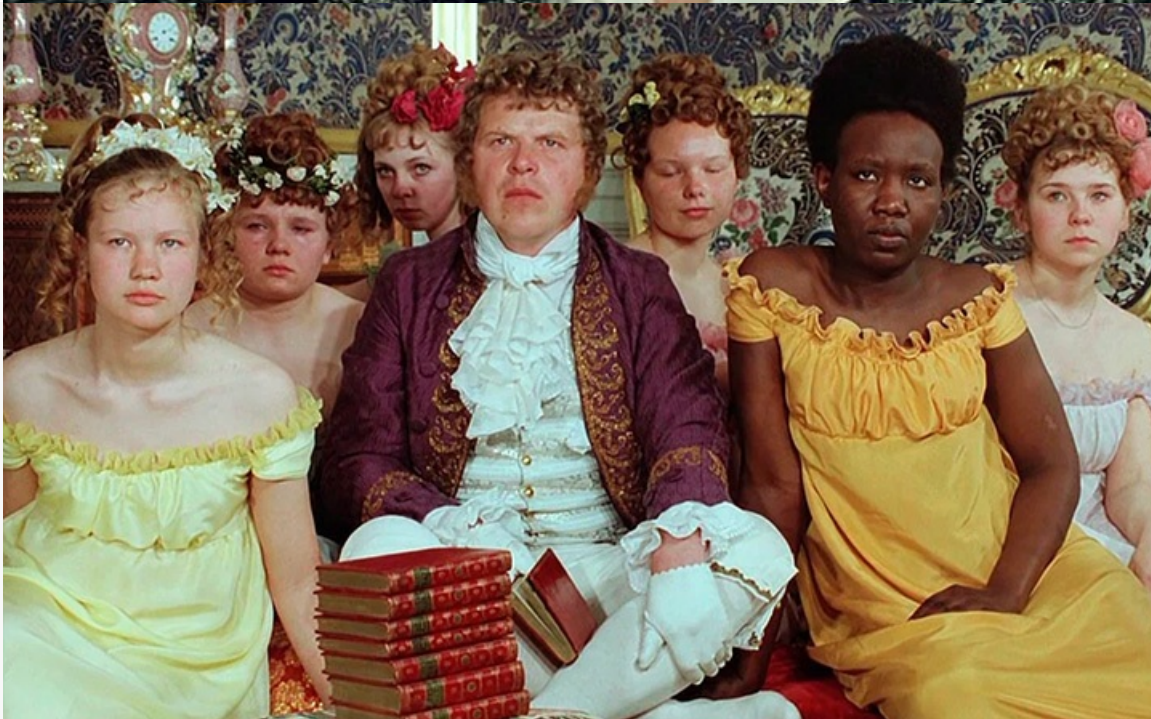
пленительного счастья», 1975 год