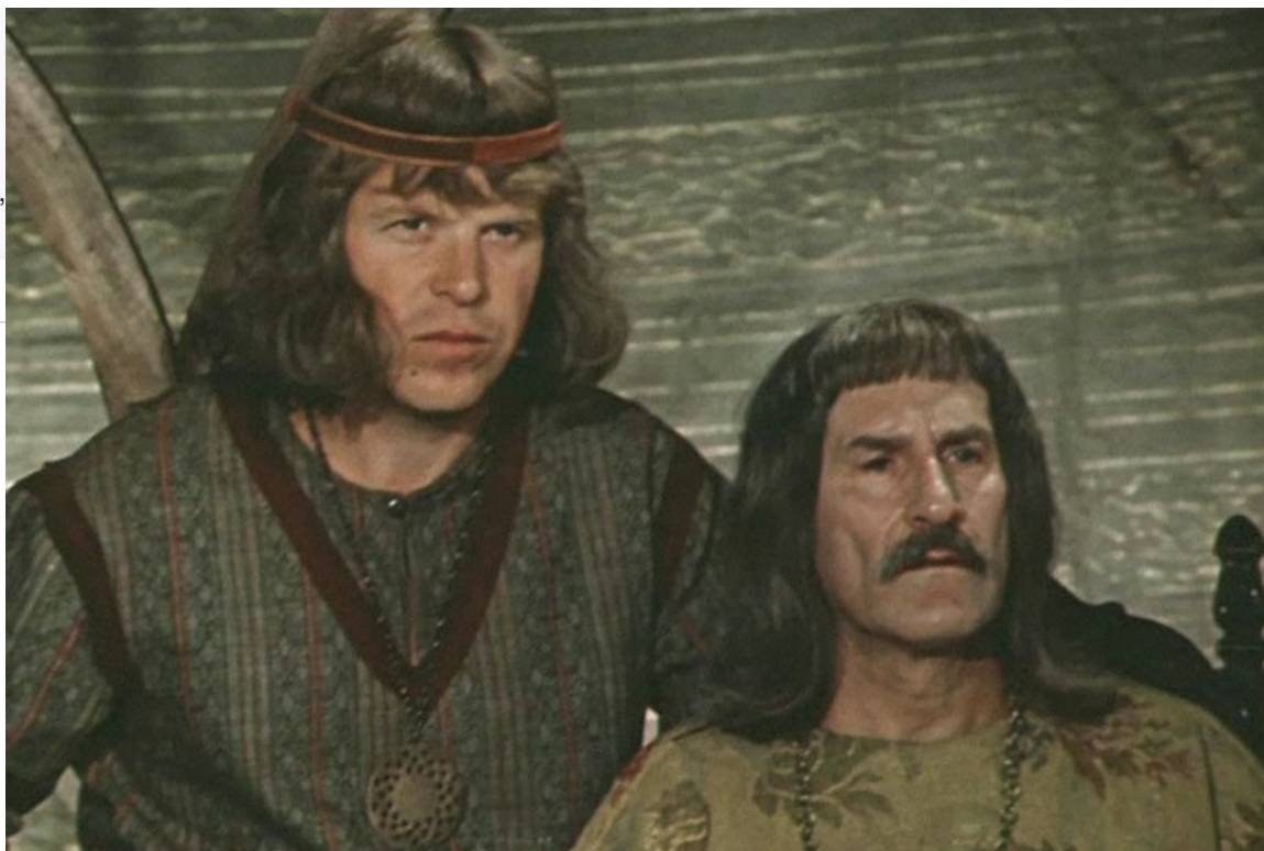
Слуга Альбера в фильме