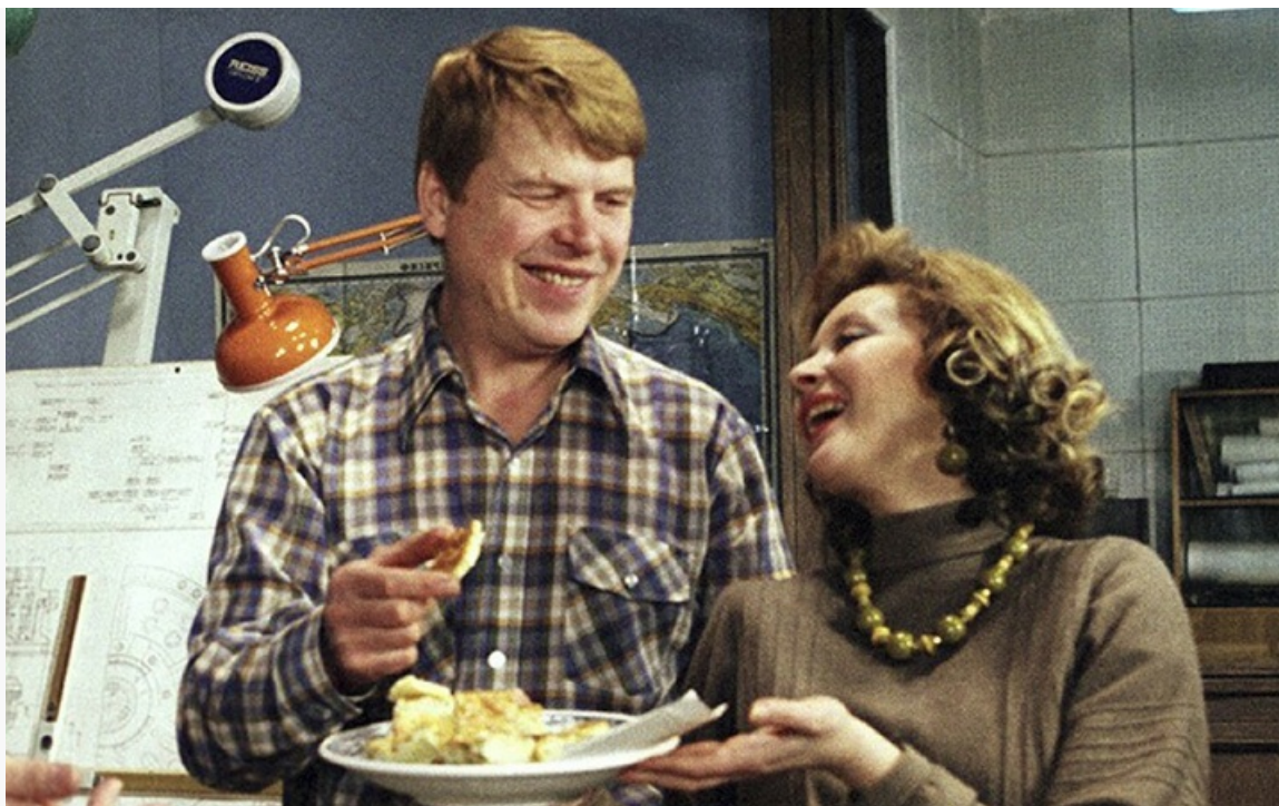
обаятельная и привлекательная», 1985 год