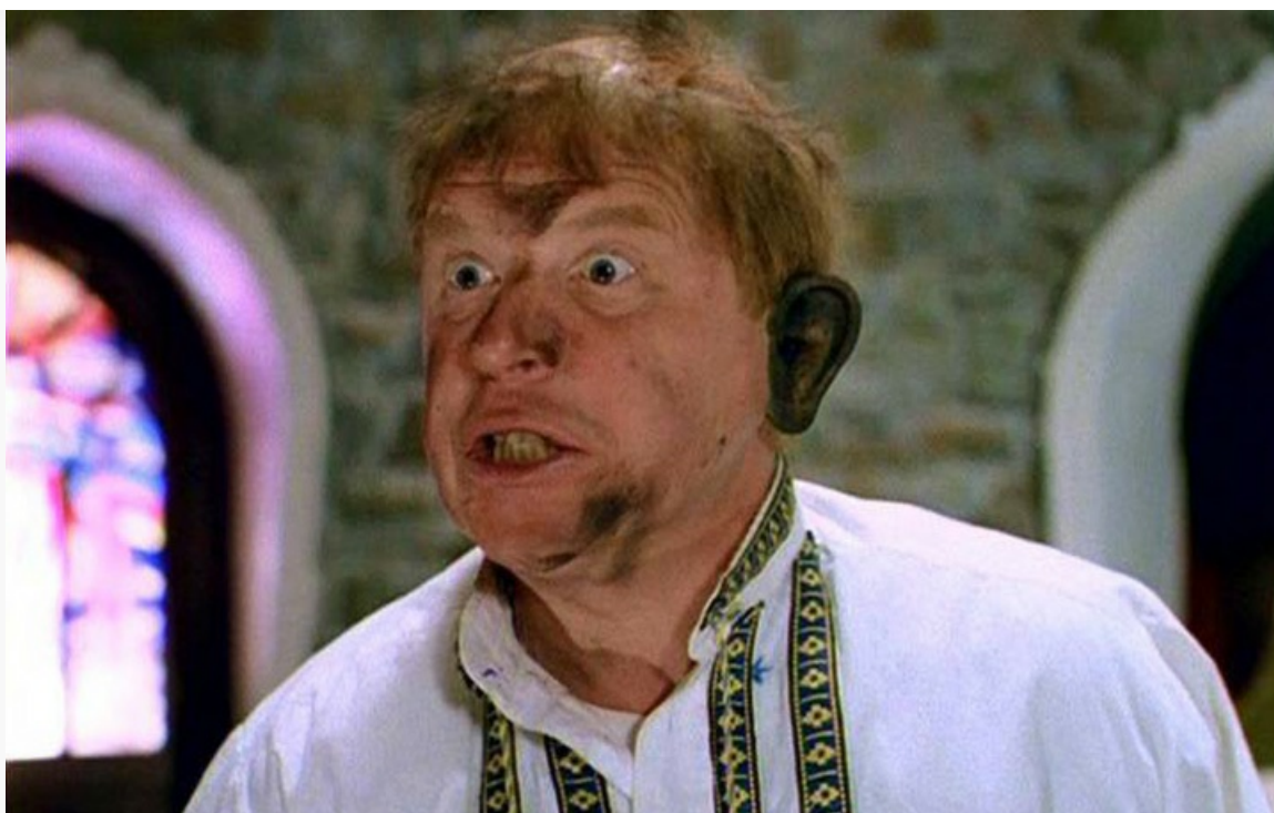
Дерибасовской хорошая погода, или На Брайтон-Бич опять идут дожди», 1992 год