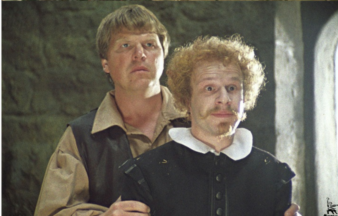
«Маленькие трагедии», 1979 год

Всего в фильмографии Михаила Кокшенова около 150 ролей в советских и российских фильмах и телесериалах, а также сатирических киножурналах «Фитиль» и «Ералаш».