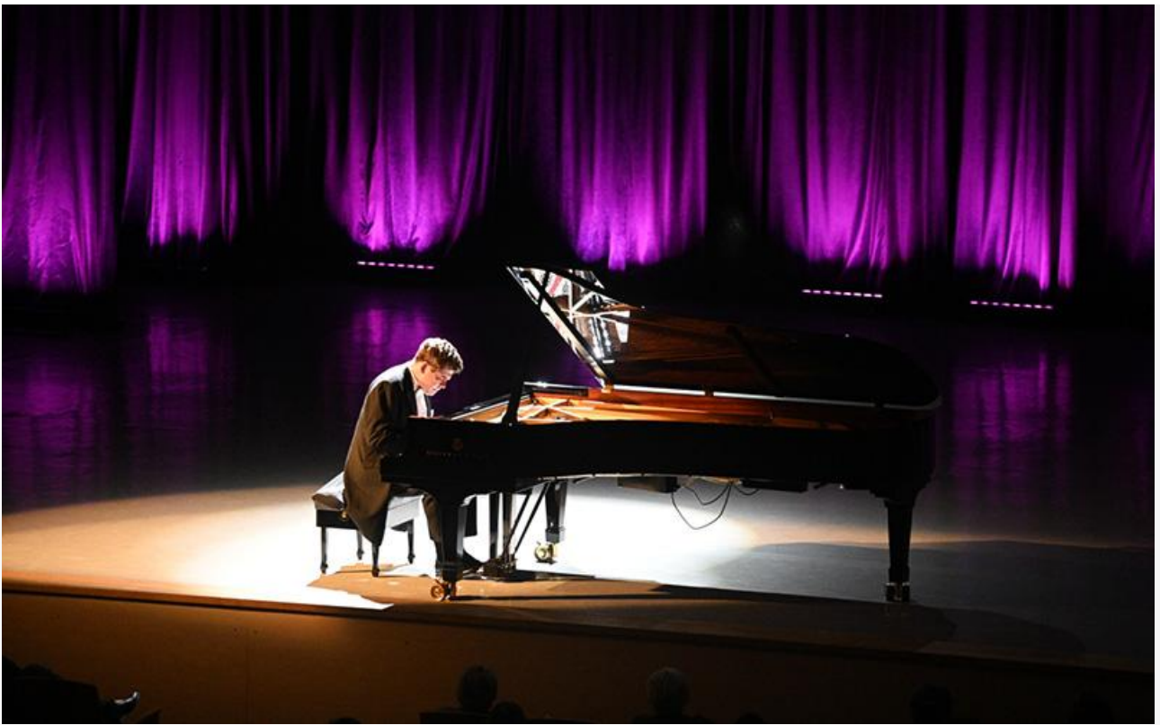
Денис Мацуев в Калуге 7 сентября