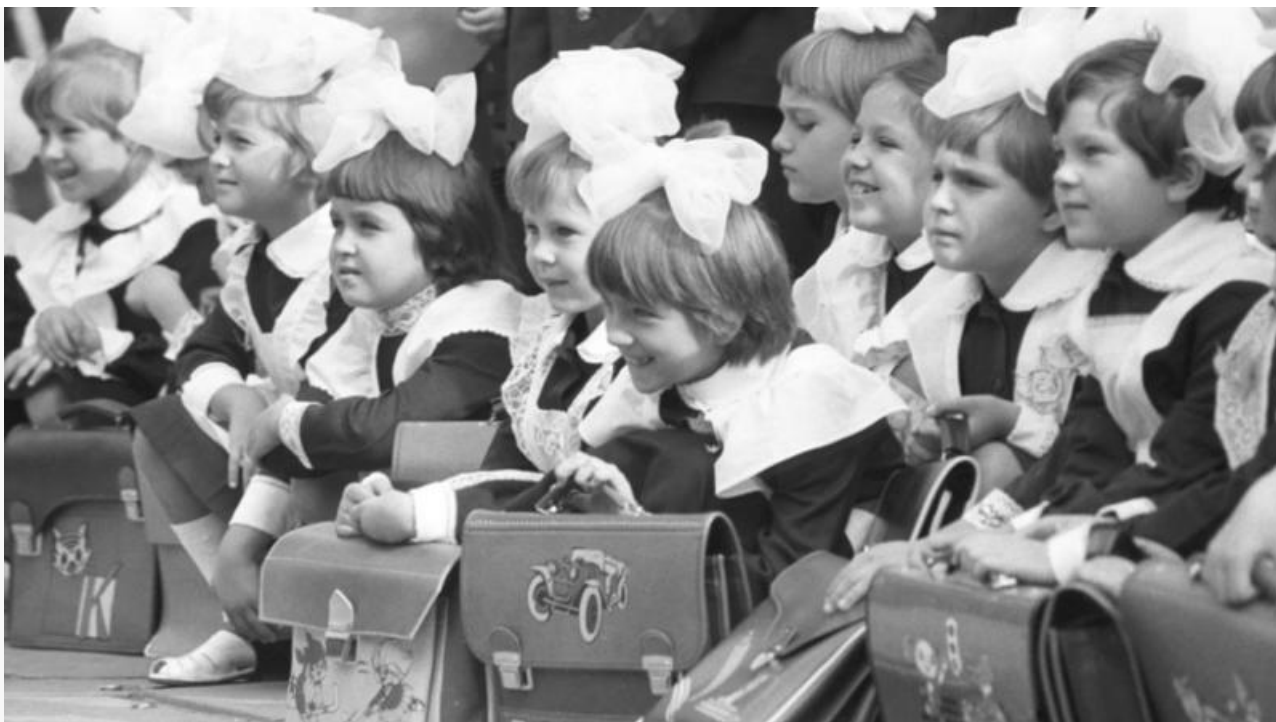
Торжественная линейка 1 сентября 1976 года

Эта традиция празднования жива и по сей день. Только вот, кажется, в 2017 году мы сделали шаг назад в советское прошлое. С 1 сентября 2017 года занятия во всех классах начинаются с открытого (весьма пропагандистского) урока «Россия, устремлённая в будущее».