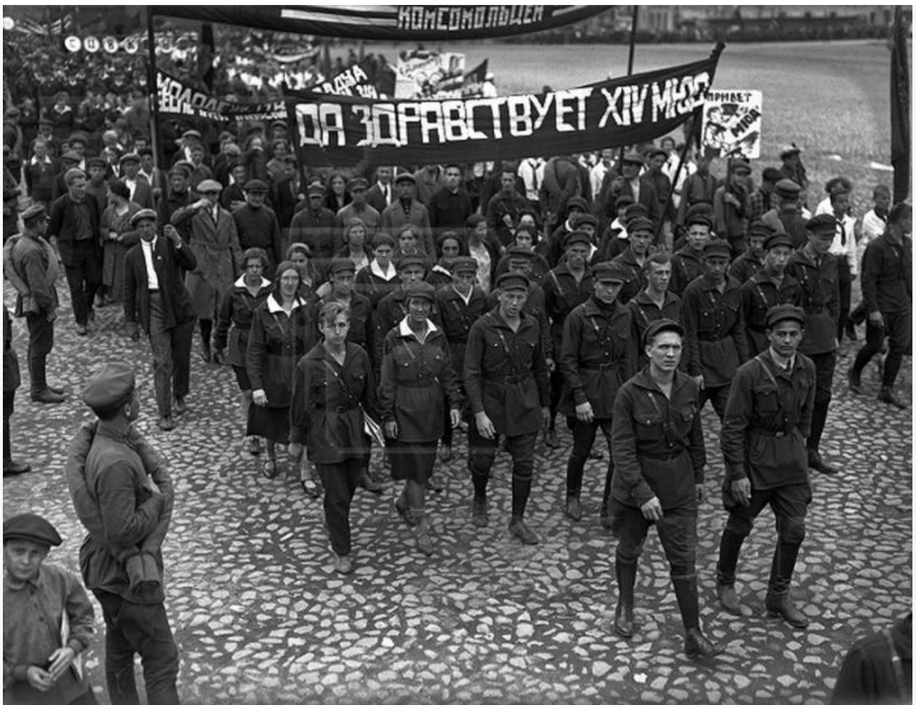
Празднование МЮД в Советской России

Окончательно официальным Днем знаний 1 сентября стал только в 1984 году. 15 июня 1984 года вышел Указ Президиума Верховного Совета СССР № 373-11 «Об объявлении 1 сентября всенародным праздником — Днём знаний».