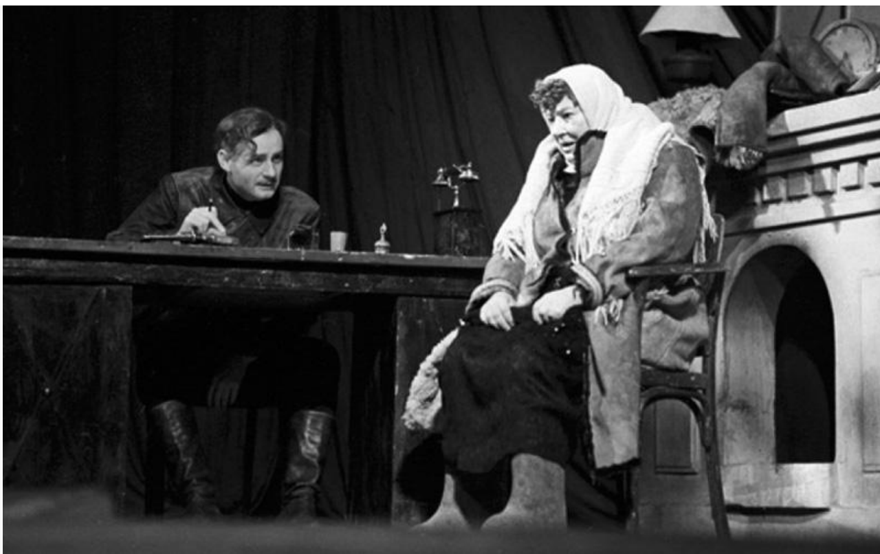
Манька-спекулянтка в спектакле «Шторм». Театр имени Моссовета, 1954 год

В Театре Армии Фаина Раневская прослужила шесть лет. Затем были Театр имени Маяковского, Театр имени Моссовета, Театр имени Пушкина и возвращение в Театр имени Моссовета, в котором актриса служила до конца своих дней. Частую смену театров в своей карьере Раневская объясняла «поисками большого искусства, которое в результате нашла в... Третьяковской галерее».