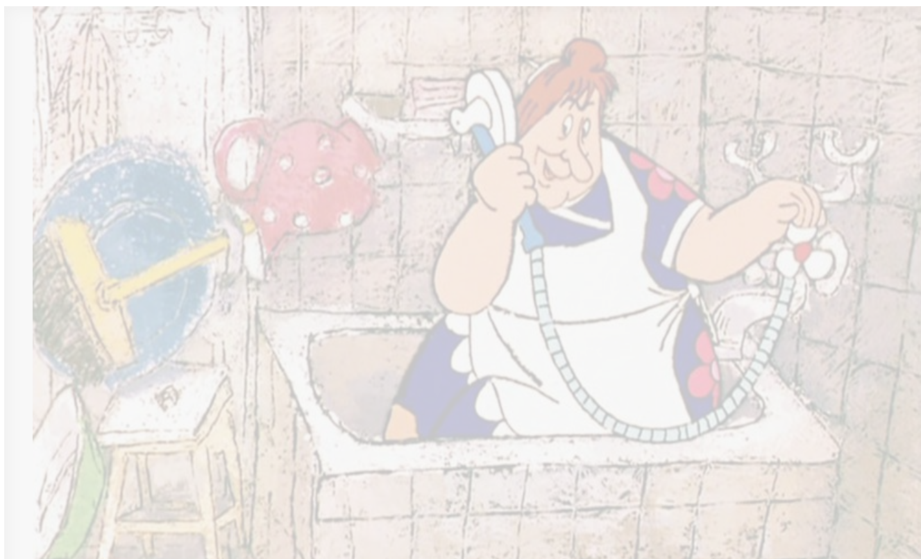
Фрекен Бок в мультфильме «Карлсон вернулся», 1970 год