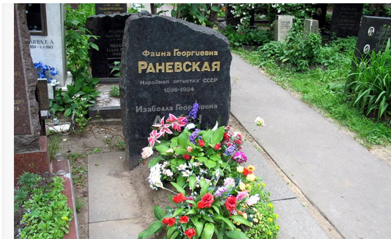
Могила Фаины Раневской

Скончалась Фаина Раневская 19 июля 1984 года в возрасте 87 лет. Её скромной могиле можно поклониться на Новом Донском кладбище Москвы. Саркастическая просьба народной артистки написать на надгробном памятнике «Умерла от отвращения» исполнена не была.