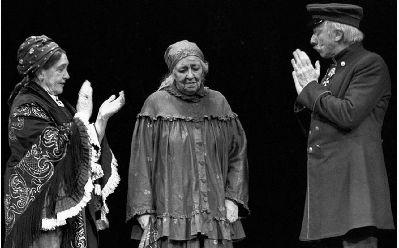
Филицата в спектакле «Правда хорошо, а счастье лучше». Театр имени Моссовета, 1982 год