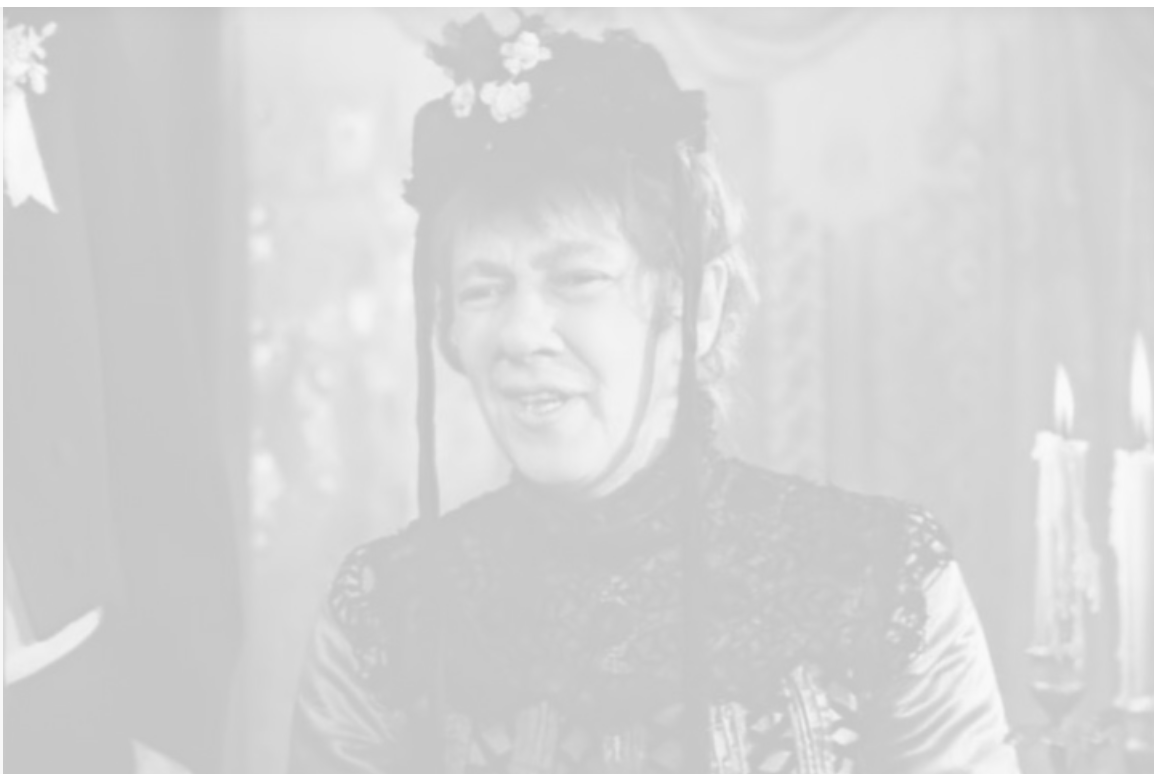
«Свадьба», 1944 год