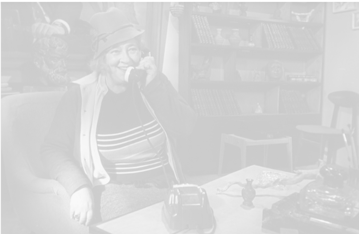
(«Королева Марго») в фильме «Лёгкая жизнь», 1964 год