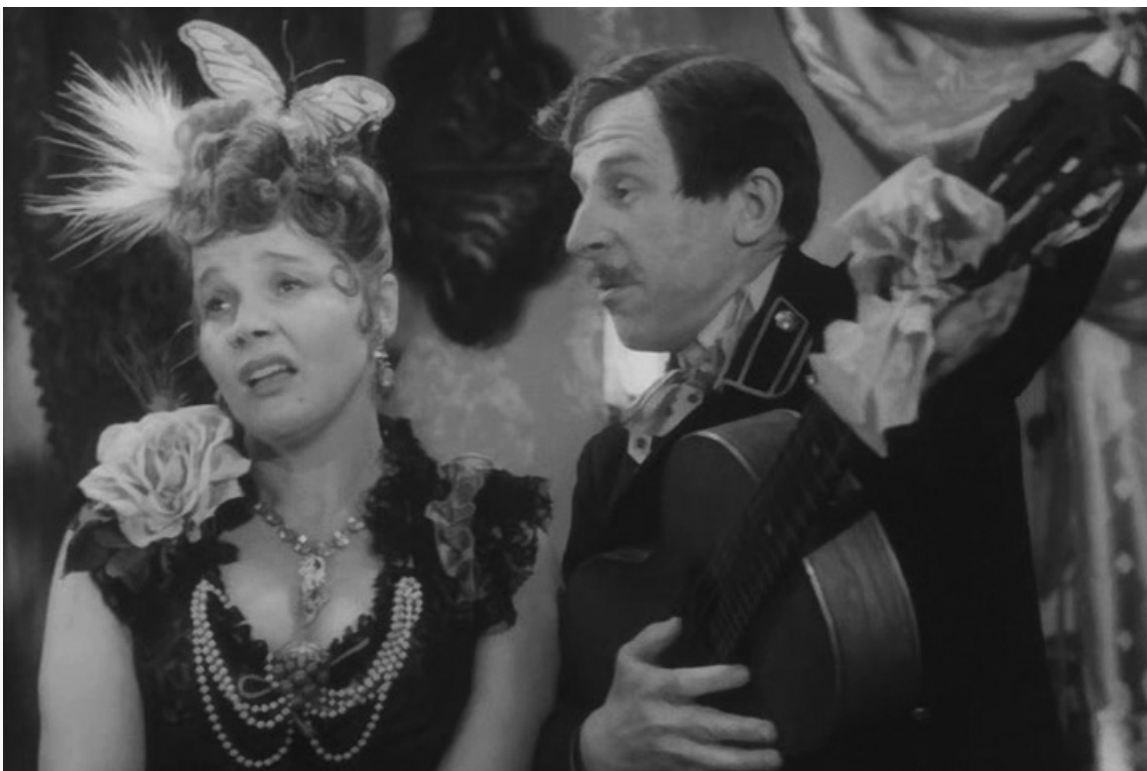
Мартыновна Змеюкина в фильме «Свадьба», 1944 год

В 29 лет Вере Марецкой было присвоено звание заслуженной артистки РСФСР. В 1943 году она стала народной артисткой РСФСР, а спустя ещё шесть лет – народной артисткой Советского Союза.