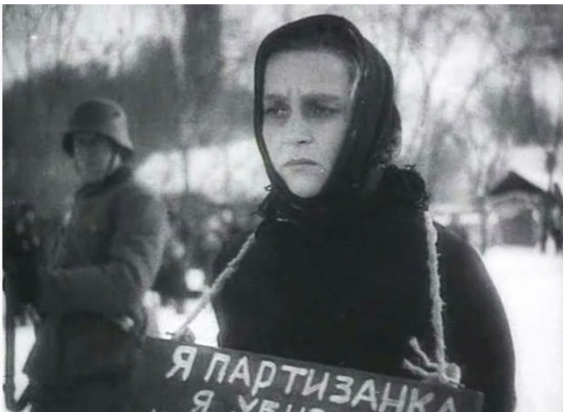
(Товарищ П) в фильме «Она защищает Родину», 1943 год