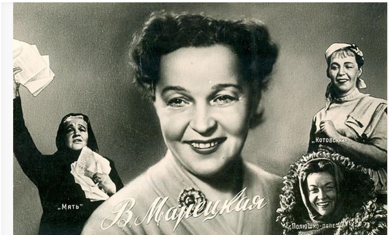
Советская открытка, 1958 год

31 июля исполняется 115 лет со дня рождения великой русской актрисы, лауреата четырёх Сталинских премий, Героя Социалистического Труда, народной артистки СССР Веры Марецкой.