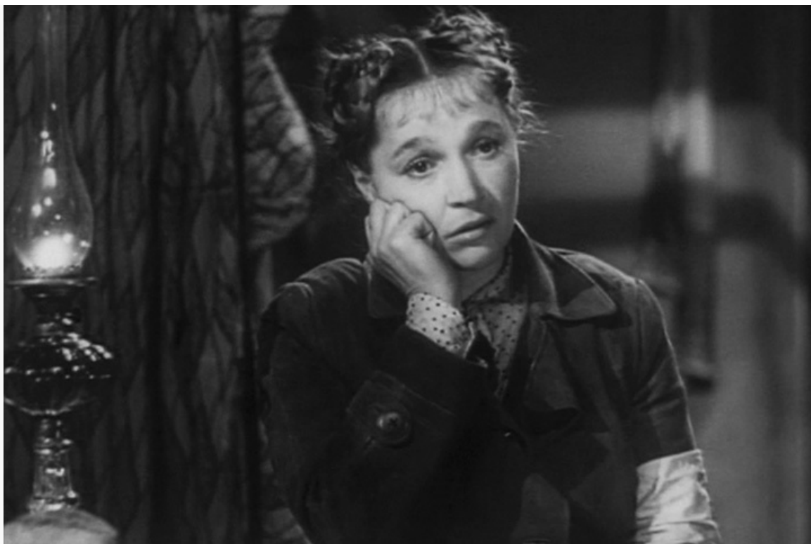
«Котовский», 1942 год