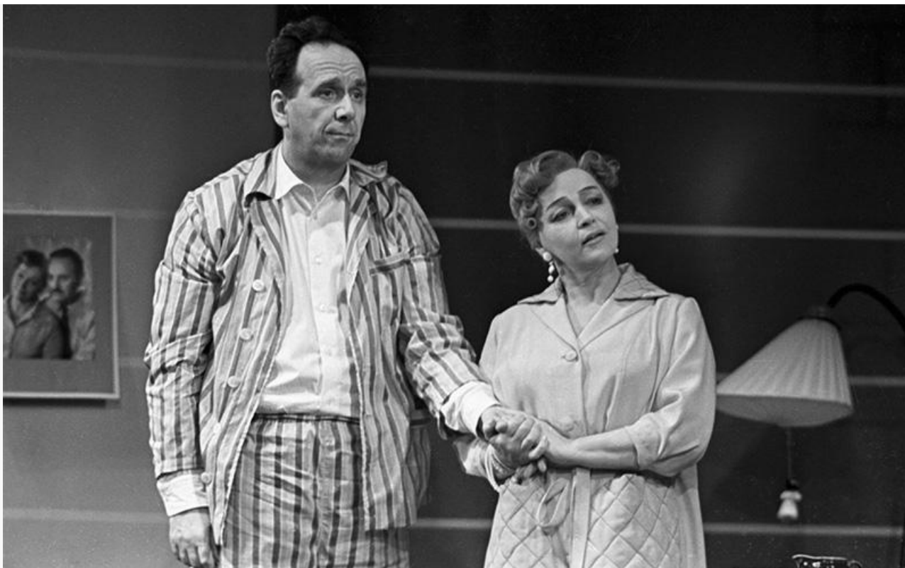
Ольга Фёдоровна в спектакле «Миллион за улыбку». Театр Моссовета, постановка 1959 года

Разноплановость таланта актрисы не знала границ. На сцене Театра Моссовета Вера Марецкая блистала без малого сорок лет, создав россыпь ярких драматических, лирических, характерных и откровенно комических образов: Мирандолина в «Трактирщице», Маша в «Чайке», Живка в «Госпоже министерше», Кручинина в «Без вины виноватых», Капитолина Солнцева в «Рассвете над Москвой», Маргарет Челмерс в «Краже», Ольга Фёдоровна в «Миллионе за улыбку», Мария Александровна в «Дядюшкином сне», Пульхерия Александровна в «Петербургских сновидениях», Этель Сэвидж в «Странной миссис Сэвидж» и многие, многие другие.