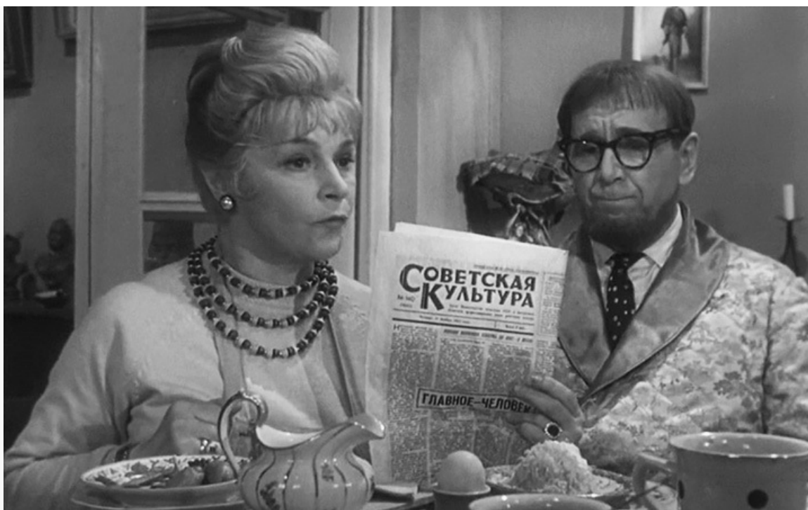
Муромцева в фильме «Лёгкая жизнь», 1964 год

Последние годы жизни великой актрисы были омрачены тяжёлой болезнью, однако она продолжала выходить на сцену в перерывах между операциями. Скончалась Вера Марецкая 17 августа 1978 года в возрасте 72 лет. За два года до смерти ей вручили золотую медаль «Серп и Молот» Героя Социалистического Труда.