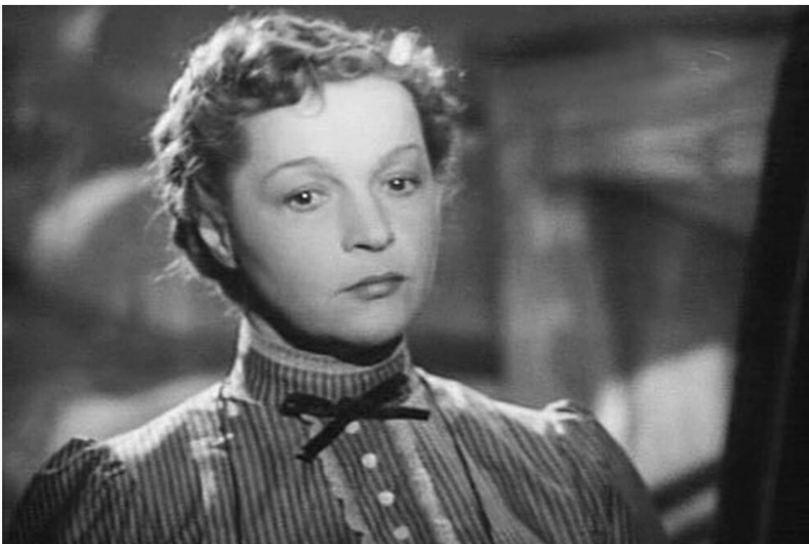
Васильевна Мартынова в фильме «Сельская учительница», 1947 год