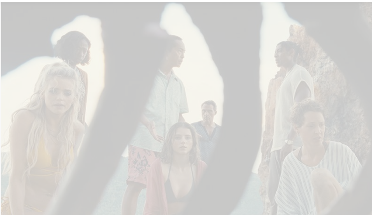
Кадр из фильма «Время»

Слоган: «Жизнь – лишь вопрос времени». Хронометраж: 113 минут.