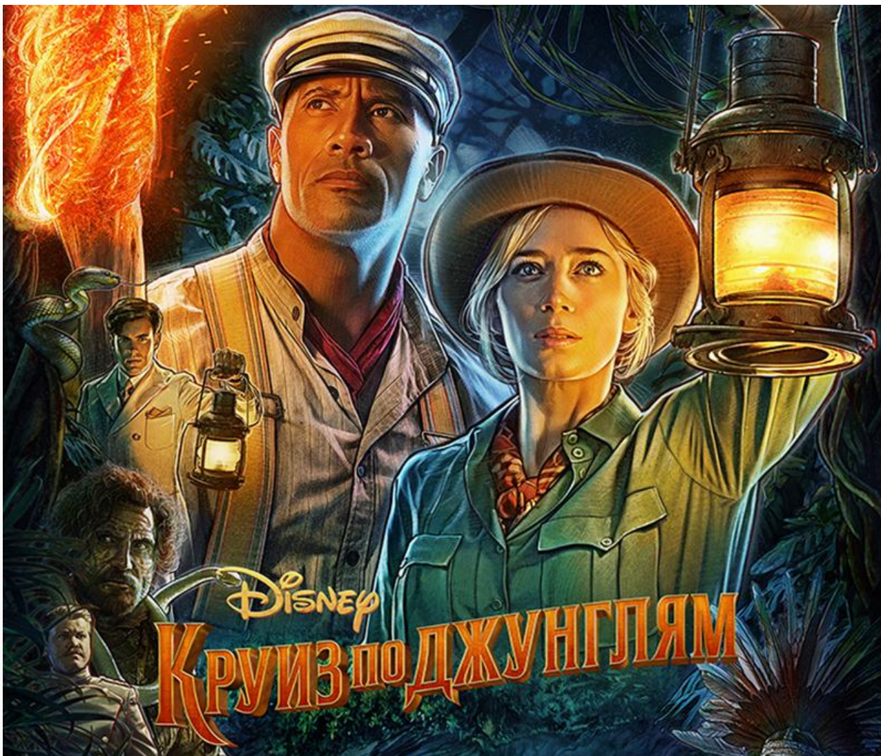
Постер к фильму «Круиз по джунглям»

Среди других новинок проката – американский мультфильм «Золушка и заколдованный принц» , боевик Тани Уэкслер «Красотка на взводе» , криминальный триллер Майка Бёрнса с Джейми Кинг и Брюсом Уиллисом «За гранью жизни» и (внимание!) перевыпуск культового триллера 1992 года от Пола Верховена «Основной инстинкт» .