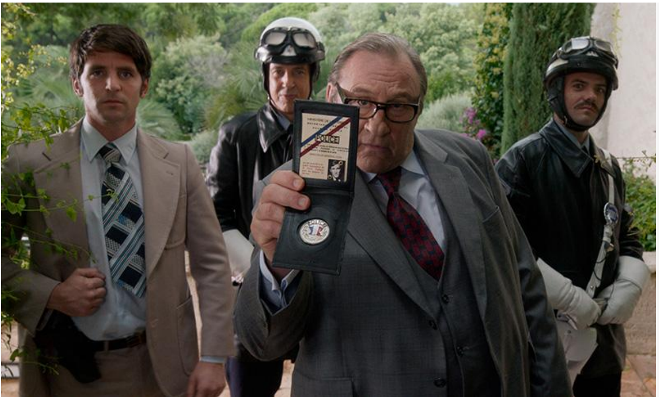
Жерар Депардьё в фильме «Тайна Сен-Тропе»

Премьера позапрошлой недели – анимационно-игровой фильм «Космический джем: Новое поколение» – за свои вторые выходные собрал 44,7 миллиона рублей и занял четвёртую позицию. На пятом месте с 21,8 миллиона должжител проката – мультфильм от Pixar «Лука» , переживший уже шестой уикенд.