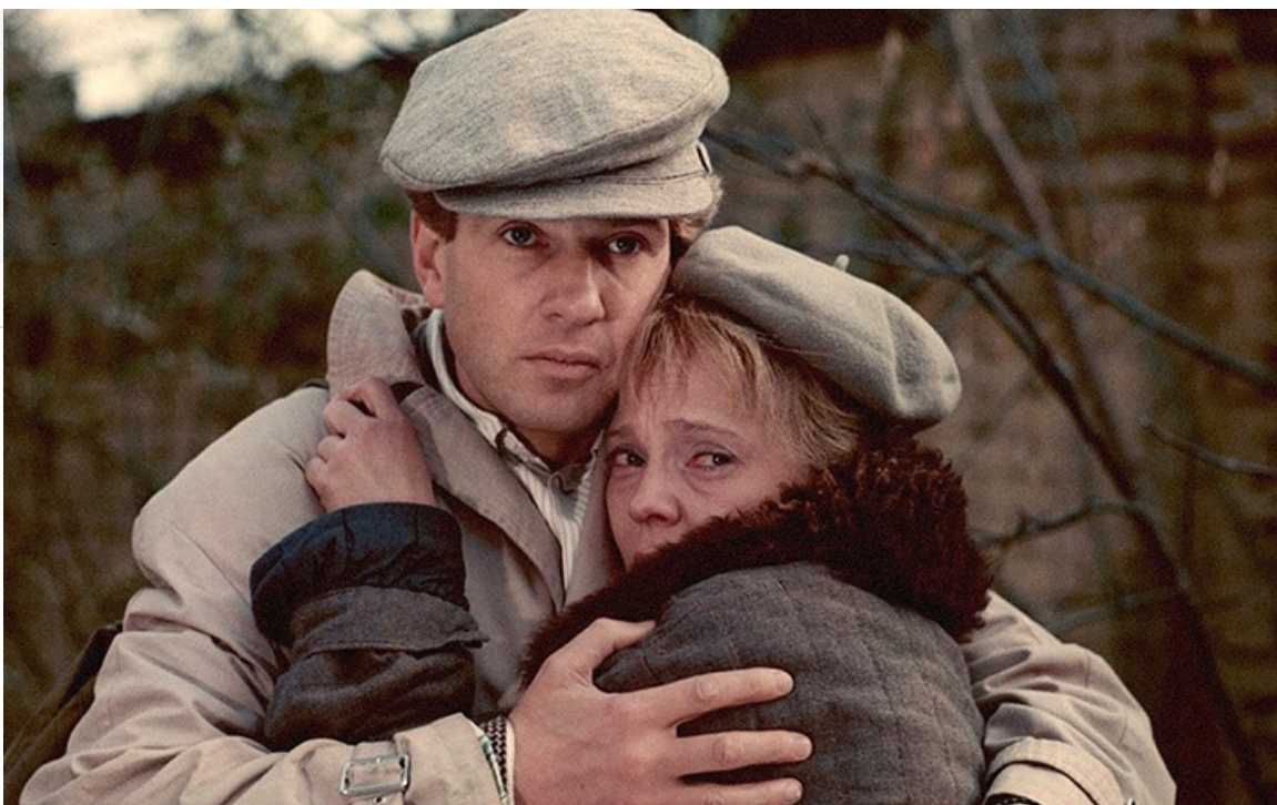
Ольга Калинкина в фильме «Законный брак», 1985 год