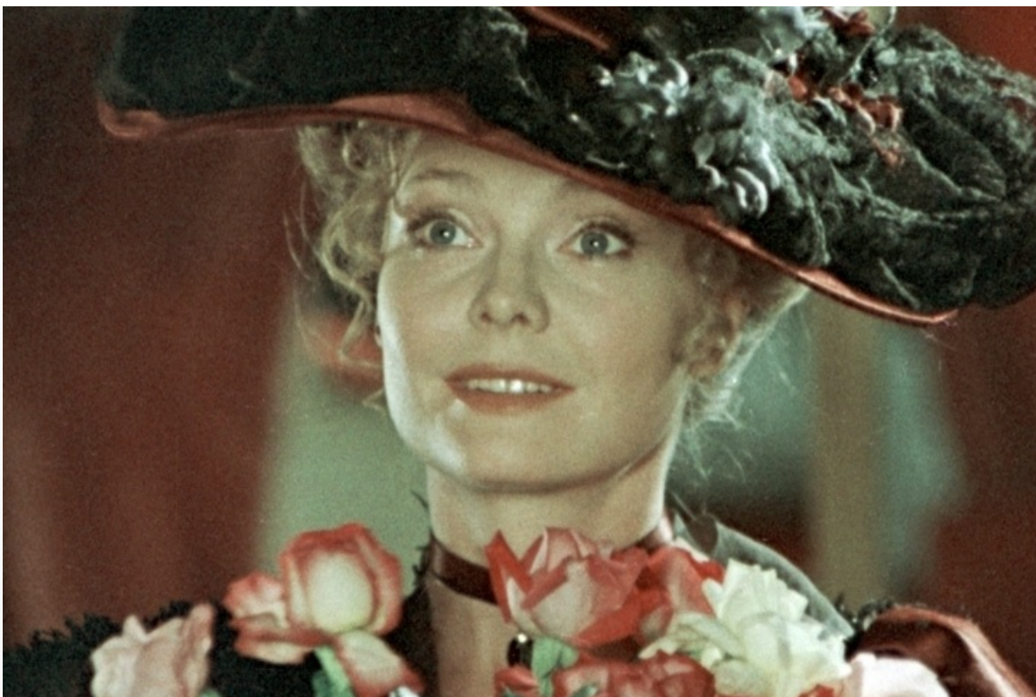
«Принцесса цирка», 1982 год