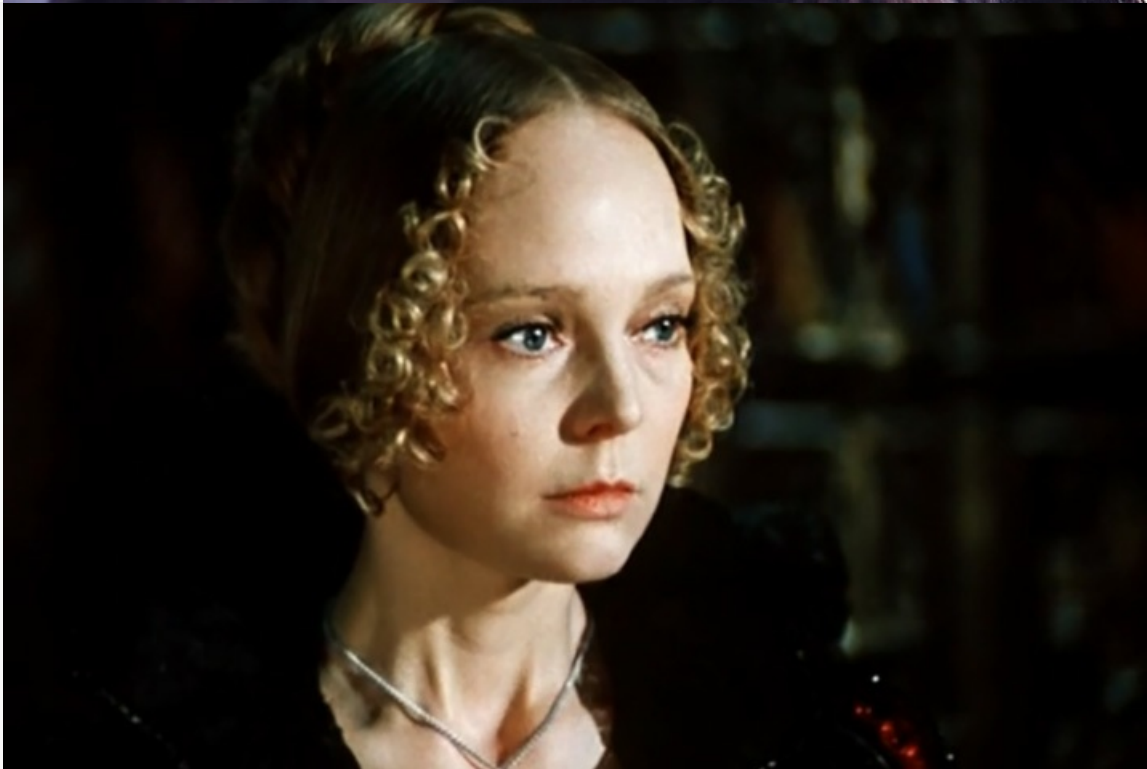
«Маленькие трагедии», 1979 год