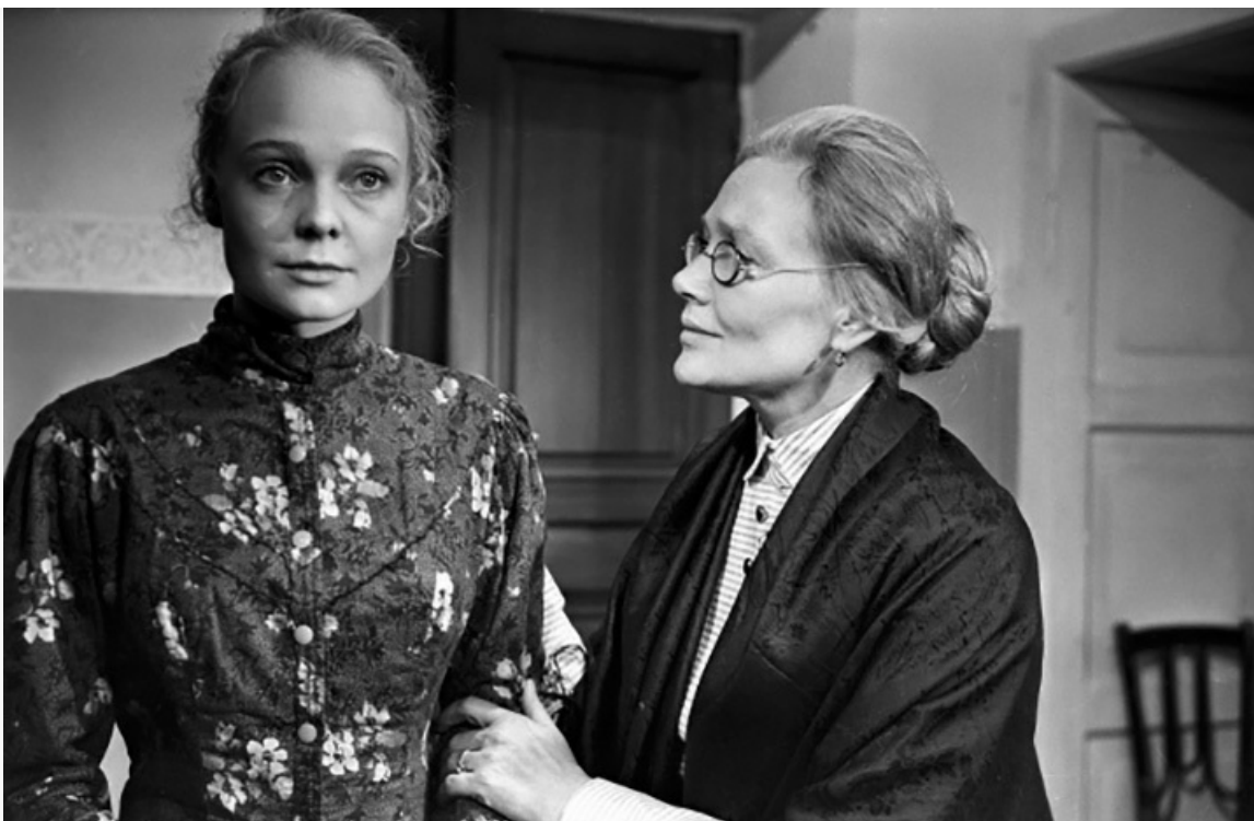
«Надежда», 1973 год