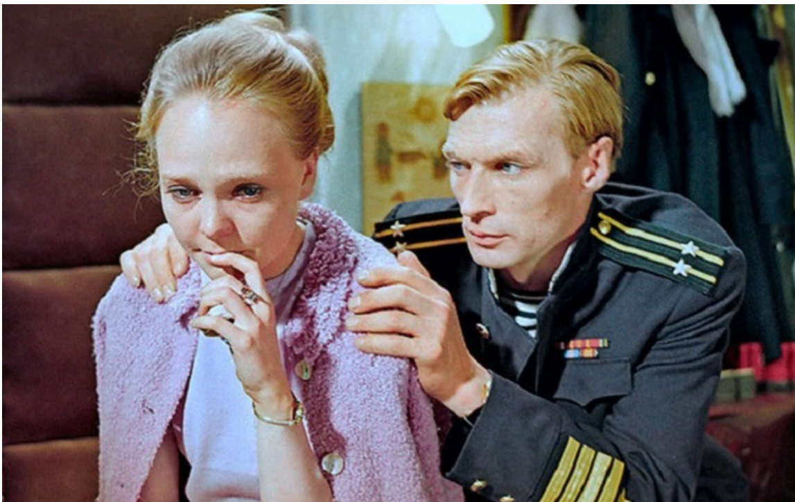
В 1974 году Наталия

Белохвостикова вышла замуж за культового советского кинорежиссёра Владимира Наумова, у которого впоследствии снялась в фильмах «Легенда о Тиле», «Тегеран-43», «Берег», «Выбор», «Закон», «Десять лет без права переписки», «Белый праздник», «Часы без стрелок», «Джоконда на асфальте».