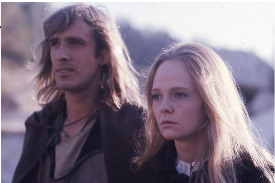
Дона Анна в фильме