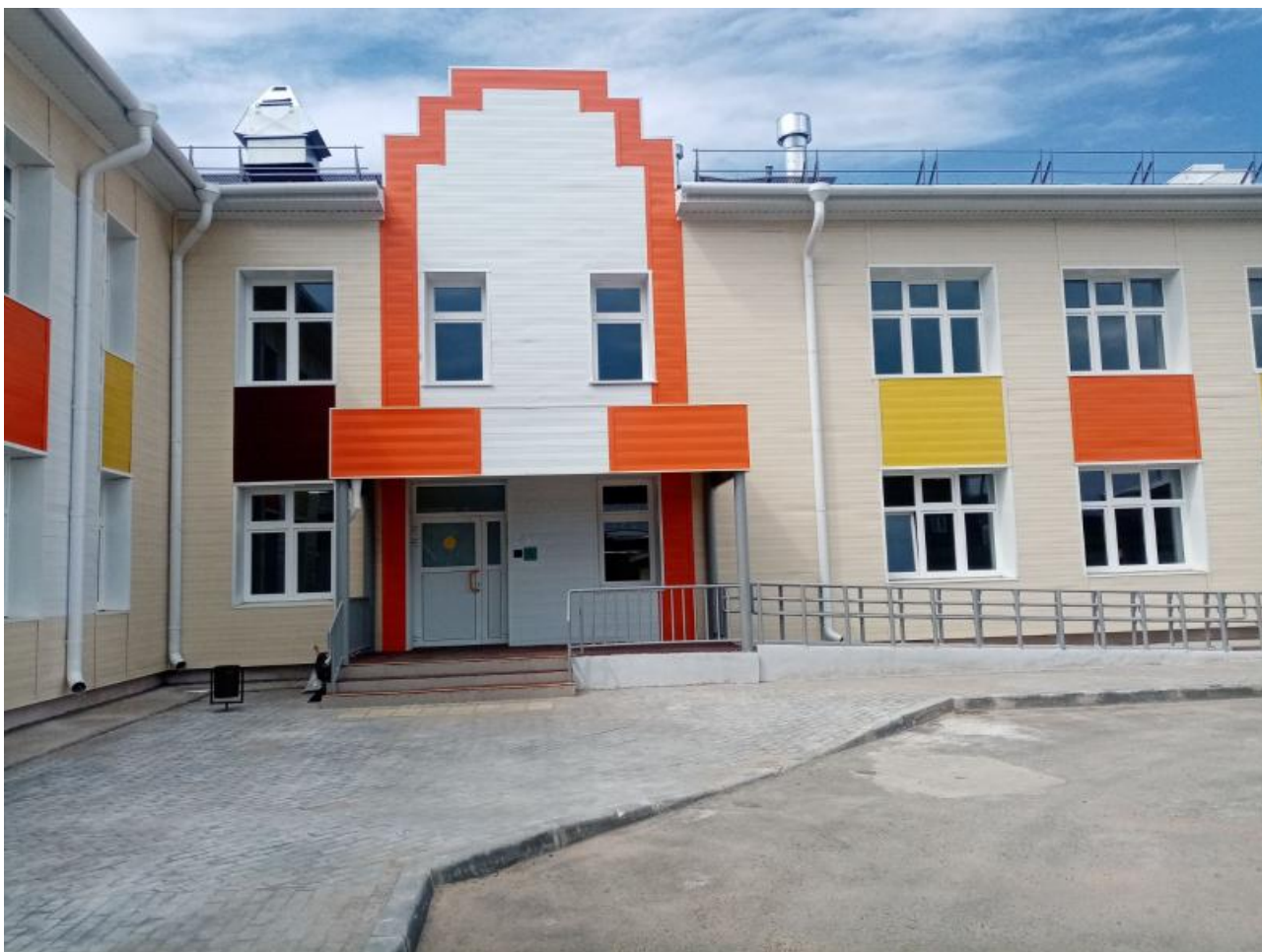
Ранее в Бабре