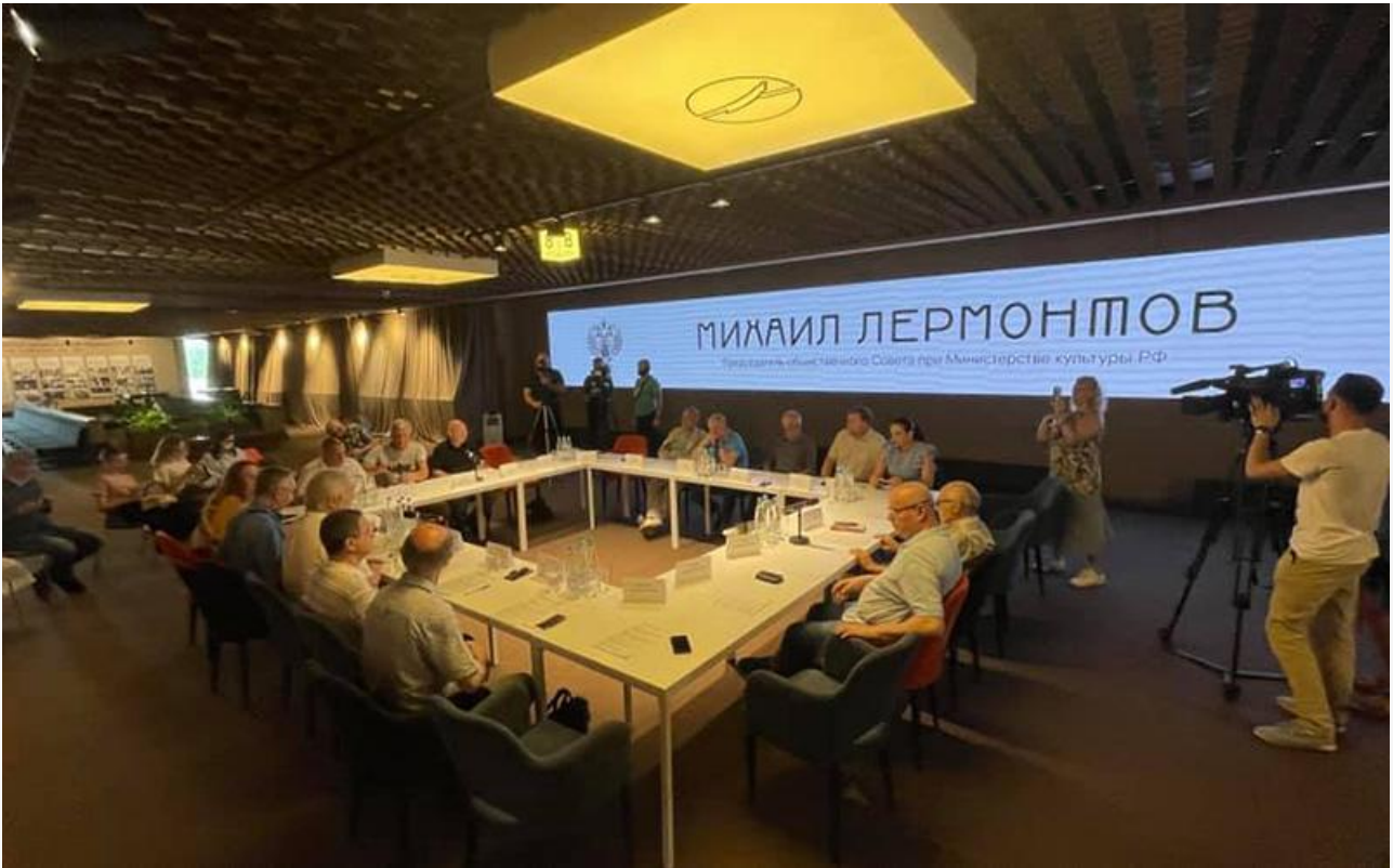
Общественный совет решает судьбу МХАТа

Отдельно по теме высказался председатель Общественного совета при Министерстве культуры Михаил Юрьевич Лермонтов, отметивший, что «в деятельности театра заметна позитивная тенденция следования национальным целям».