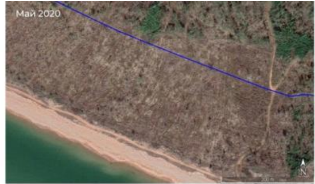
Сплошная вырубка 2012-2013 гг. в водоохранной зоне на северо-восточном побережье залива Кама. За семь лет, прошедших с рубки, лес так и не восстановился.