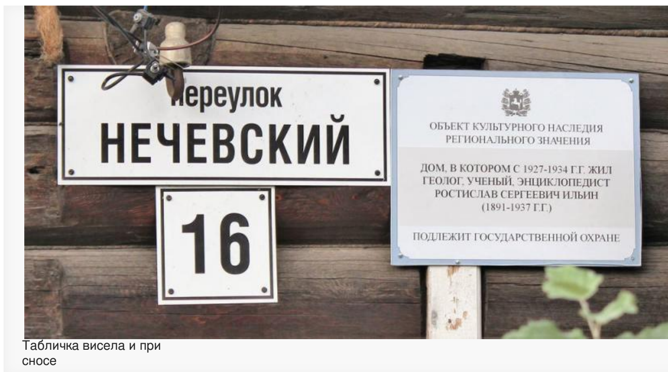
Табличка висела и при сносе

трассы Томск-Чулым; работал в Томском краевом музее, подготовил несколько работ о геологическом строении окрестностей Томска и Томь-Яйского водораздела; в 1930-1937 годы читал лекции в ТГУ. 12 июня 1937 года снова арестован. 11 сентября 1937 года расстрелян в Томской тюрьме.