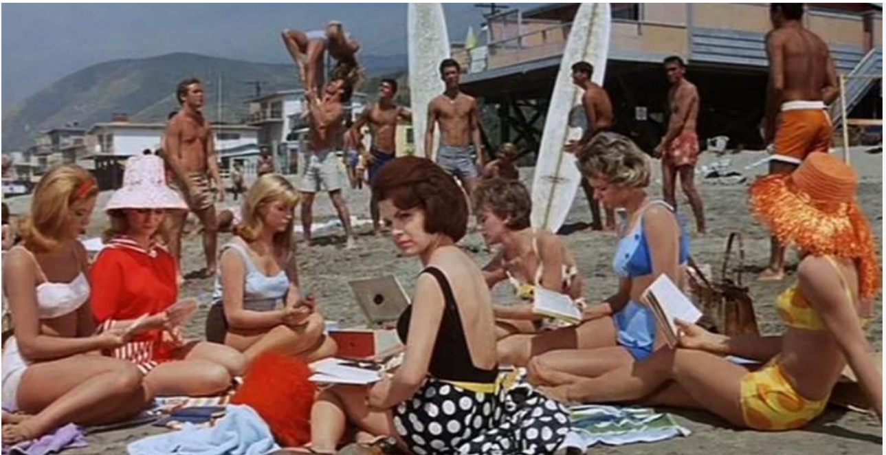
Кадр из фильма «Пляжная вечеринка», 1963 год

После этого все разговоры о безнравственности сегодняшнего именинника окончательно сошли на нет, даже в целомудренном СССР. Достаточно вспомнить прошедшие через строгий цензорский надзор откровенную по советским меркам сцену с Натальей Селезнёвой в «Операции «Ы» и других приключениях Шурика» в 1965-м, а также сцены показа мод «Мини-бикини 69» и соблазнения Горбункова в комедии того же Леонида Гайдая «Бриллиантовая рука» в 1968-м.