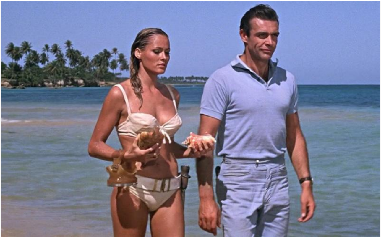
Урсула Андресс в фильме «Доктор Ноу», 1962 год