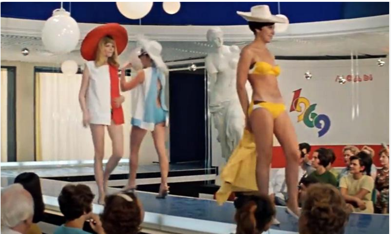
Кадр из фильма «Бриллиантовая рука», 1968 год

Сегодня бикини – это не только популярные купальники, но и официальная спортивная форма в женском пляжном волейболе, лёгкой атлетике, сёрфинге и других видах спорта, костюмы для выступления цирковых артисток и чирлидерш, униформа сотрудниц некоторых особо продвинутых автомоек и прочих учреждений,