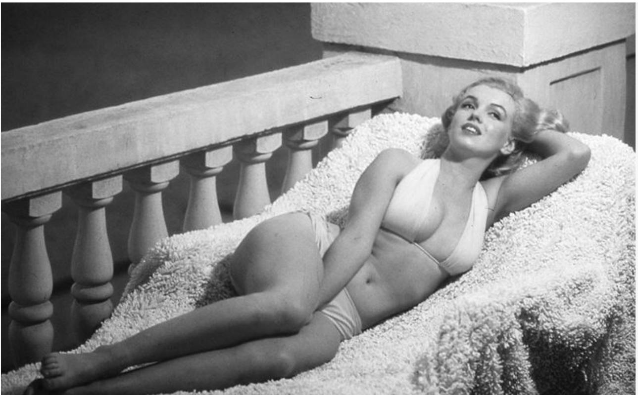
Мэрилин Монро.

Несколько лет после премьерной демонстрации бикини «развратный» купальник был запрещён к использованию на многих пляжах Европы. Для полного признания бикини обществом понадобилось ещё два десятилетия, а главным пропагандистом новой пляжной моды стал кинематограф во главе с секс-символами поколения Брижит Бардо и Мэрилин Монро .