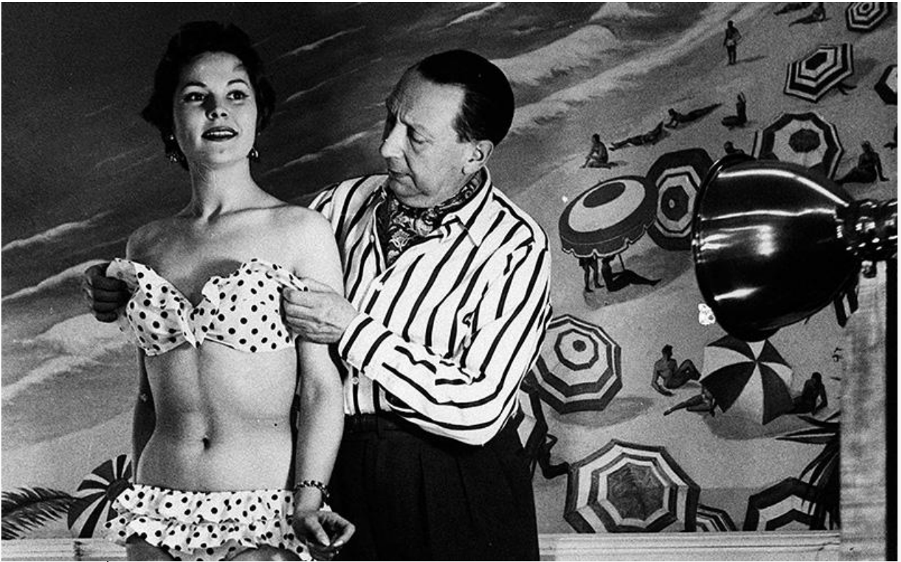
Луи Реар работает над новой моделью своего творения

Несколько лет после премьерной демонстрации бикини «развратный» купальник был запрещён к использованию на многих пляжах Европы. Для полного признания бикини обществом понадобилось ещё два десятилетия, а главным пропагандистом новой пляжной моды стал кинематограф во главе с секс-символами поколения Брижит Бардо и Мэрилин Монро .