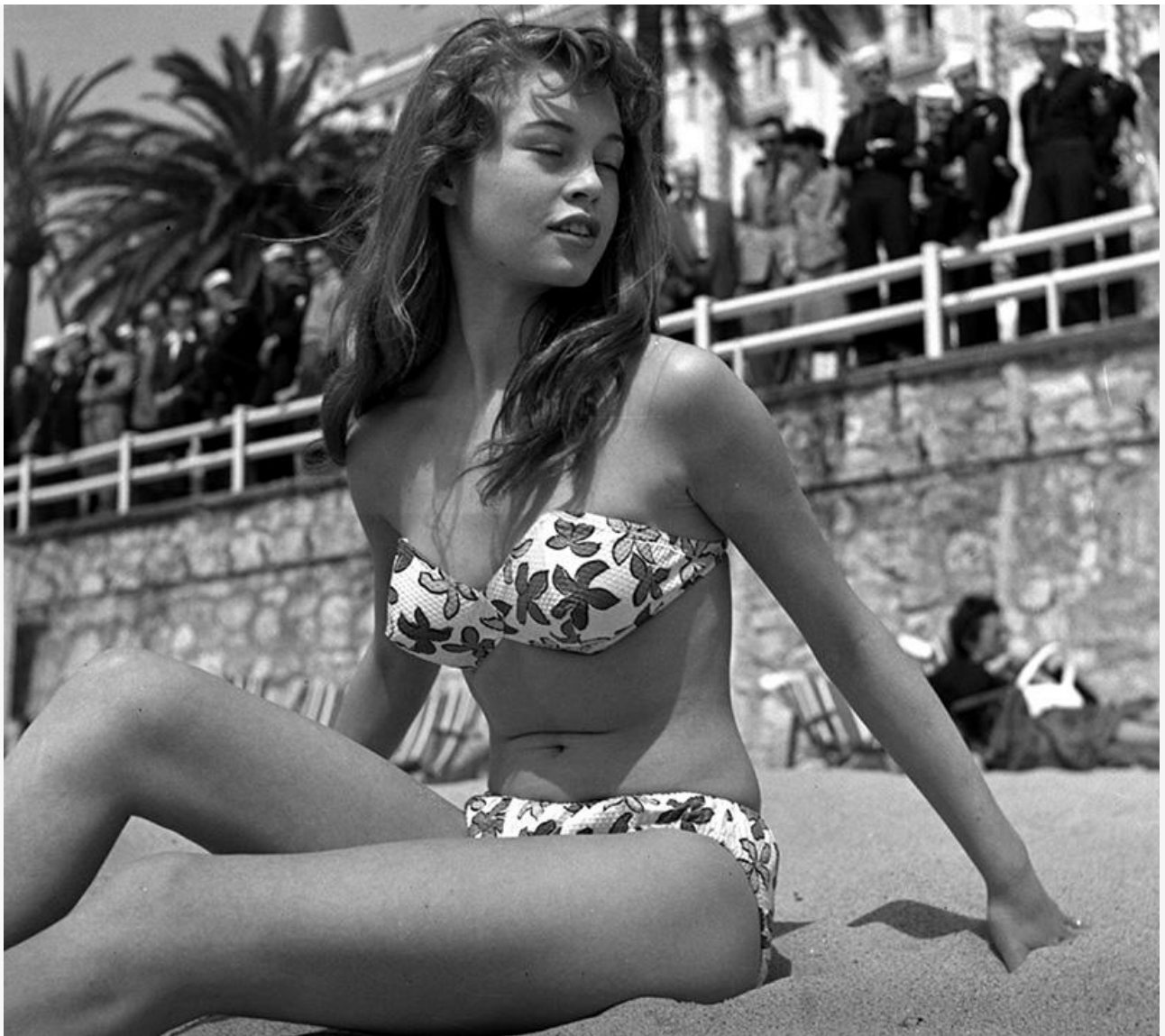
Брижит Бардо в Каннах, 1953 год

В 1962 году на киноэкраны вышел первый фильм легендарной бондианы «Доктор Ноу» с Шоном Коннери в роли Джеймса Бонда и Урсолой Андресс, полфильма прощеголявшей в открытом купальнике.