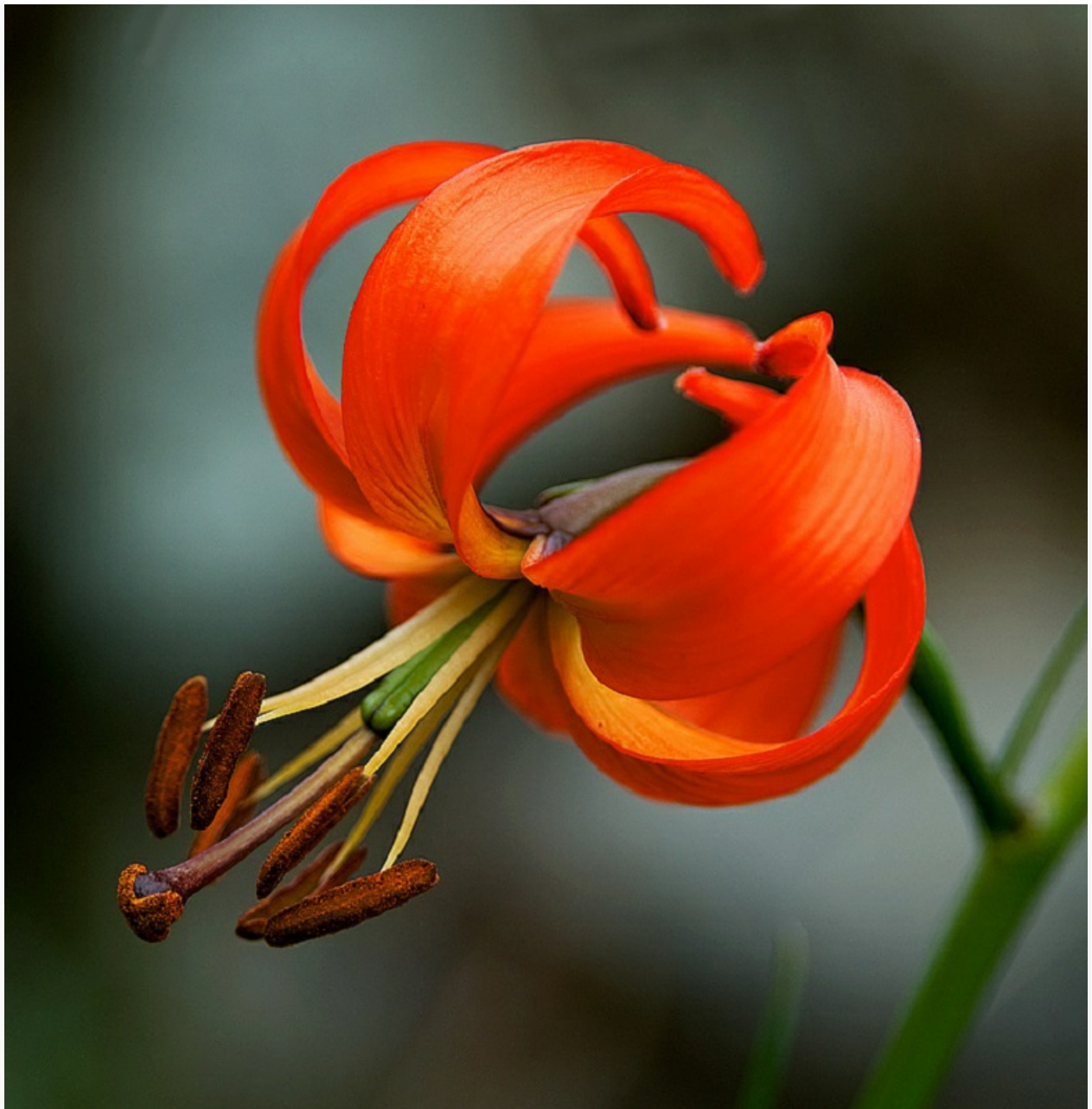
Lilium pumilum , произрастает на Байкале, занесена в Красную Книгу

Если животные могут уйти на новое место обитания, если на их привычном жилище вдруг раскинулась стройка, то растения – нет. Они просто исчезнут.