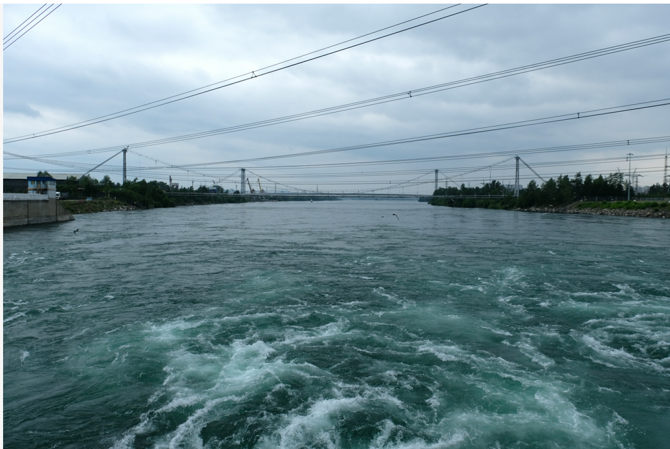
Автор: Алёна Штерн Фото из альбома "Иркутская ГЭС" © Фотобанк "RuBabr"

Автор: Алина Саратова © Babr24.com ПРОИСШЕСТВИЯ, НЕДВИЖИМОСТЬ, ИРКУТСК 👁 10663 02.07.2021, 10:18