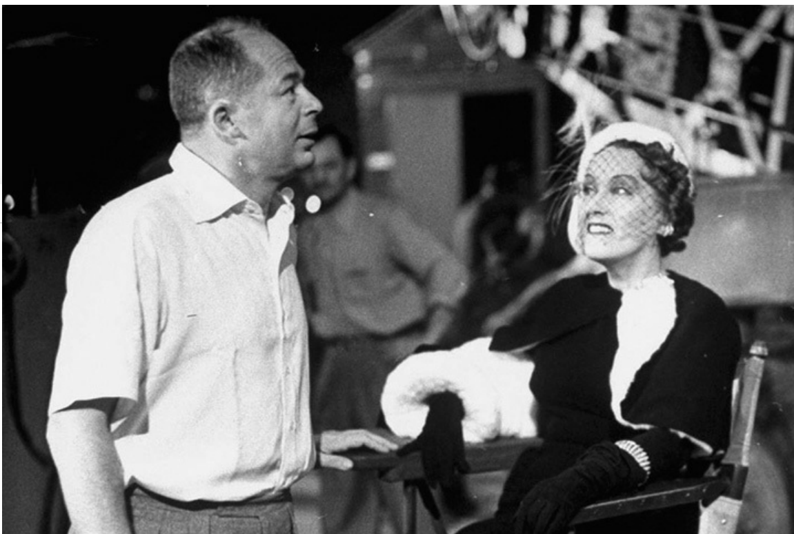
Кадр из фильма «Туз в рукаве», 1951 год.