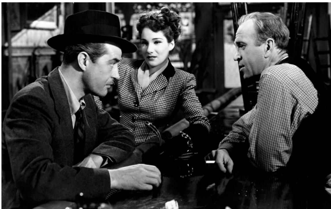
«Потерянный уикенд», 1945 год. Четыре премии «Оскар», в том числе за лучший фильм, лучшую режиссуру и лучший сценарий, три премии «Золотой глобус», в том числе за лучший фильм и лучшую режиссуру, Гран-при Каннского кинофестиваля