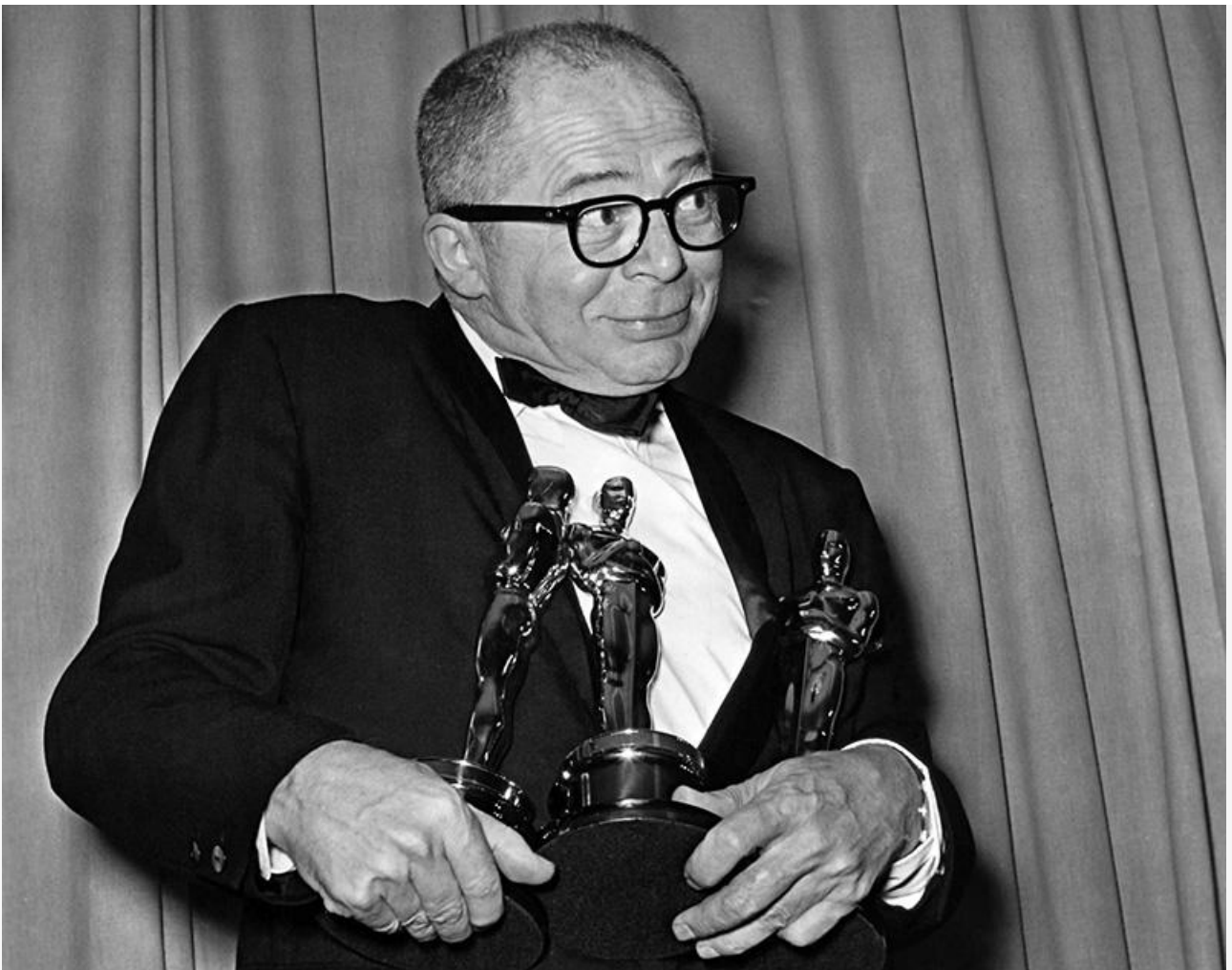
С тремя «Оскарами» за фильм «Квартира», 1961 год

Билли Уайлдер прожил долгую жизнь, несмотря на то что на редких фотографиях у него в руках нет сигареты или сигары. В 1981 году он ушёл из кино, и оставшиеся двадцать лет жизни прожил «в своё удовольствие», не забывая собирать заслуженные награды: Премия имени Ирвинга Тальберга за выдающийся продюсерский вклад в развитие кинопроизводства в 1988-м, Почётный «Золотой медведь» Берлинского кинофестиваля в 1993-м, приз «Человек года» от Британской киноакадемии в 1996-м. Ещё ранее, в 1972 году, Билли Уайлдеру был вручён «Золотой лев» Венецианского кинофестиваля за вклад в мировой кинематограф.