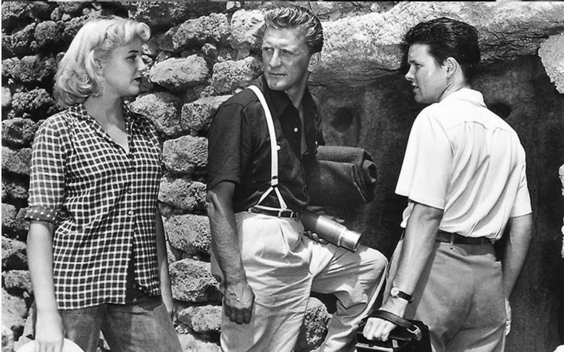
Международная премия Венецианского кинофестиваля