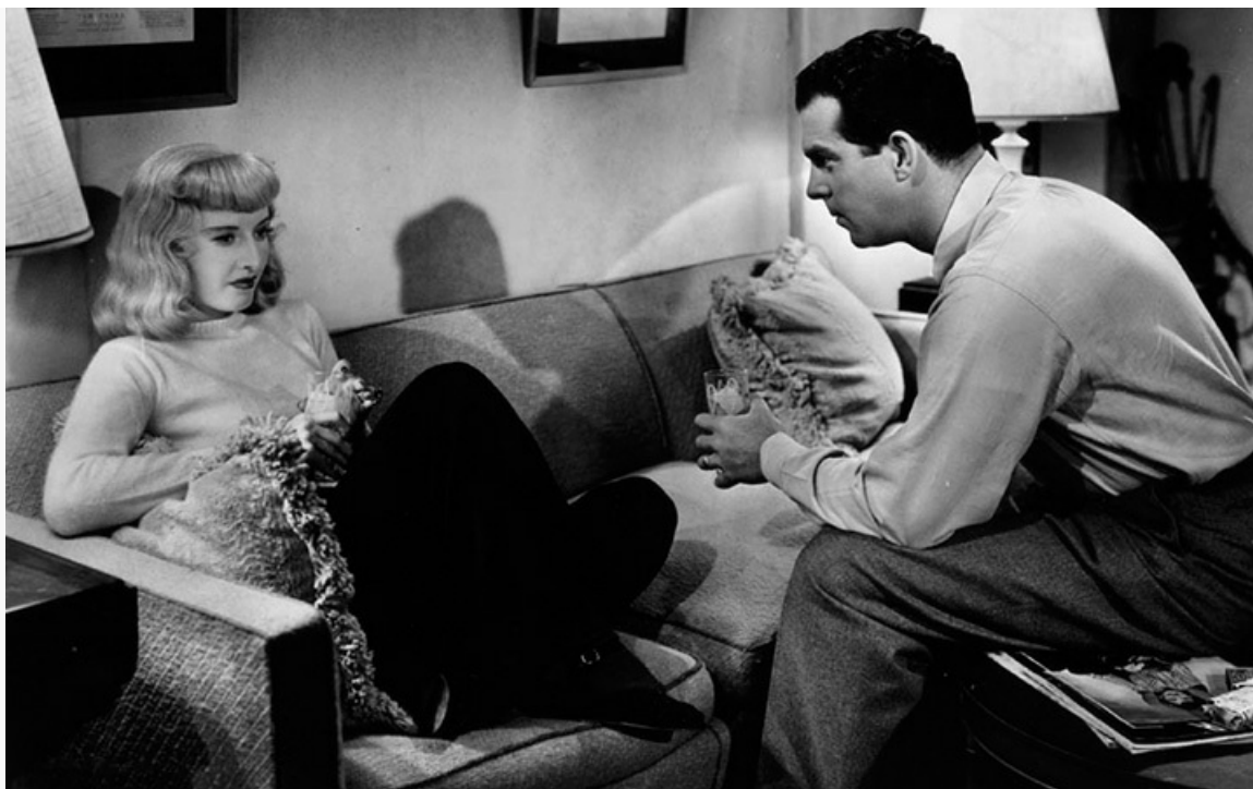
страховка», 1944 год