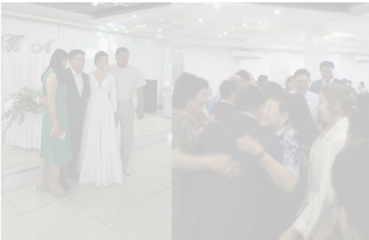
«Семейская горница» (buryat_again)

В разгар третьей волны COVID-19 член регионального парламента от КПРФ Тимур Нимаев устроил свадебное торжество на 300 человек. Понесет ли наказание организатор ковидной вечеринки – пока неизвестно, однако дело по этому поводу уже открыто.