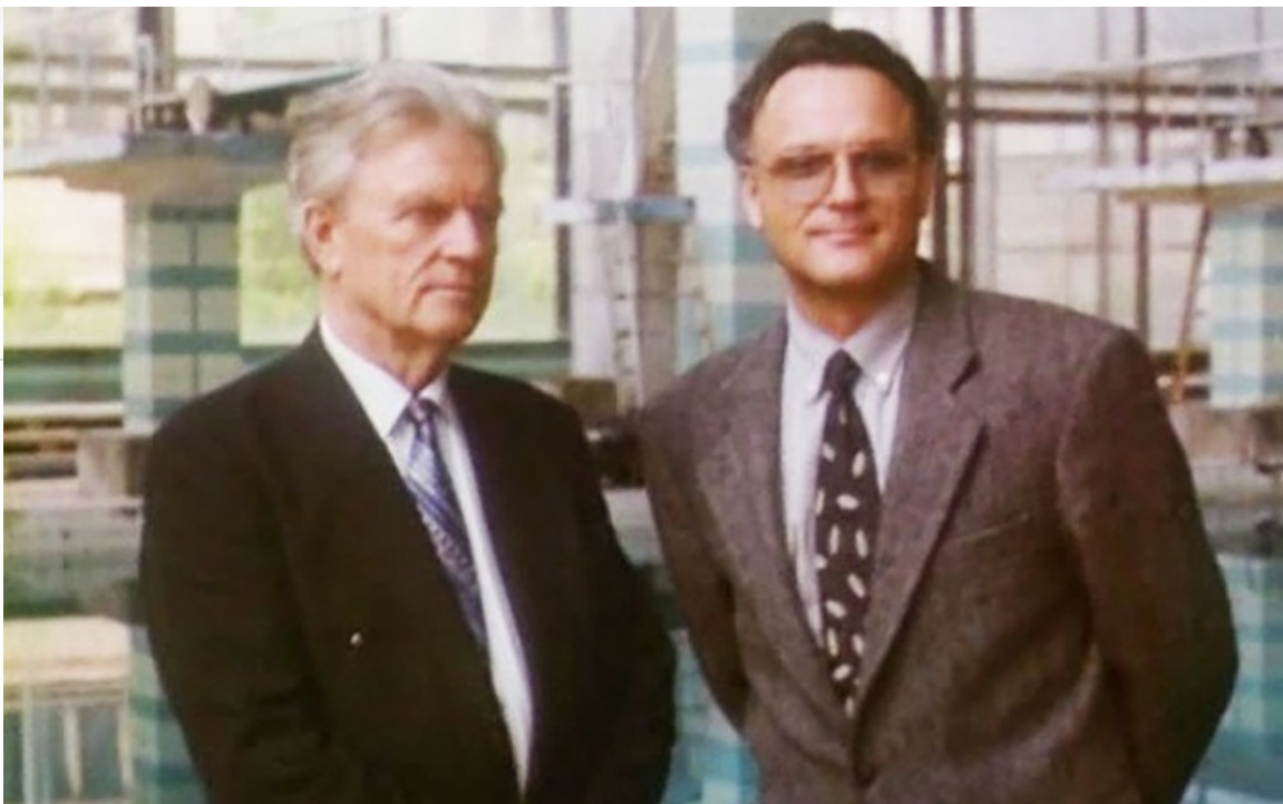
Старший и младший Ерёмченко в фильме «Сын за отца», 1995 год

В последний раз легендарный актёр появился на экранах в образе начальника отделения УВД Зареченска в сериале Дмитрия Астрахана «Зал ожидания». Фильм вышел на экраны в марте 1998 года.