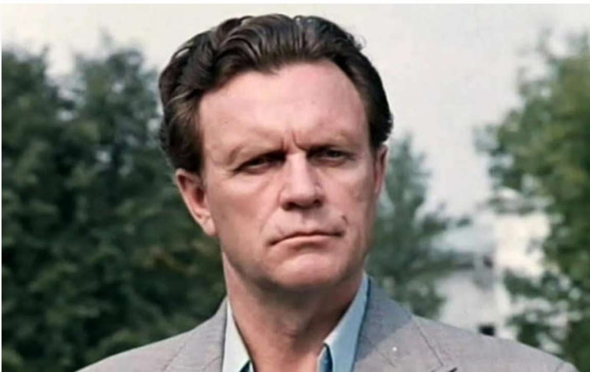
«Молодость с нами», 1978 год

Одной из последних ролей в кино белорусской звезды стала роль пластического хирурга Александра Николаевича в драме «Сын за отца» – единственной режиссёрской работе его сына, народного артиста России Николая Ерёмченко-младшего .