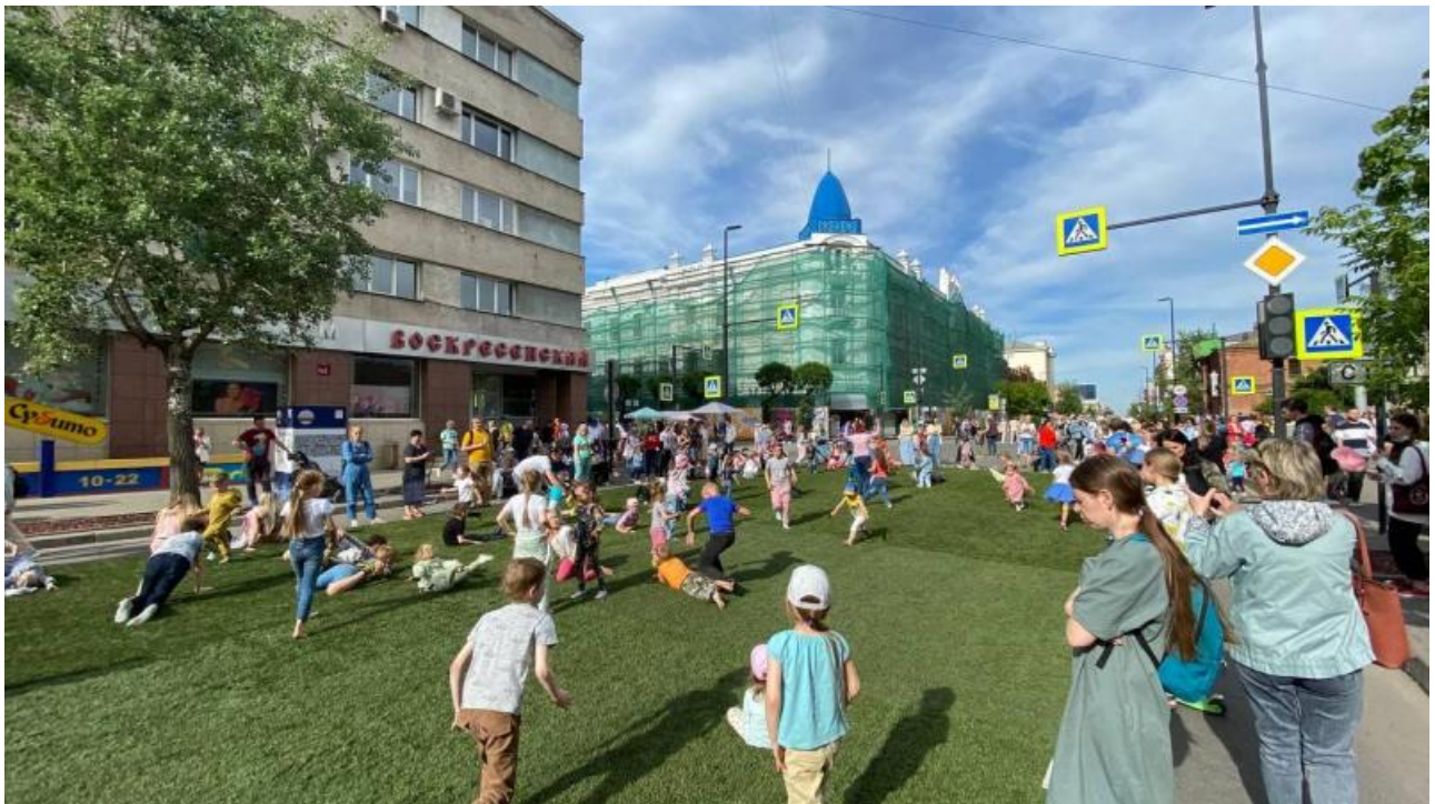
Дети играли на площадке магазина настольных игр «Мосигра» в большой конструктор, «Цивилизацию» или «Мафию». Родители же рядом перекусывали в азиатской забегаловке.