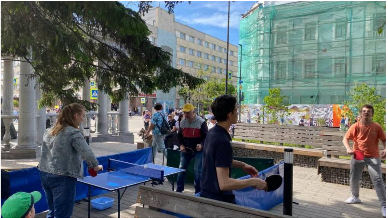
Напротив «Детского мира» большая толпа смотрела на выступление местных танцевальных детских коллективов и гимнасток.