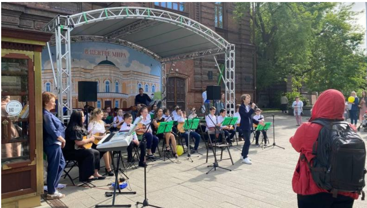
Лекцию горожане слушали, качаясь на качелях, играя в пинг-понг или перекусывая на лавочках рядом со сценой.