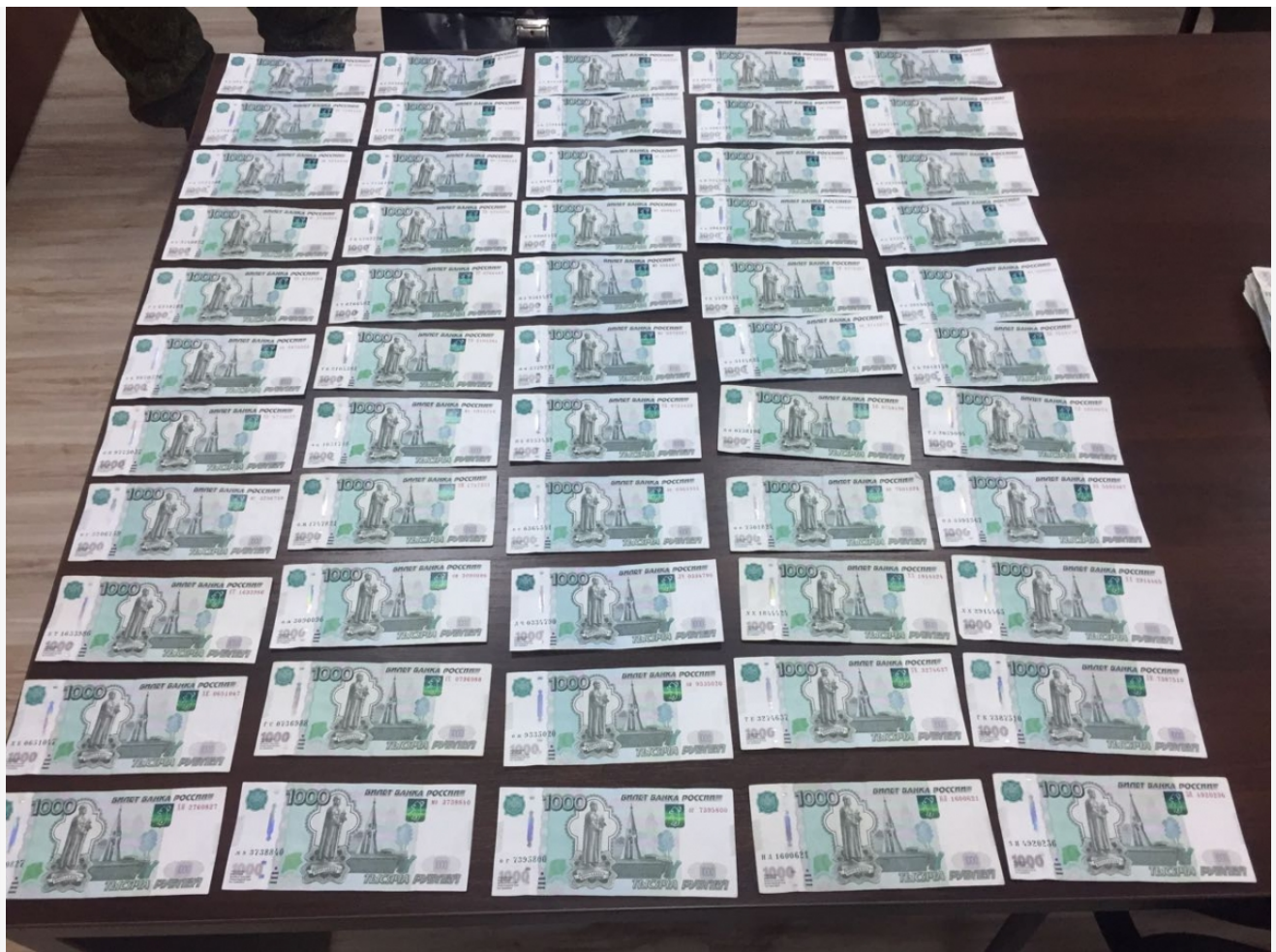
Фото из альбома "Деньги" © Фотобанк "RuBabr"

Автор: Андрей Воронецкий © Babr24.com ЭКОНОМИКА И БИЗНЕС, ОБЩЕСТВО, ТОМСК 23771 16.06.2021, 18:06